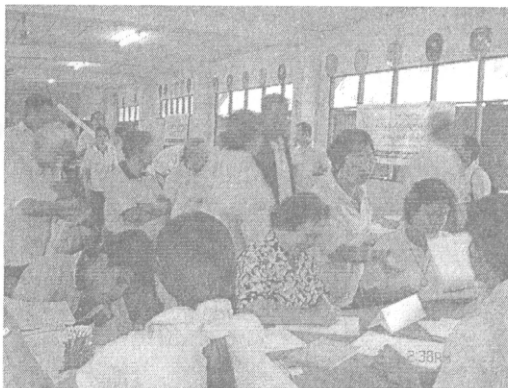
ภาพที่ 6 ประชาชนสมัครเป็นสมาชิกของกองทุนสวัสดิการชุมชน อำเภอไชยาใน วัยแรกของการเปิดรับสมัคร