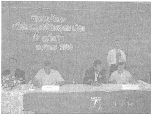
ภาพที่ 5 พิธีลงนามในบันทึกข้อตกลง กับองค์กรสาขา