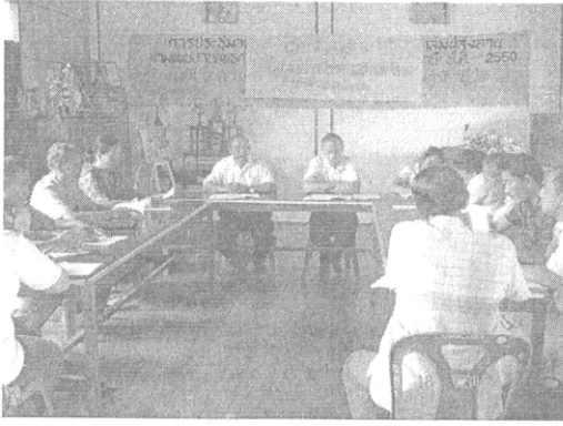
ภาพที่ 4 คณะกรรมการบริหารเครือข่ายชุดที่ 1