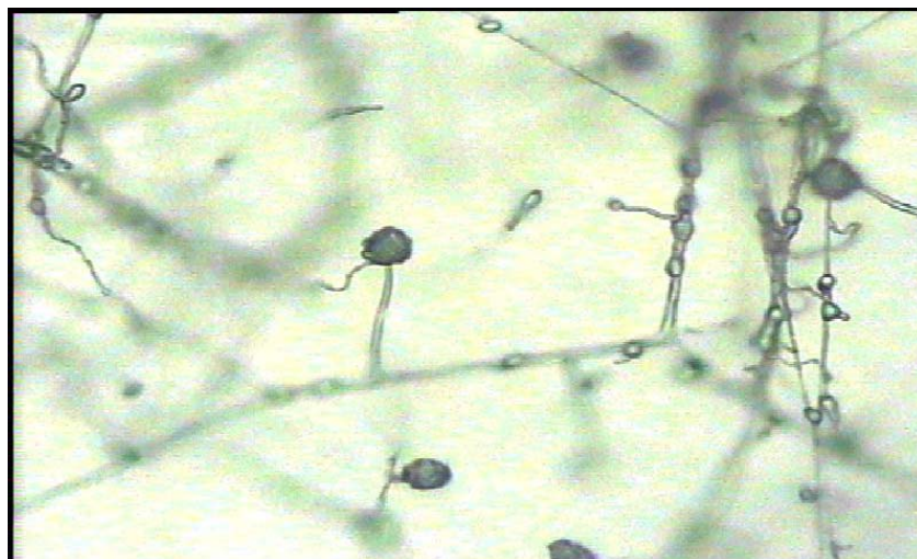
ภาพประกอบภาคผนวก 2 ลักษณะทางสัณฐานวิทยาของ Fusarium sp.