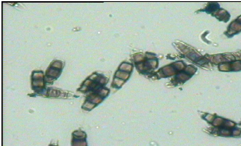
ภาพประกอบภาคผนวก 4 ลักษณะทางสัณฐานวิทยาของ Pestalotia sp.