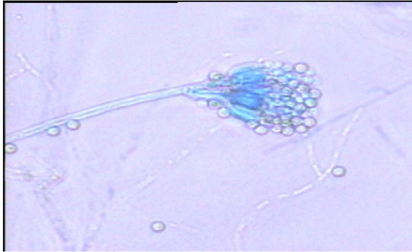
ภาพประกอบภาคผนวก 3 ลักษณะทางสัณฐานวิทยาของ Penicillium sp.