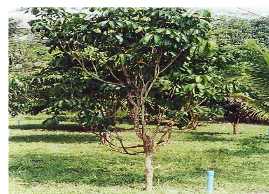
ภาพภาคผนวกที่ 2 สภาพต้นลองกอง อายุ 10 ปี ในสภาพแปลงปลูก ภาควิชาพืชศาสตร์