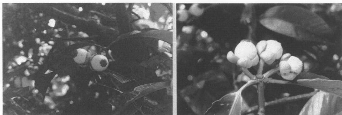
รูปผนวกที่ 4 การติดผลของต้นมังคุดเสียบยอดด้วยกิ่งข้าง