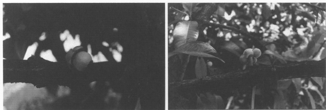
รูปผนวกที่ 5 การติดผลของต้นมังคุดเสียบยอดด้วยกิ่งข้างบริเวณกิ่งหลักของต้นมังคุด