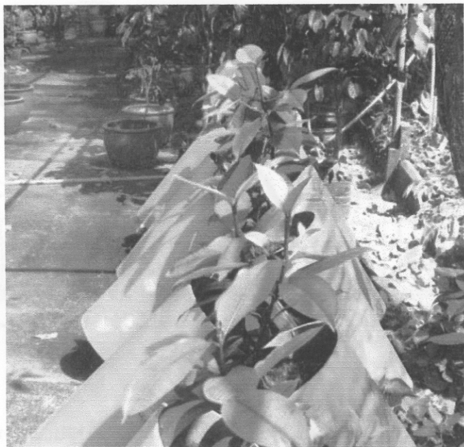
รูปผนวกที่ 1 แสดงการปลูกต้นกล้ามังคุดเพาะเมล็ดในมินิโรไซตรอน