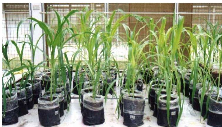
ภาพภาคผนวกที่ 12 สภาพโดยทั่วไป และลักษณะการวางสิ่งทดลองต่าง ๆ