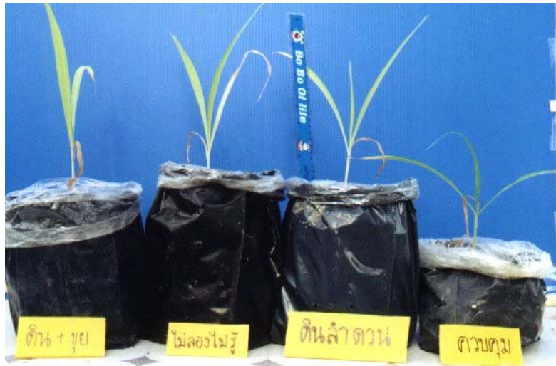
ภาพภาคผนวกที่ 13 ข้าวโพดหวานเมื่ออายุประมาณ 4 สัปดาห์ในสิ่งทดลองที่ 2 (S + C), สิ่งทดลองที่ 21 (CS2), สิ่งทดลองที่ 20 (CS1) และสิ่งทดลองที่ 1 (S) (ดูจากซ้ายไปขวา)