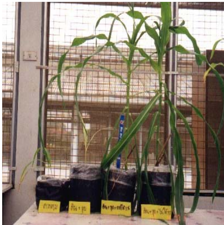
ภาพภาคผนวกที่ 17 ข้าวโพดหวานเมื่ออายุประมาณ 6 สัปดาห์ในสิ่งทดลองที่ 1 (S), สิ่งทดลองที่ 2 (S + C), สิ่งทดลองที่ 4 (S + C + 1%Wa) และสิ่งทดลองที่ 8 (S + C + 1%W) (ดูจากซ้ายไปขวา)