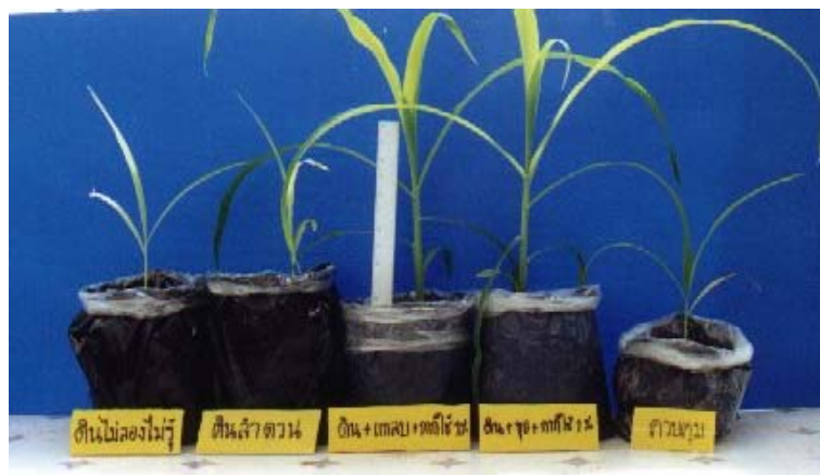
ภาพภาคผนวกที่ 11 ข้าวโพดหวานเมื่ออายุประมาณ 3 สัปดาห์ในสิ่งทดลองที่ 21 (CS2), สิ่งทดลองที่ 20 (CS1) สิ่งทดลองที่ 12 (S + H + 1%Wa), สิ่งทดลองที่ 4 (S + C + 1%Wa) และ สิ่งทดลองที่ 1 (S) (ดูจากซ้ายไปขวา)