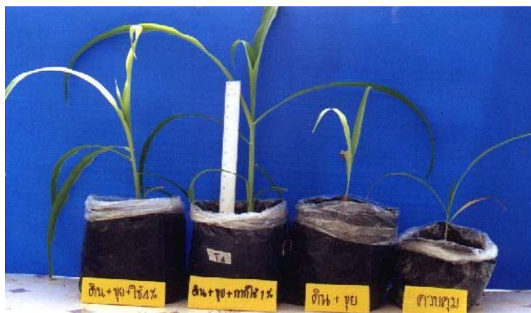
ภาพภาคผนวกที่ 9 ข้าวโพดหวานเมื่ออายุประมาณ 3 สัปดาห์ในสิ่งทดลองที่ 7 (S + C + 4%Wa), สิ่งทดลองที่ 4 (S + C + 1%Wa) สิ่งทดลองที่ 2 (S + C) และ สิ่งทดลองที่ 1 (S) (ดูจากซ้ายไปขวา)