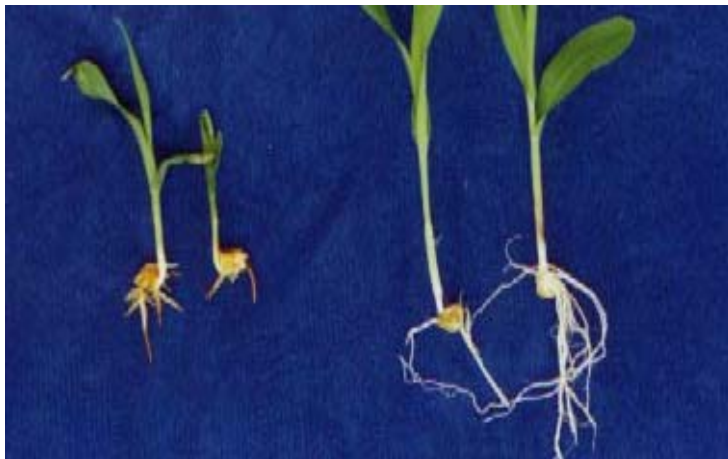
ภาพภาคผนวกที่ 1 ลักษณะรากของข้าวโพดหวานของสิ่งทดลองที่ 19 (S + H+ 4%W) เปรียบเทียบกับสิ่งทดลองที่ 11 (S + C + 4%W) (ดูจากซ้ายไปขวา)