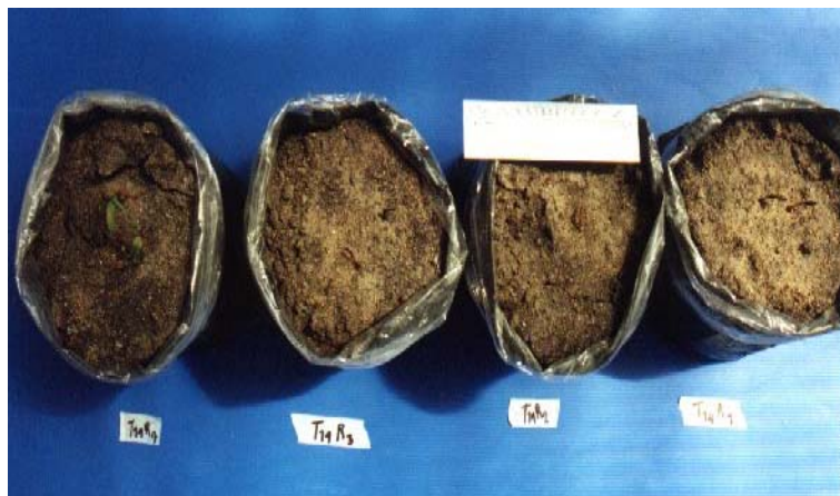
ภาพภาคผนวกที่ 8 ลักษณะของข้าวโพดหวานในสิ่งทดลองที่ 19 (S + H + 4%W) ทั้ง 4 ซ้ำ เมื่ออายุประมาณ 2 สัปดาห์