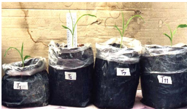
ภาพภาคผนวกที่ 2 ข้าวโพดหวานเมื่ออายุประมาณ 1 สัปดาห์ในสิ่งทดลองที่ 1 (S), สิ่งทดลองที่ 2 (S + C), สิ่งทดลองที่ 7 (S + C + 4%Wa) และสิ่งทดลองที่ 11 (S + C + 4%W) (ดูจากซ้ายไปขวา)