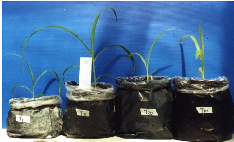
ภาพภาคผนวกที่ 7 ข้าวโพดหวานเมื่ออายุประมาณ 2 สัปดาห์ในสิ่งทดลองที่ 1 (S), สิ่งทดลองที่ 4 (S + C + 1%Wa), สิ่งทดลองที่ 20 (CS1) และสิ่งทดลองที่ 21 (CS2) (ดูจากซ้ายไปขวา)