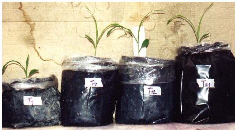
ภาพภาคผนวกที่ 5 ข้าวโพดหวานเมื่ออายุประมาณ 1 สัปดาห์ในสิ่งทดลองที่ 1 (S), สิ่งทดลองที่ 7 (S + C + 4%Wa), สิ่งทดลองที่ 12 (S + H+ 1%Wa) และสิ่งทดลองที่ 21 (CS2) (ดูจากซ้ายไปขวา)