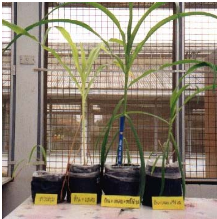
ภาพภาคผนวกที่ 15 ข้าวโพดหวานเมื่ออายุประมาณ 5 สัปดาห์ในสิ่งทดลองที่ 1 (S), สิ่งทดลองที่ 3 (S + H), สิ่งทดลองที่ 12 (S + H + 1%Wa) และสิ่งทดลองที่ 15 (S + H + 4%Wa) (ดูจากซ้ายไปขวา)