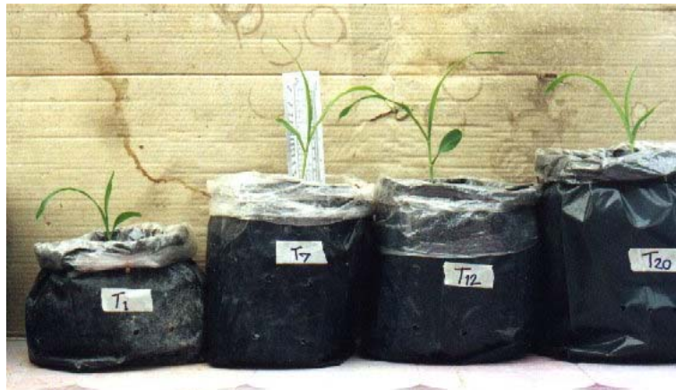
ภาพภาคผนวกที่ 4 ข้าวโพดหวานเมื่ออายุประมาณ 1 สัปดาห์ในสิ่งทดลองที่ 1 (S), สิ่งทดลองที่ 7 (S + C + 4%Wa), สิ่งทดลองที่ 12 (S + H+ 1%Wa) และสิ่งทดลองที่ 20 (CS1) (ดูจากซ้ายไปขวา)