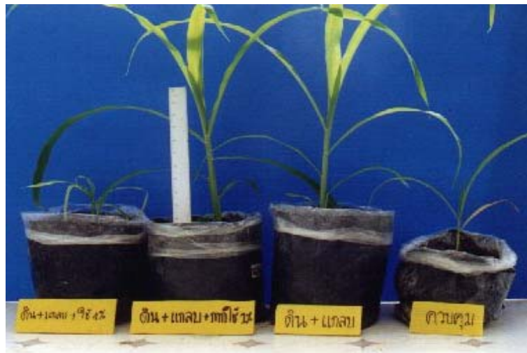
ภาพภาคผนวกที่ 10 ข้าวโพดหวานเมื่ออายุประมาณ 3 สัปดาห์ในสิ่งทดลองที่ 15 (S + H+ 4%Wa), สิ่งทดลองที่ 12 (S + H+ 1%Wa), สิ่งทดลองที่ 3 (S + H) และสิ่งทดลองที่ 1 (S) (ดูจากซ้ายไปขวา)