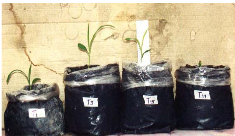
ภาพภาคผนวกที่ 3 ข้าวโพดหวานเมื่ออายุประมาณ 1 สัปดาห์ในสิ่งทดลองที่ 1 (S), สิ่งทดลองที่ 3 (S + H), สิ่งทดลองที่ 15 (S + H+ 4%Wa) และสิ่งทดลองที่ 19 (S + H+ 4%W) (ดูจากซ้ายไปขวา)