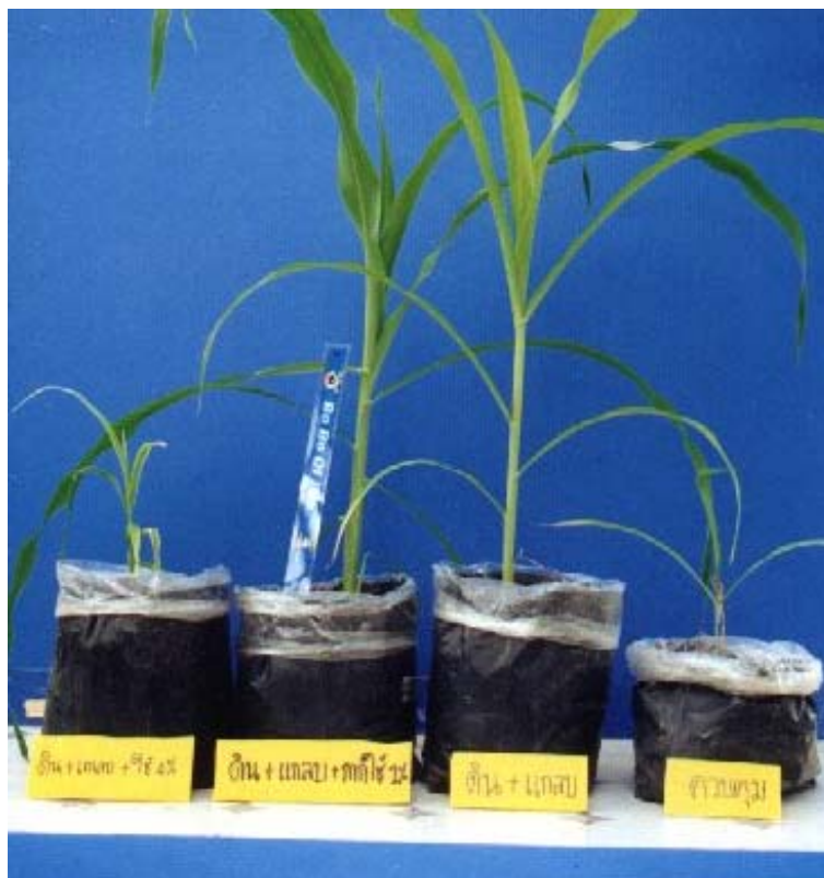
ภาพภาคผนวกที่ 14 ข้าวโพดหวานเมื่ออายุประมาณ 4 สัปดาห์ในสิ่งทดลองที่ 15 (S + H + 4%Wa), สิ่งทดลองที่ 12 (S + H + 1%Wa), สิ่งทดลองที่ 3 (S + H) และสิ่งทดลองที่ 1 (S) (ดูจากซ้ายไปขวา)