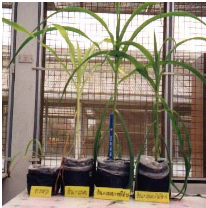
ภาพภาคผนวกที่ 18 ข้าวโพดหวานเมื่ออายุประมาณ 6 สัปดาห์ในสิ่งทดลองที่ 1 (S), สิ่งทดลองที่ 3 (S + H), สิ่งทดลองที่ 12 (S + H + 1%Wa) และสิ่งทดลองที่ 16 (S + H + 1%W) (ดูจากซ้ายไปขวา)