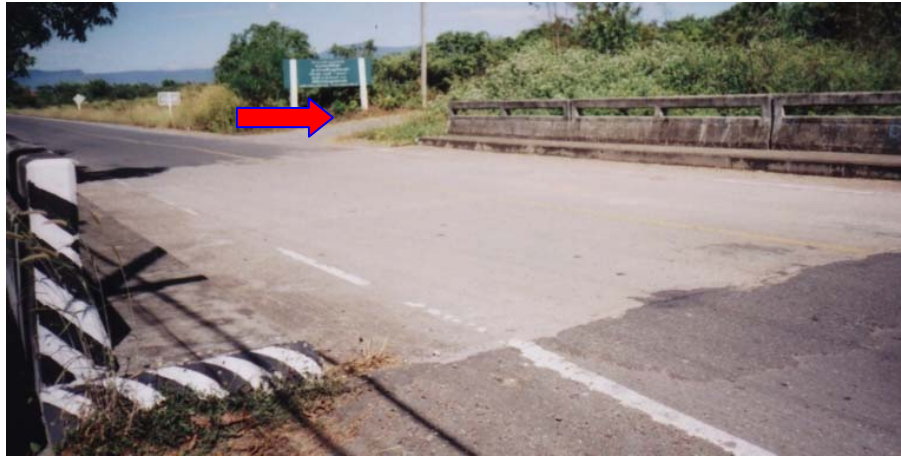
ภาพประกอบที่ จ.10 ตำแหน่งทางแยกห่างจากสะพานน้อยกว่า 40 เมตร