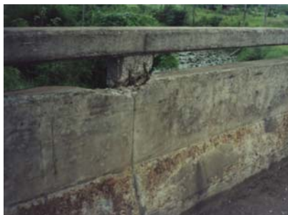
ภาพประกอบที่ จ.3 สภาพรอยแตกร้าวของราวสะพาน