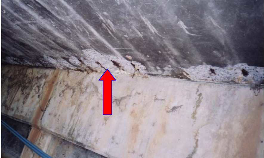
ภาพประกอบที่ จ.17 สภาพความเสียหายของพื้นสะพานที่แตกกะเทาะ