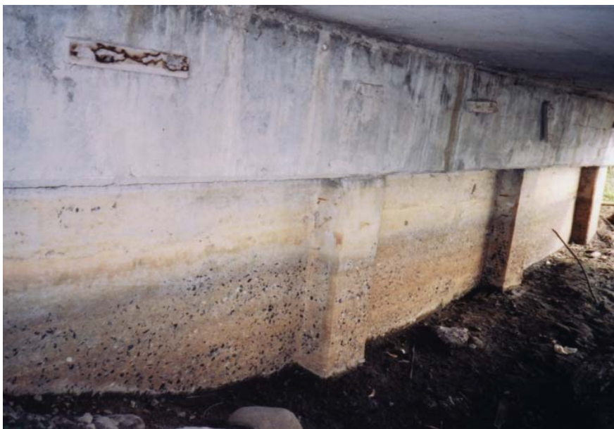
ภาพประกอบที่ จ.17 สภาพความเสียหายของตอม่อริมฝั่งที่ผิวหน้าหลุดร่อน