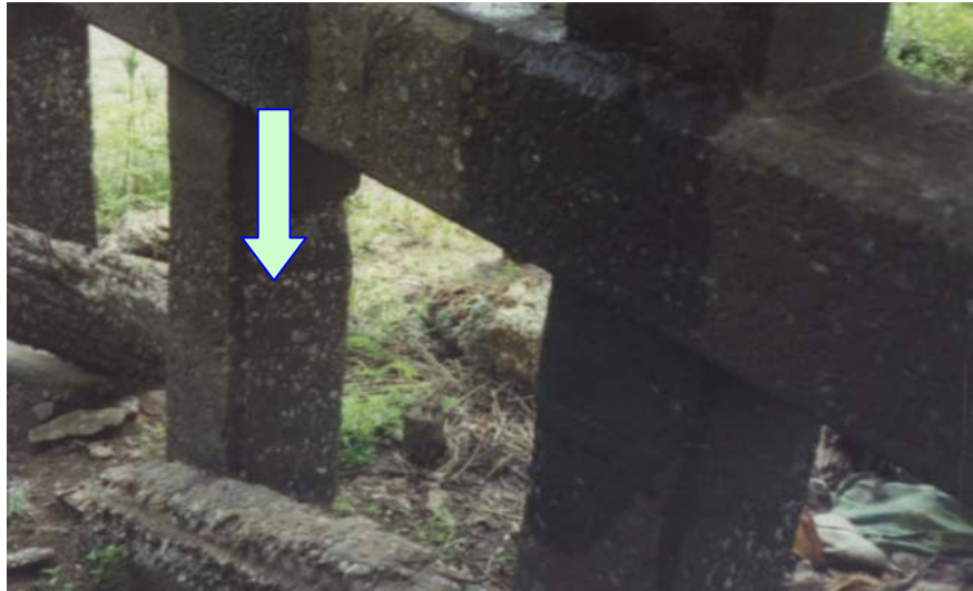
ภาพประกอบที่ จ.15 สภาพความเสียหายของฐานรากที่เป็นเสาเข็ม