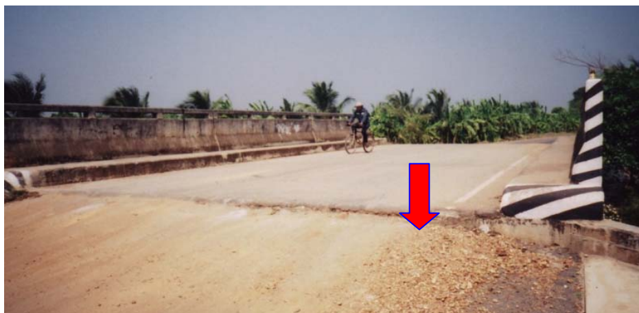
ภาพประกอบที่ จ.19 การทรุดตัวของดินถมคอสะพาน