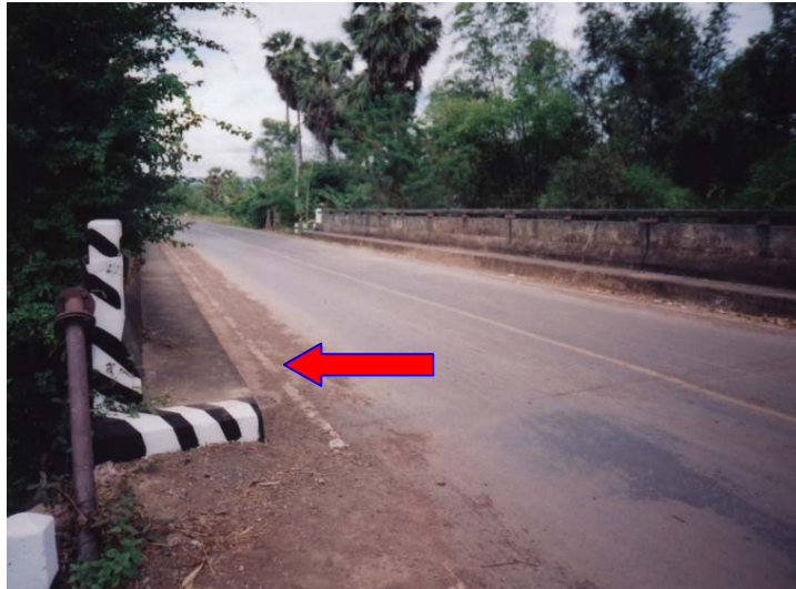
ภาพประกอบที่ จ.7 เศษดินบนฝิวจراجรมีผลต่อการระบายน้ำ