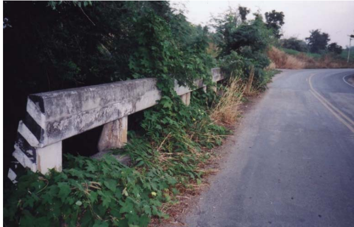
ภาพประกอบที่ จ.4 ทางเดินเท้าที่มีสภาพรกร้างเต็มไปด้วยวัชพืช