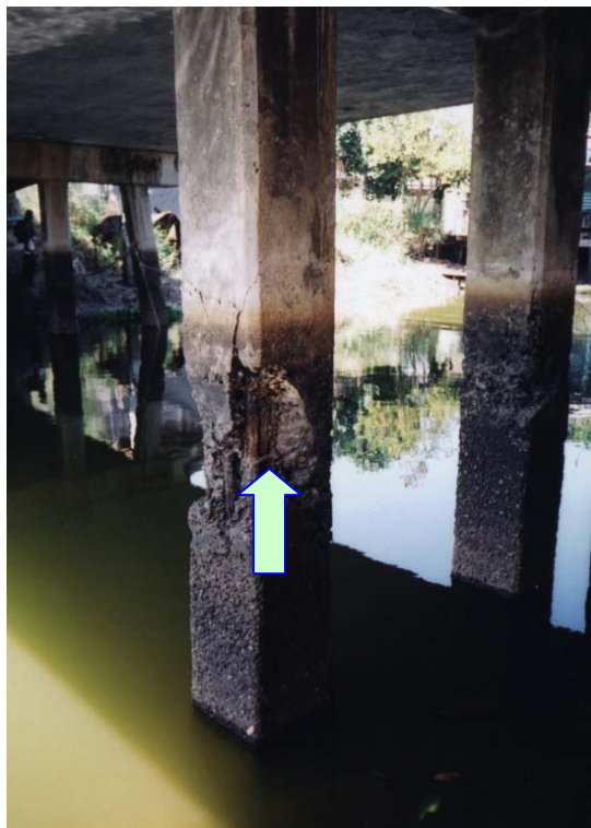
ภาพประกอบที่ จ.16 สภาพความเสียหายของตอม่อกลางน้ำที่แตกกะเทาะและผิวหน้าหลุดร่อน