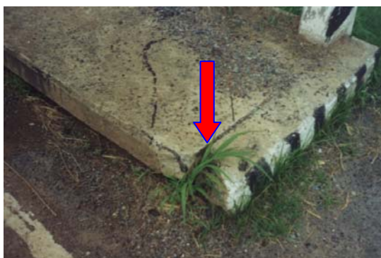
ภาพประกอบที่ จ.6 ทางเดินเท้าที่พบรอยแตกร้าว