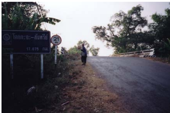
ภาพประกอบที่ จ.12 ตำแหน่งของสะพานอยู่ในโค้งดิ่งตั้ง