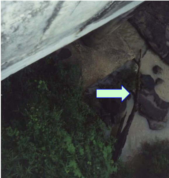
ภาพประกอบที่ จ.13 มีช่องไม้อยู่ในลำน้ำ