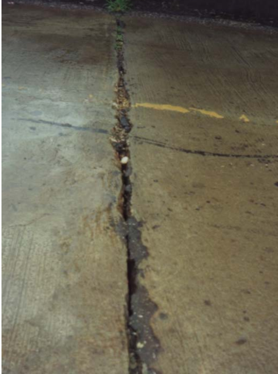
ภาพประกอบที่ จ.18 สภาพความเสียหายของรอยต่อพื้นสะพานที่วัสดุรอยต่อหลุดร่อน