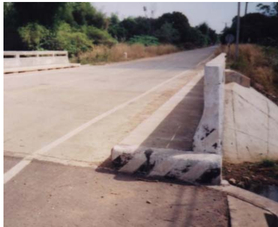
ภาพประกอบที่ จ.1 สภาพของสี่สะท้อนแสงของราวสะพาน