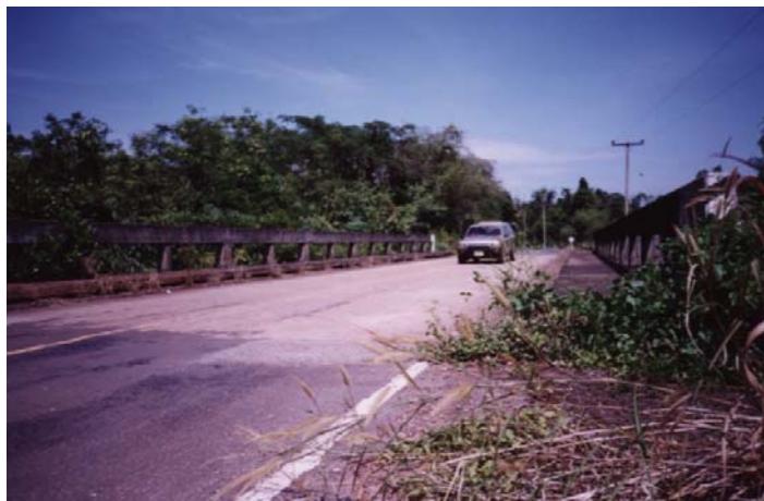
ภาพประกอบที่ จ.5 ทางเดินเท้าที่มีสภาพรกร้างมีวัชพืชกีดขวาง