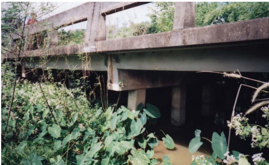
ภาพประกอบที่ จ.14 ลำน้ำที่เต็มไปด้วยวัชพืช