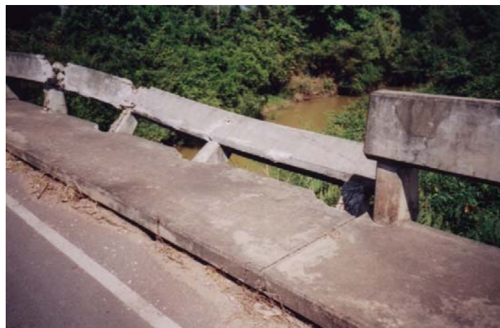
ภาพประกอบที่ จ.2 สภาพของราวสะพานที่เกิดจากอุบัติเหตุ