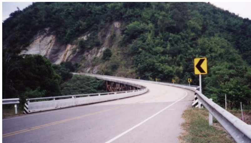
ภาพประกอบที่ จ.11 ตำแหน่งของสะพานอยู่ในโค้งราบ