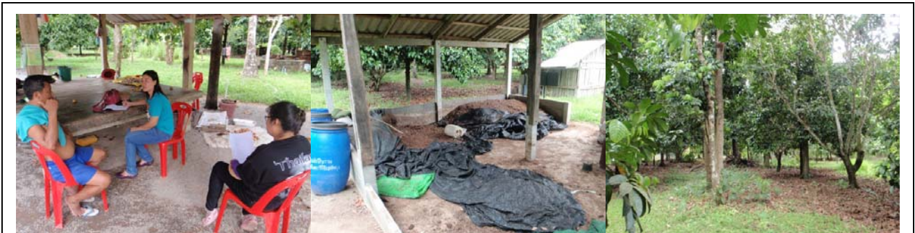
การสำรวจข้อมูล ต.อ่างทอง อ.ศรีนครินทร์ จ.พัทลุง