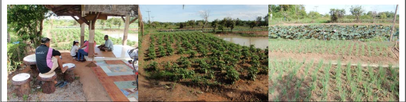
การสำรวจข้อมูล ต.พญาขัน อ.เมือง จ.พัทลุง