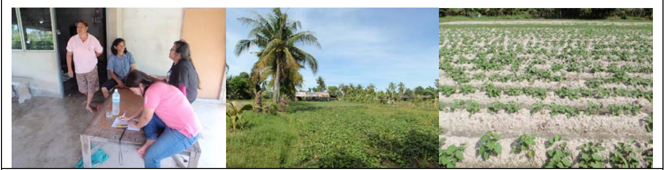
การสำรวจข้อมูล ต.ลำป่า อ.เมือง จ.พัทลุง