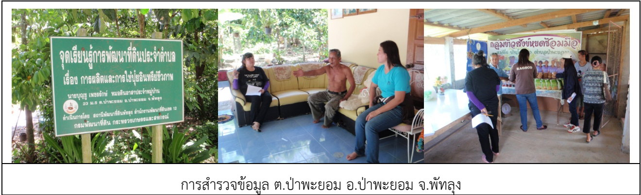
การสำรวจข้อมูล ต.ป่าพะยอม อ.ป่าพะยอม จ.พัทลุง