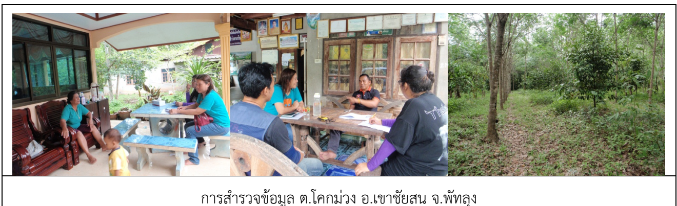
การสำรวจข้อมูล ต.โคกม่วง อ.เขาชัยสน จ.พัทลุง