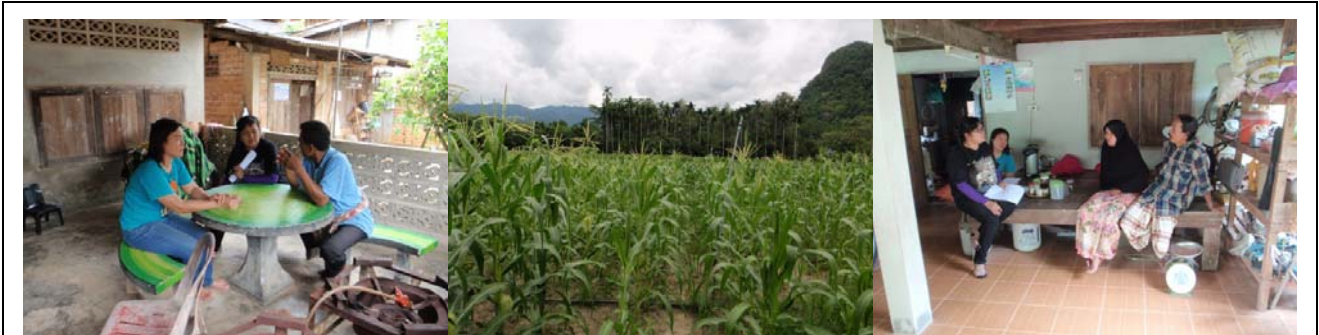
การสำรวจข้อมูล ต.คลองทรายขาว อ.กงหรา จ.พัทลุง