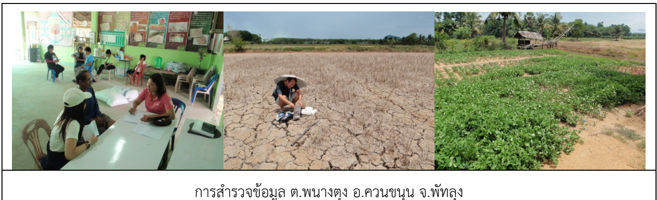
การสำรวจข้อมูล ต.พนางตุง อ.ควนขนุน จ.พัทลุง