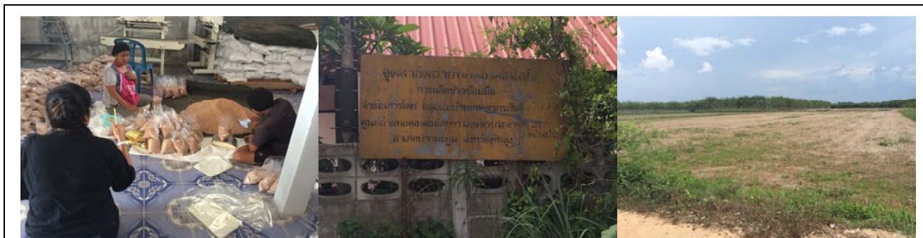
การสำรวจข้อมูล ต.ดอนประดู่ อ.ปากพะยูน จ.พัทลุง