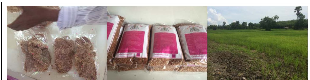
การสำรวจข้อมูล ต.ท่ามะเตี้อ อ.บางแก้ว จ.พัทลุง