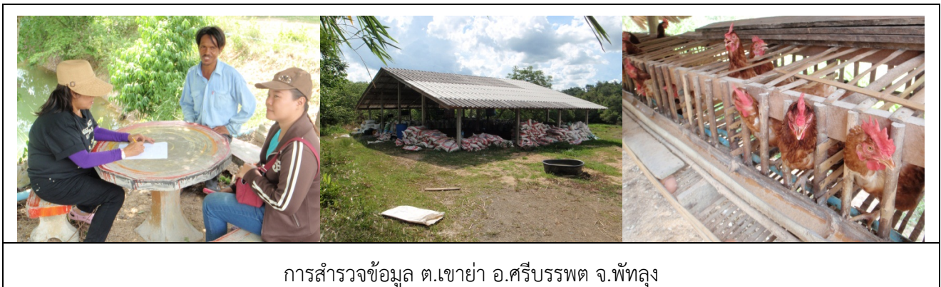
การสำรวจข้อมูล ต.เขาเย่า อ.ศรีบรรพต จ.พัทลุง