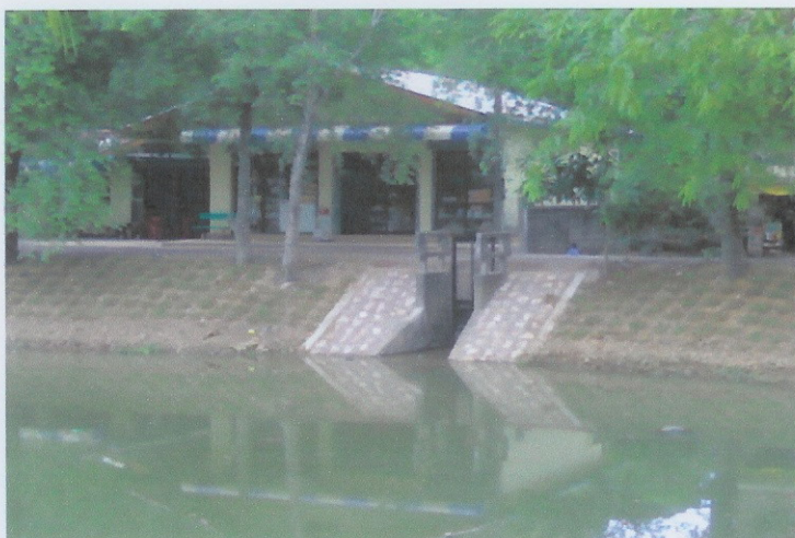
ก่อสร้างแล้วเสร็จ