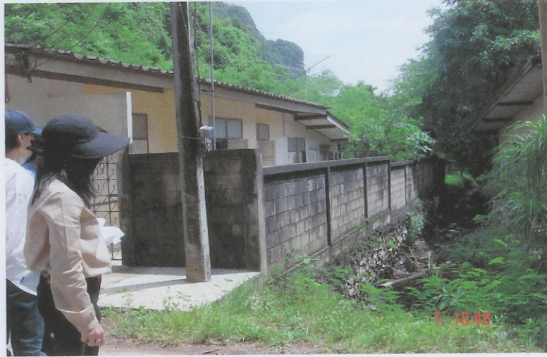
ก่อนดำเนินการ