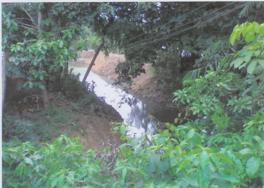
ก่อสร้างแล้วเสร็จ