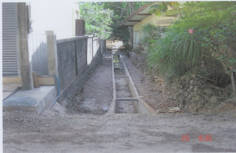
ระหว่างดำเนินการ