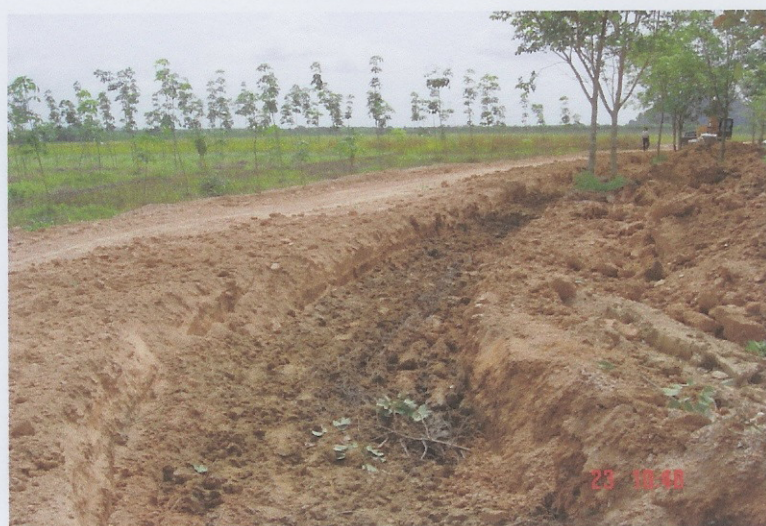
ระหว่างดำเนินการ