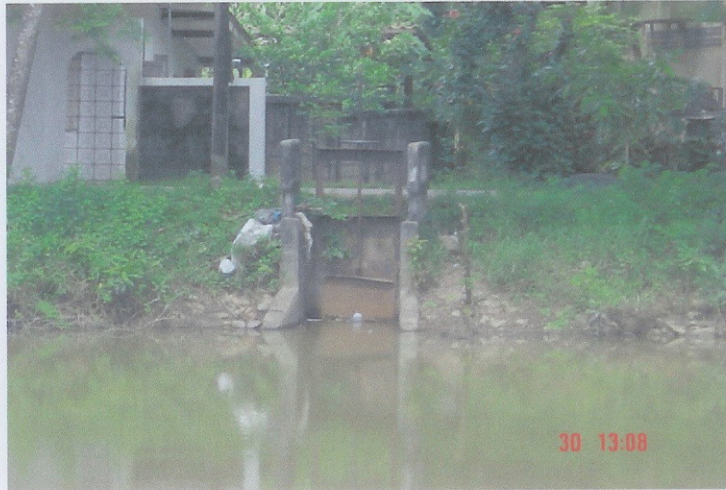
ก่อนดำเนินการ