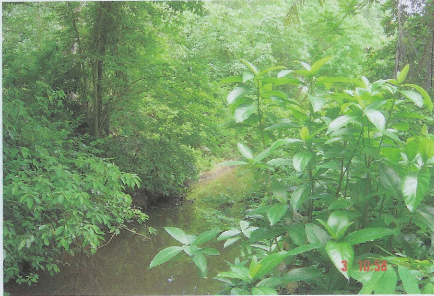
ก่อนดำเนินการ