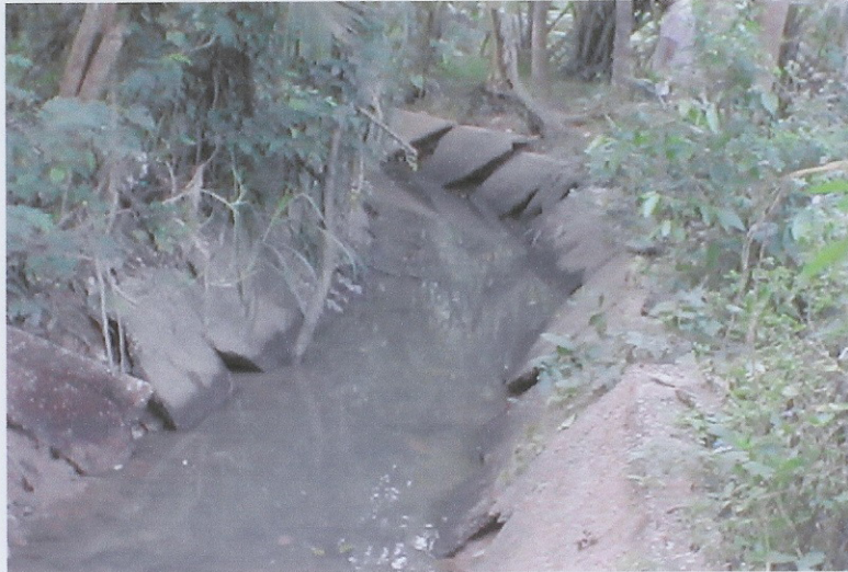
ก่อนดำเนินการ