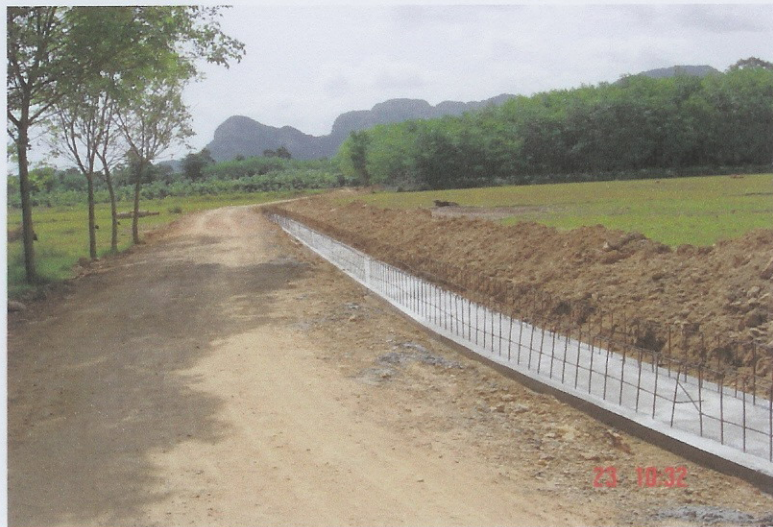
ระหว่างดำเนินการ