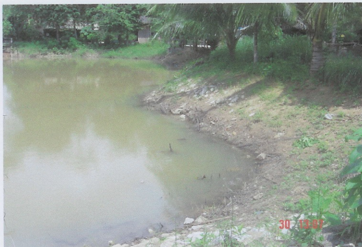
ก่อนดำเนินการ