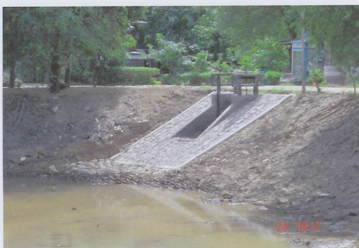
ระหว่างดำเนินการ