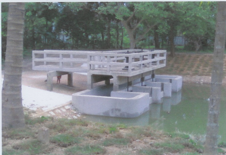
ก่อสร้างแล้วเสร็จ