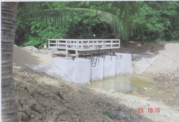
ระหว่างดำเนินการ