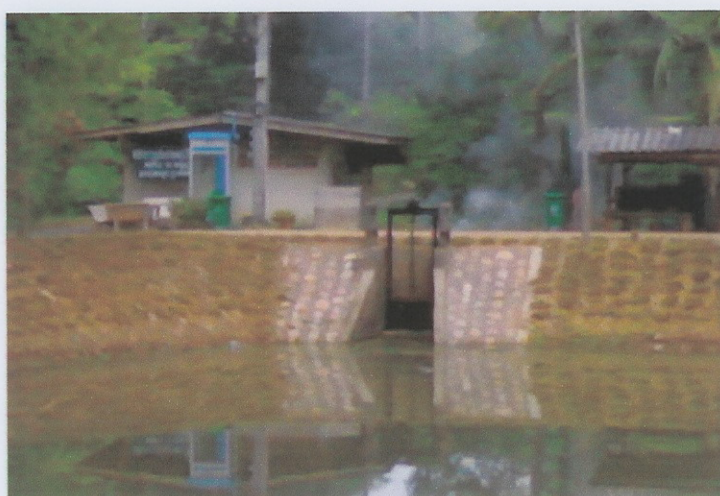
ก่อสร้างแล้วเสร็จ