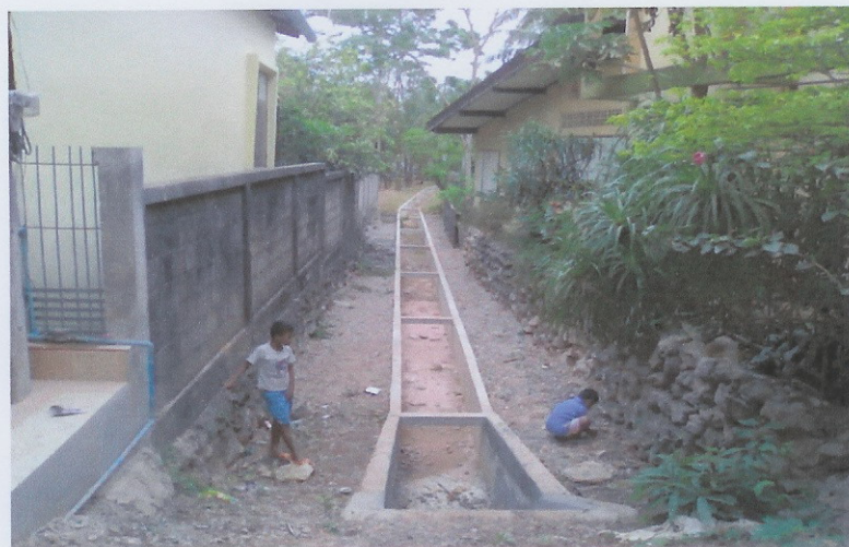
ก่อสร้างแล้วเสร็จ