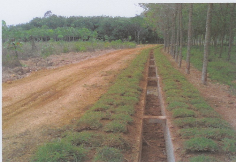
ก่อสร้างแล้วเสร็จ