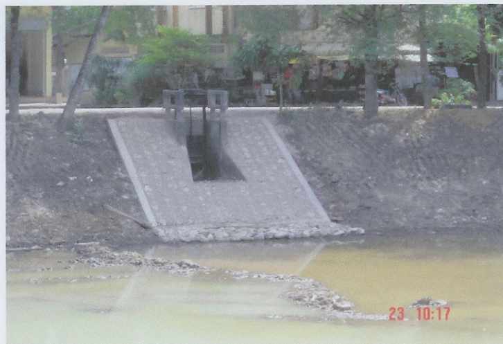
ระหว่างดำเนินการ