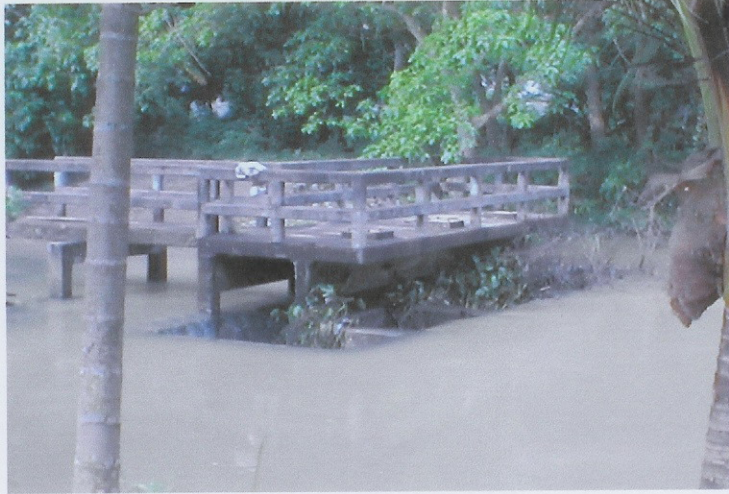
ก่อนดำเนินการ