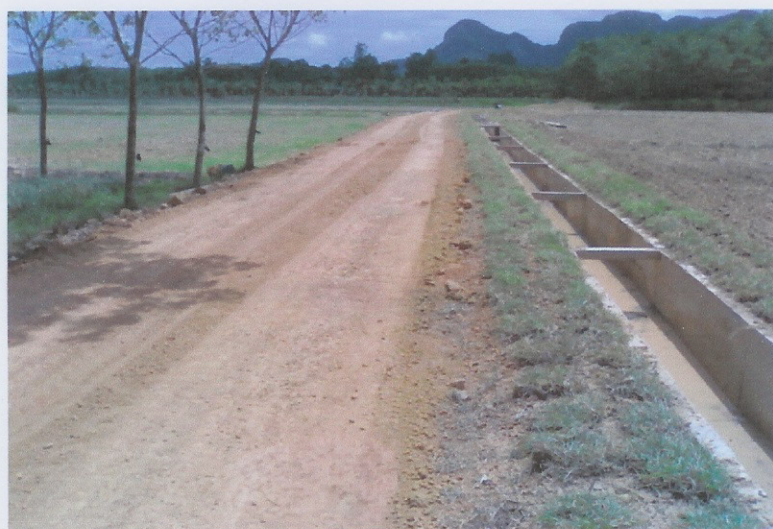
ก่อสร้างแล้วเสร็จ