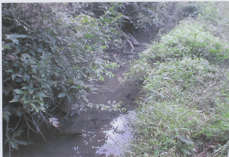
ก่อนดำเนินการ