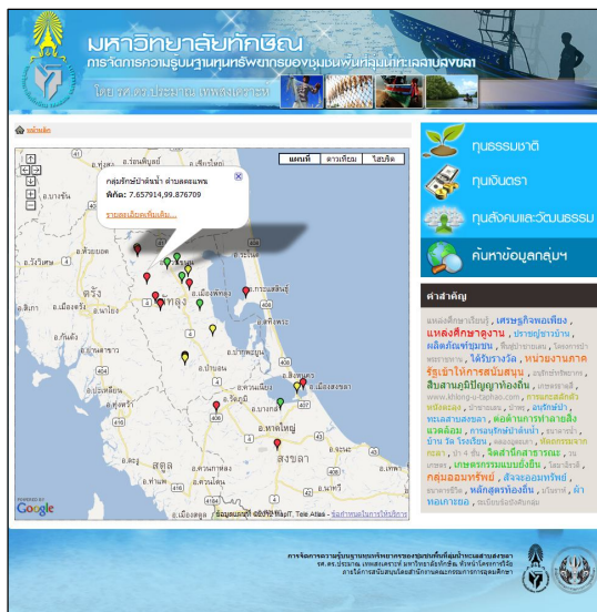
Figure 5 Location map of the database of 23 communities website call