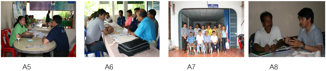
Figure 3 Monetary capital areas: (A5) Ban Khlong Muay saving group, (A6) loan for welfare saving group, (A7) Baan Ton Don saving group, (A8) Baan Khuan Din Daeng saving group