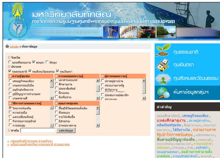
Figure 6 Website access to the decision making support system for selecting communities