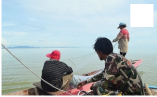
คลิกภาพเพื่อขยาย