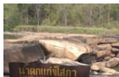
น้ำตกแก่งสี่ภาค คลิปพาดูภัยแล้งคุกคาม พิษณุโลก เปลี่ยนน้ำตกแก่ง สี่ภาคกลายเป็นทุ่งโหดหิน