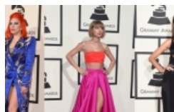
ศึกประชัน แฟชั่น "Grammy awards 2016" ใครเร็ด ปัง พลาด! มาดูกัน