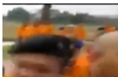
ขลุมนหนัก! พระสงฆ์ปะทะ ทหาร รุมโยกรถ-ล็อกคอ