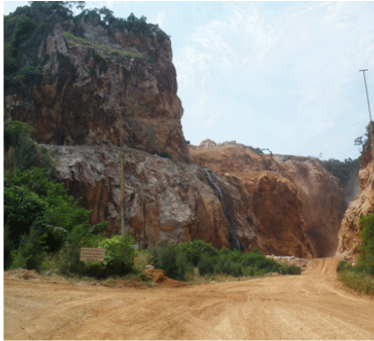
เหมืองหิน – สภาพภายในเหมืองหินเขาคูหา