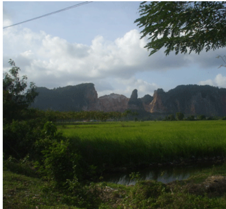
เขาคูหา - เขาคูหา ตำบลคูหาใต้ อำเภอรัตภูมิ จังหวัดสงขลา เป็นแหล่งหินของบริษัทพีรพลมายนิ่งจำกัด และบริษัท แคลเซียมไทยอินเตอร์ จำกัดตรงกลางเขา คือ พื้นที่ที่มีการระเบิดหินไปแล้ว