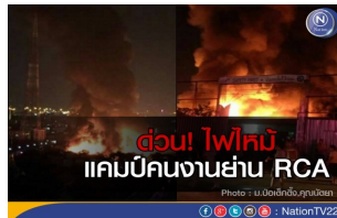
ด่วน! ไฟไหม้แคมป์คนงานย่าน RCA ยังไม่มีรายงานผู้บาดเจ็บและเสียชีวิต