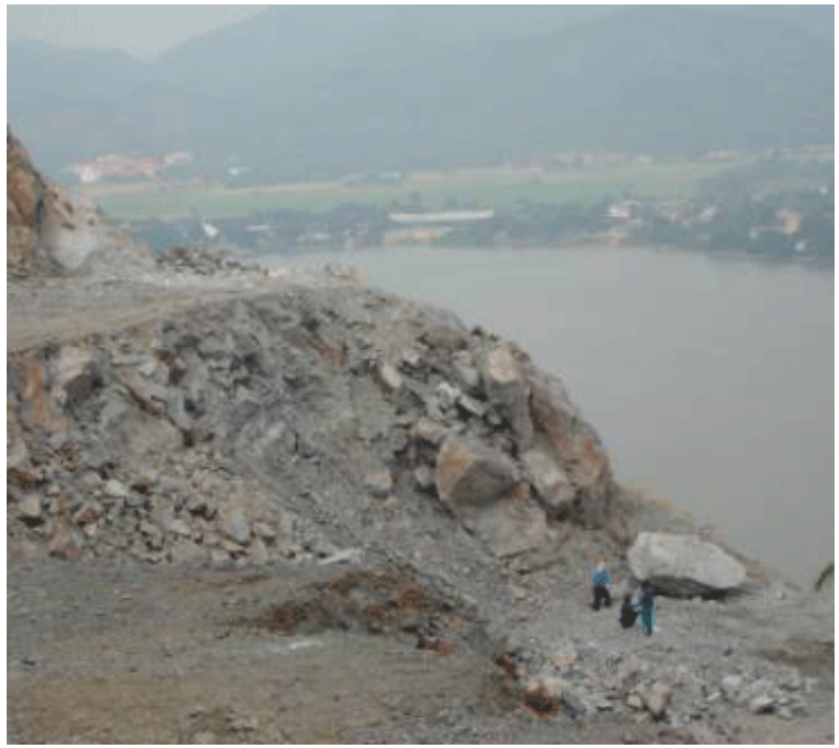
ภาพการระเบิดภูเขาจนมีฝุ่นในบรรยากาศ

ข่าว จับตาแผนพัฒนาภาคใต้ ขบวนการยอดมนุษย์(ตัวเล็ก) เล็กพริกขี้หนู ชื่อบ้าน นามเมือง เพลงในความทรงจำ ของคน วัยต้นสามสิบ ศิลปะท้องถิ่น ศิลปินพื้นบ้าน สำนวนเพลง ได้แรงอก องค์กรชุมชน คนปากใต้ แวดวงชุมชน ผลิตภัณฑ์ชุมชน ห่วงกฎหมาย กลอนลาน ห่วงภาพเล่าเรื่อง Pleung Magazine เธอคือเยาวมิตร คือกวีนิพนธ์คนปากใต้