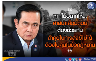
นายกฯเปิดเวทีพระติเบต แก่ชัด แยังตั้งสังฆราช