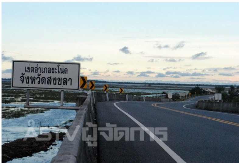
เพิ่มภาพ

3 พฤศจิกายน 2558 17:39 น. (แก้ไขล่าสุด 4 พฤศจิกายน 2558 07:59 น.)