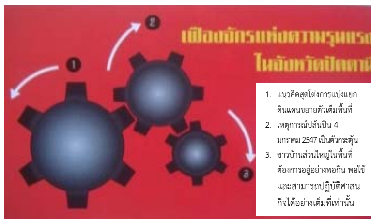
ภาพ 1 เฟืองจักรแห่งความรุนแรงในจังหวัดปัตตานี (กฤษกร วงศ์กรวุฒิ, 2550)

นั้นมีทางออก และทางออกที่ยั่งยืนที่สุด ก็คือ การกลับไปดูแลเรื่องปากท้องของชาวบ้านและชุมชนให้อยู่ดีกินดี และอยู่ในขอบเขตของการปฏิบัติศาสนกิจได้ (กฤษกร วงศ์กรวุฒิ, 2550: 67)