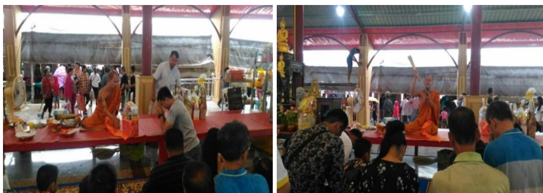
ภาพที่ 10 การสะเดาะเคราะห์และการถวายสังฆทาน ที่มา : ถ่ายโดยผู้ช่วยวิจัยเมื่อวันที่ 15 เมษายน 2561

“...ผมรู้สึกในช่วงนี้ดวงไม่ค่อยดี ได้รับอุบัติเหตุอยู่บ่อยครั้ง เลยมาทำบุญถวายสังฆทาน และบ่นบานกับไถ่ไข่มกัฏฐ์ขอให้ดวงดีขึ้น เพราะเชื่อว่าการทำบุญถวายสังฆทานจะเป็นการเสริมดวง เสริมโชคชะตา โดยเฉพาะการเข้ามาทำบุญในวัดเจดีย์ไถ่ไข่มกัฏฐ์ หลังจากทำบุญจะได้ขอพรให้ไถ่ไข่มกัฏฐ์ช่วยเหลือด้วย จากการที่ได้ฟังจากแม่เล่าให้ฟังว่าไถ่ไข่มกัฏฐ์ชอบช่วยเหลือผู้คน ใครเดือดร้อนอะไร มาขอมาบ่นบาน ไถ่ไข่มกัฏฐ์ก็จะช่วยและผมก็มีความเชื่อเช่นเพราะเคยมีประสบการณ์การบ่นบานให้ถูกหวยมาแล้ว...” (พี่ยอด, สัมภาษณ์วันที่ 8 กุมภาพันธ์ 2561)