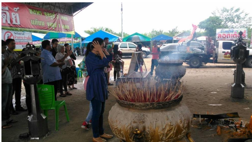
ภาพที่ 13 บรรยากาศการบนบานศาลกล่าวต่อไอ้ไข่

“...ลูกชายป่าจะไปสอบนักเรียนเตรียมทหารที่กรุงเทพฯ ป้าก็ขอไอ้ไข่ให้ลูกชายป่าสอบติดและให้ได้เรียนตามที่เขาตั้งใจไว้...” (ป้าอ้อย, สัมภาษณ์วันที่ 6 กุมภาพันธ์ 2561)