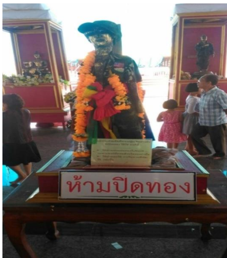
ภาพที่ 7 รูปไอ้ไข่เด็กวัดเจดีย์รูปแรกแกะสลักด้วยไม้ (แกะโดย ผู้ใหญ่เที่ยง เมืองอินทร์) เมื่อวันที่ 23 มกราคม 2561

“...พี่เกิดไม่ทันหรือตอนที่ ไอ้ไข่ ยังมีชีวิต แต่พ่อเล่าให้ฟังว่าตั้งแต่อดีตจนถึงทุกวันนี้ ไอ้ไข่ ก็ยังคงช่วยเหลือชาวบ้านที่มีความทุกข์ และความเชื่อเหล่านั้นก็เป็นจริงดังที่เห็น...” (พี่สาย, สัมภาษณ์วันที่ 18 กุมภาพันธ์ 2561)