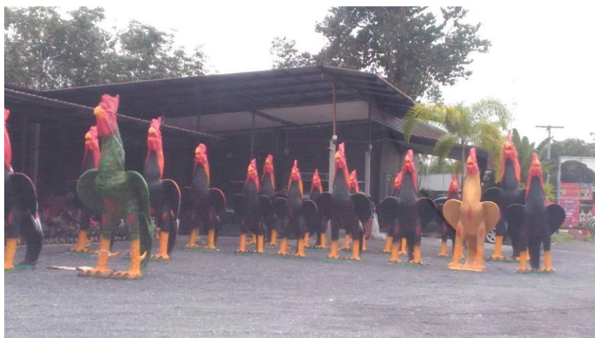
ภาพที่ 19 ร้านขายของเซ่นไหว้ไอ้ไข่ที่อยู่บริเวณหน้าวัด

“...คนมาแกำบนกันส่วนใหญ่บนปะทัด บ้านพี่ชายปะทัด ร้านขายปะทัด เยอะแยะ ก็คนเขามาแกำบน เราเลยขายปะทัด เพราะบางคนไม่ได้เตรียมมามาหาซื้อที่นี้เอา รูปปั้นไก่ ร้านพี่ก็ขาย จะเอาตัวขนาดไหน สั่งได้...” (ชาติ, สัมภาษณ์วันที่ 6 กุมภาพันธ์ 2561)