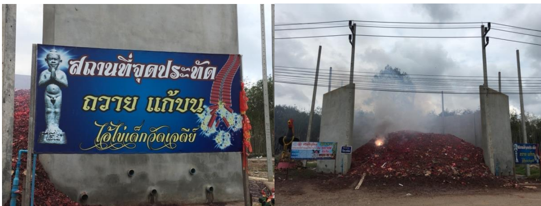
ภาพที่ 11 การจุดประทัดแก้วบว

“...มีปัญหาเรื่องนี้สินเยอะ ที่เกิดจากภาระทางครอบครัวหมุนเงินไม่ค่อยทันกับการใช้จ่ายในครัวเรือน ไม่รู้จะไปพึ่งใคร เคยได้ยินจากคำร่ำลือว่าไอ้ไข่ขออะไรก็ได้ตามหวัง เลยมาขอให้ถูกหวยให้หลุดหนี้หลุดสิน ปรากฏว่าถูกหวยจริง ๆ ถึงแม้จะไม่หมดหนี้สินแต่ก็ช่วยเบาบางไปได้มาก วันนี้เลยเอา ประทัด 10,000 นัด ชุดทหาร ไข่ต้ม และรูปปั้นไก่ชนมาถวายไอ้ไข่...” (ลุงอ๊อด, สัมภาษณ์วันที่ 6 กุมภาพันธ์ 2561)