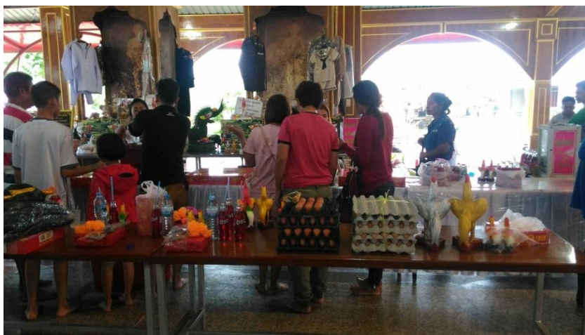
ภาพที่ 12 การนำสิ่งของมาแก้วบว

“...มีปัญหาเรื่องนี้สินเยอะ ที่เกิดจากภาระทางครอบครัวหมุนเงินไม่ค่อยทันกับการใช้จ่ายในครัวเรือน ไม่รู้จะไปพึ่งใคร เคยได้ยินจากคำร่ำลือว่าไอ้ไข่ขออะไรก็ได้ตามหวัง เลยมาขอให้ถูกหวยให้หลุดหนี้หลุดสิน ปรากฏว่าถูกหวยจริง ๆ ถึงแม้จะไม่หมดหนี้สินแต่ก็ช่วยเบาบางไปได้มาก วันนี้เลยเอา ประทัด 10,000 นัด ชุดทหาร ไข่ต้ม และรูปปั้นไก่ชนมาถวายไอ้ไข่...” (ลุงอ๊อด, สัมภาษณ์วันที่ 6 กุมภาพันธ์ 2561)