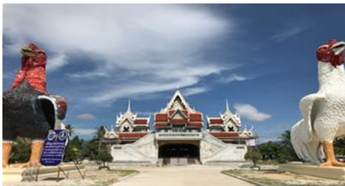
ภาพที่ 1 พื้นที่บริเวณด้านหน้าวัดเจดีย์ไฉ่

วัดเจดีย์ ไฉ่ไชย เขียนโดย สำนักงานการท่องเที่ยวแห่งประเทศไทย จังหวัด นครศรีธรรมราช กล่าวถึงประวัติและตำนานของไฉ่ไฉ่ว่า วัดเจดีย์หรือวัดไฉ่ไฉ่ ตั้งอยู่ที่ หมู่ที่ 7 ตำบล ฉลอง อำเภอสิชล จังหวัดนครศรีธรรมราช ว่าในอดีตเป็นวัดร้างที่มีอายุยาวนานถึง 1,000 ปี ภายในวัดมีเจดีย์เก่าประดิษฐานอยู่ซึ่งพื้นที่บริเวณนี้เป็นที่สร้างอุโบสถหลังใหม่ในปัจจุบัน ปี พ.ศ.2500 ได้มีการบูรณะปรับปรุงวัดขึ้น เมื่อมีพระสงฆ์เข้ามาประจำอยู่ภายในวัดเป็นที่ปฏิบัติศาสนกิจของพระสงฆ์ และมีชาวบ้านเข้าวัดทำบุญเหมือนวัดทั่ว ๆ ไป ภายในวัดได้ประดิษฐานพระพุทธรูปเก่าแก่ที่มีอายุยาวนานพอ ๆ กันกับวัด เรียกว่า “พ่อท่าน” ซึ่งในปัจจุบันนั้นภายในวัดได้มีรูปของไฉ่ไฉ่มีลักษณะเป็นรูปไม้แกะสลักเป็นรูปร่างของเด็กผู้ชายในสมัยก่อน มีผมจุก อายุราว 9-10 ขวบ ตั้งอยู่ภายในวัดด้วย ชาวบ้านและบุคคลทั่วไปมีความเชื่อและความศรัทธาต่อเด็กวัดตัวเล็ก ๆ ที่รู้จักกันในนามว่า “ไฉ่ไฉ่” โดยมีความเชื่อว่าไฉ่ไฉ่เป็นวิญญาณเด็กที่มีความศักดิ์สิทธิ์สถิตอยู่ในเจดีย์มานานแล้ว ทำหน้าที่ปกป้องรักษาวัดให้พ้นจากสิ่งเลวร้ายทั้งปวง ไฉ่ไฉ่จึงเป็นที่เคารพของชาวบ้านและผู้คนทั่วไปที่มีแรงศรัทธาต่อไฉ่ไฉ่ แต่จะว่าไปแล้วนั้นเป็นเพราะเหตุผลที่ผู้คนเหล่านั้นบนบานศาลกล่าวแล้วได้ตั้งใจหวัง หรือเชื่อกันว่า ขอได้ไหว้รับ โดยเฉพาะในเรื่องของโชคลาภการทำมาค้าขายเท่านั้น ยังรวมถึงการบนบานเรื่องของการหายแล้วได้คืนก็ได้สนใจปรารถนา บางครั้งยังมีการแสดงอภินิหารแสดงตัวตนให้ชาวบ้านในละแวกนั้นเห็นในกริยาอาการวิ่งเล่นตามประสาเด็กที่อยู่ในบริเวณวัด (คำรพ เกิดมีทรัพย์, 2556)