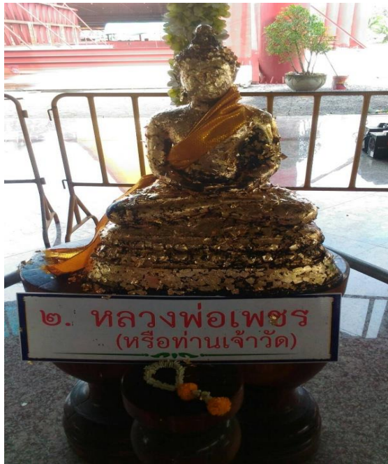
ภาพที่ 30 หลวงพ่อเพชร (ท่านเจ้าวัด)