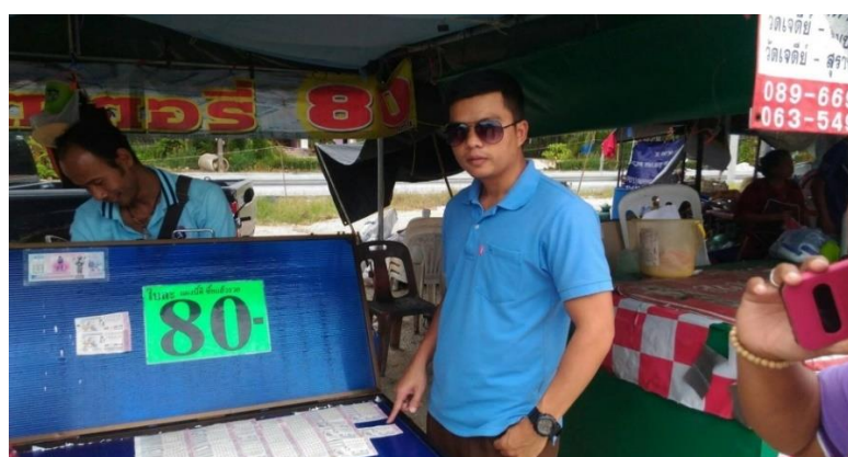
ภาพที่ 37 แผงขายล็อตเตอรี่ ที่ผู้คนเข้ามาภายในวัดนิยมซื้อ

นอกจากนี้บริเวณโดยรอบวัด ยังก่อให้เกิดร้านค้าที่จำหน่ายของสำหรับการเช่นไหว้ แก่นับจำนวนหลายร้านมากมาย เพื่อรองรับผู้ที่มีความศรัทธาต่อไอโซในการมาแก่นับจากการขอพร ได้สำเร็จและมีร้านค้าขายสินค้าทางการเกษตรของพื้นที่ที่มีชื่อเสียงและรสชาติดี เช่น ทูเรียน สละ และอาหารเครื่องดื่มของท้องถิ่นไว้ให้บริการสำหรับนักท่องเที่ยวที่เข้ามาเที่ยวชมและบนบานศาล กล่าวภายในวัดแห่งนี้ แผงขายล็อตเตอรี่ สำหรับนักเสี่ยงโชค โดยถือได้ว่าเข้ามาเที่ยวที่วัดเจดีย์ไอโซ ได้รับทั้งความสบายใจที่ได้มากราบไว้สิ่งศักดิ์สิทธิ์ประจำวัด และความสุขใจที่ได้ของฝากติดไม้ติดมือ กลับไปพร้อมความประทับใจในการบริการและความเป็นกันเองของคนท้องถิ่น ดังเสียงสะท้อนส่วน หนึ่งของผู้คนในหมู่บ้านและผู้ทีแวะเวียนเข้ามาเที่ยวชมบนบานศาลกล่าว