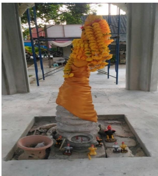
ภาพที่ 6 ยอดเจดีย์เก่าโบราณที่มีมาตั้งแต่สมัยกรุงศรีอยุธยา

เป็นการให้ความหมายของผู้คนในพื้นที่ที่มีความผูกพันและการดำรงชีวิตที่มีความเกี่ยวข้องกับวัดเจดีย์ไฉ่ไช่ ไม่ว่าจะเป็นสถานที่ที่ใช้ในการปฏิบัติธรรม การประกอบพิธีกรรมทางศาสนา การทำบุญให้ทาน และขอพรบนบานศาลกล่าวของหายอยากได้คืน ดังคำสัมภาษณ์ต่อไปนี้