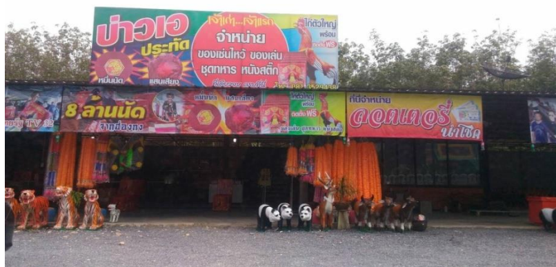
ภาพที่ 38 ร้านบ่าวเอ ขายของสำหรับแก่นบและเซ่นไหว้ไอ้ไข่

“...มาเช่ารูปไอ้ไข่ไว้บูชาคะ ที่บ้านร้านเป็นขายของ เพื่อเรียกลูกค้าเข้าร้านคะ เป็นสิริมงคลด้วย...” (ปลา, สัมภาษณ์วันที่ 18 กุมภาพันธ์ 2561)