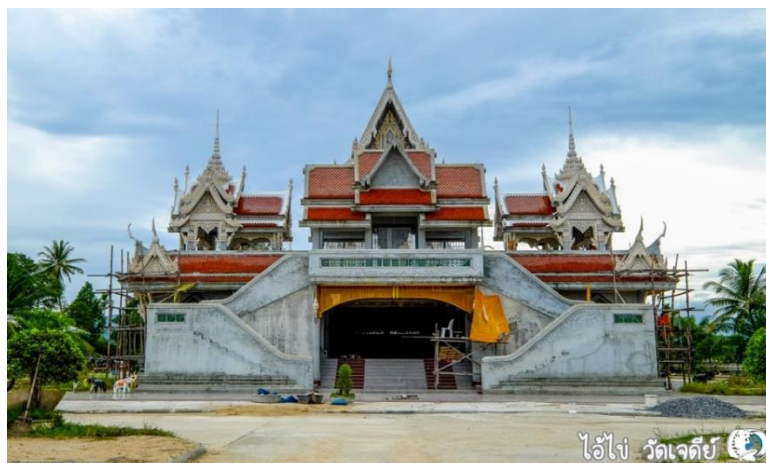
ภาพที่ 36 อุโบสถหลังใหม่ที่ก่อสร้างบนพื้นที่เจดีย์เก่า

นอกจากนี้บริเวณโดยรอบวัด ยังก่อให้เกิดร้านค้าที่จำหน่ายของสำหรับการเช่นไหว้ แก่นับจำนวนหลายร้านมากมาย เพื่อรองรับผู้ที่มีความศรัทธาต่อไอโซในการมาแก่นับจากการขอพร ได้สำเร็จและมีร้านค้าขายสินค้าทางการเกษตรของพื้นที่ที่มีชื่อเสียงและรสชาติดี เช่น ทูเรียน สละ และอาหารเครื่องดื่มของท้องถิ่นไว้ให้บริการสำหรับนักท่องเที่ยวที่เข้ามาเที่ยวชมและบนบานศาล กล่าวภายในวัดแห่งนี้ แผงขายล็อตเตอรี่ สำหรับนักเสี่ยงโชค โดยถือได้ว่าเข้ามาเที่ยวที่วัดเจดีย์ไอโซ ได้รับทั้งความสบายใจที่ได้มากราบไว้สิ่งศักดิ์สิทธิ์ประจำวัด และความสุขใจที่ได้ของฝากติดไม้ติดมือ กลับไปพร้อมความประทับใจในการบริการและความเป็นกันเองของคนท้องถิ่น ดังเสียงสะท้อนส่วน หนึ่งของผู้คนในหมู่บ้านและผู้ทีแวะเวียนเข้ามาเที่ยวชมบนบานศาลกล่าว