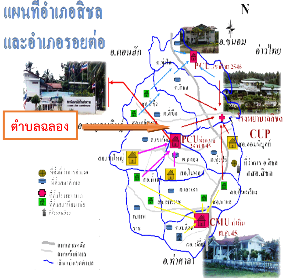
ภาพที่ 4 แผนที่อำเภอสิชล จังหวัดนครศรีธรรมราช