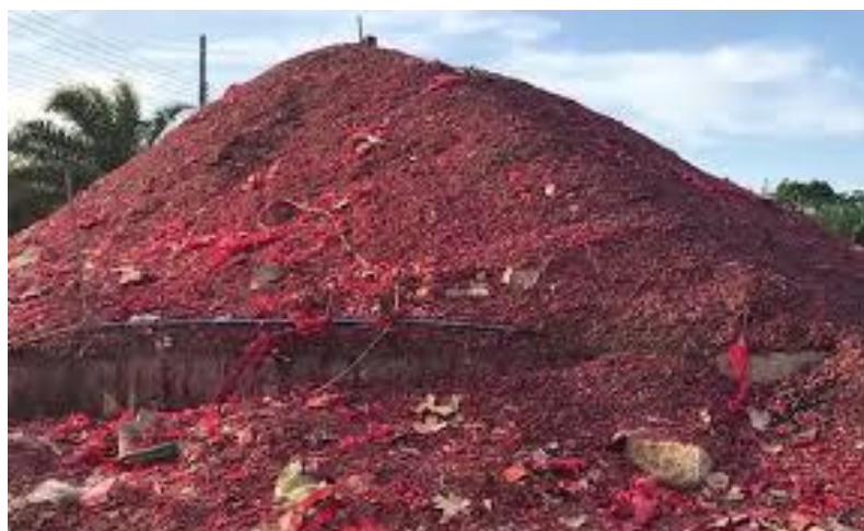
ภาพที่ 14 กองประทัดสูงท่วมหัวเท่าภูเขา

“...ที่นี่มีอะไรน่าสนใจ เคยสงสัยตอนยังไม่ได้มา วันนี้ได้มาเห็นที่จริง ๆ เห็นกองประทัดใหญ่โตมาก ๆ คงมีคนสมหวังเยอะ เลยถ่ายรูปเก็บไว้ให้เพื่อนๆ เรามาถึงที่นี่แล้ววัดไอ้ไข่...” (ตุ้, สัมภาษณ์วันที่ 8 กุมภาพันธ์ 2561)