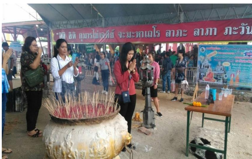
ภาพที่ 27 การแก้บนต่อไอ้ไข่

เมื่อได้รับความสมหวังจากสิ่งที่บนบานศาลกล่าวไว้แล้ว ผู้ที่แก้บนจะมาแก้บนภายในวัดเจดีย์ไอ้ไข่และนำสิ่งของที่ได้อะไรมาแก้บน ไม่ว่าจะเป็นปะทัด ชุดเครื่องแบบทหาร รูปปั้นไก่ชน ของเล่นเด็ก ขนมเปียะ น้ำแดง หนังสือเด็ก การแก้บนด้วยหนังสือ มโนราห์ หรือกลองยาว ฯลฯ ในขั้นตอนการแก้บน ผู้ที่มาแก้บนจะต้องนำสิ่งของไปวางต่อหน้ารูปเคารพไอ้ไข่ บนโต๊ะที่ทางวัดได้เตรียมไว้ (ยกเว้น) จากนั้น จตุรปู 1 ดอก นมัสการพระคุณเจ้าโดยการตั้งนะโม 3 จบ แล้วเรียกชื่อไอ้ไข่ เด็กวัดเจดีย์ และว่าคาถา อิติ อิติ กุมารไชเจดีย์ จมะมหาเถโร ลากะ ลากา ภาวันตุเม เตชะพระพุทธานเจ้าวัดและไอ้ไข่เด็กวัดเจดีย์ จงมารับเครื่องแก้บนที่ข้าพเจ้าชื่อ.....นามสกุล.....ที่อยู่.....ได้บนบานศาลกล่าวเรื่อง..... บัดนี้สำเร็จเรียบร้อยตามที่ได้บนบานไว้แล้วนั้น ขอให้ขาดเหลยบน ตั้งแต่บัดนี้เป็นต้นไป จากนั้นหากนำรูปปั้นไก่มาก็ให้เอาไปปล่อยในฝูงไก่ในบริเวณวัด หรือเอาปะทัดไปจุด ณ สถานที่จุดปะทัด หรือแก้บนด้วยการแสดงหนังสือ มโนราห์ หรือรำกลองยาว เสร็จแล้วก็กลับมาสักการะแล้วขอพรอีกครั้ง และมีคำแนะนำว่าไม่ควรแก้บนในวันพระ