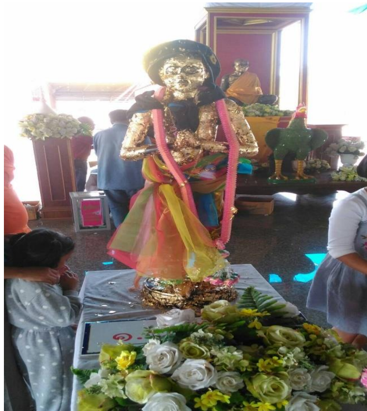
ภาพที่ 29 รูปปั้นไอ้ไข่ ที่มา : ถ่ายโดยผู้วิจัยเมื่อวันที่ 13 เมษายน 2561

โลหะ แหวนไอ้ไข่ ร้อยคเก็ด ผ้ายันต์ ฯลฯ ที่มีการจัดสร้างโดยวัดเจตีย์ไอ้ไข่เพื่อให้ผู้คนได้เช่าบูชาเป็นสิริมงคลแก่ตนเองและครอบครัว นับเป็นการผลิตซ้ำความเชื่อเรื่องรูปเคารพบูชาที่มีจำนวนมากขึ้นหลากหลายชิ้นจนทำให้ไอ้ไข่เป็นที่รู้จักของผู้คนทั่วไปที่มีความเชื่อความศรัทธา ดังนี้