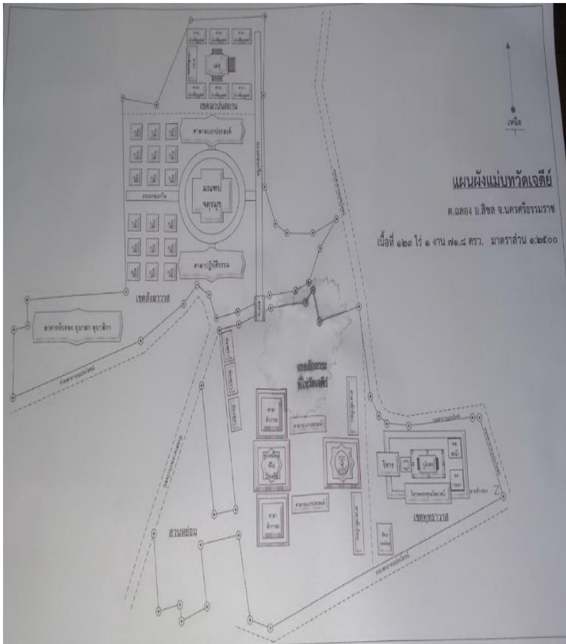
ภาพที่ 5 แผนที่เดินดินวัดเจดีย์ไฉ่ ต.ฉลอง อ.สิชล จ.นครศรีธรรมราช ที่มา : พระอธิการอภิชาติ พุทธสโร (พระอาจารย์แวน) เมื่อวันที่ 8 กรกฎาคม 2561