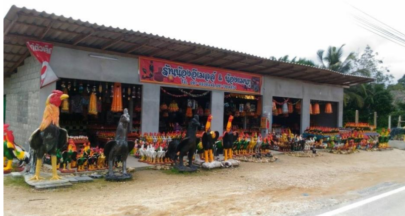
ภาพที่ 17 ร้านขายของเซ่นไหว้ไอ้ไข่ที่อยู่บริเวณทางเข้าวัดเจดีย์ไอ้ไข่

“...ที่เองบ้านอยู่แถวนี้แหละน้อง เดียวนี้ขายของได้เยอะ เช้า ๆ สาย ๆ พี่ก็มาเปิดร้านแล้ว เพราะคนเยอะทุกวัน ของขายดีขายหมดเกือบทุกวัน นับเป็นอภินิหารที่ไอ้ไข่สร้างอาชีพให้กับคนในชุมชนได้มีรายได้ กินดีอยู่ดี...” (พี่น้องคราญ, สัมภาษณ์วันที่ 6 กุมภาพันธ์ 2561)