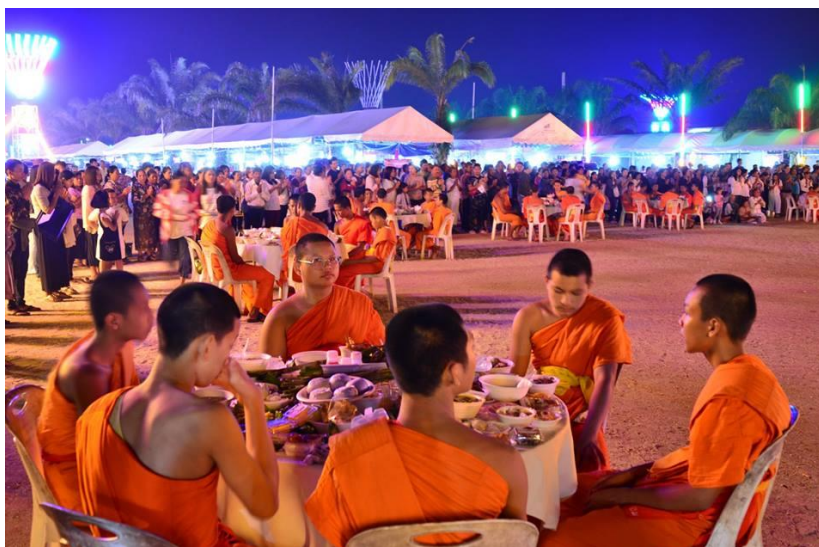
ภาพที่ 24 บรรยากาศงานประเพณีทำขนมให้ทานไฟในช่วงเช้า ณ วัดเจดีย์ไฉ่