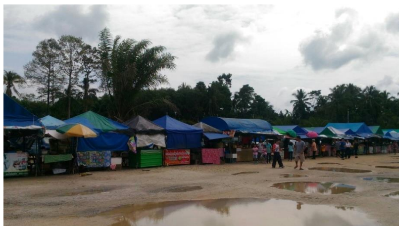
ภาพที่ 18 ร้านขายสินค้าจากท้องถิ่นภายวัดเจดีย์ไอ้ไข่

“...ที่เองบ้านอยู่แถวนี้แหละน้อง เดียวนี้ขายของได้เยอะ เช้า ๆ สาย ๆ พี่ก็มาเปิดร้านแล้ว เพราะคนเยอะทุกวัน ของขายดีขายหมดเกือบทุกวัน นับเป็นอภินิหารที่ไอ้ไข่สร้างอาชีพให้กับคนในชุมชนได้มีรายได้ กินดีอยู่ดี...” (พี่น้องคราญ, สัมภาษณ์วันที่ 6 กุมภาพันธ์ 2561)