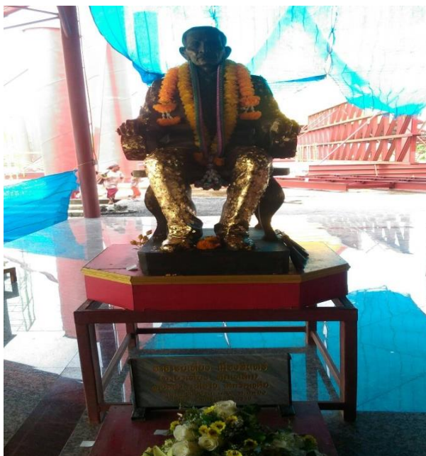
ภาพที่ 32 รูปปั้นผู้ใหญ่เที่ยง เมืองอินทร์ (ผู้ที่แกะสลักรูปไอ้ไข่)