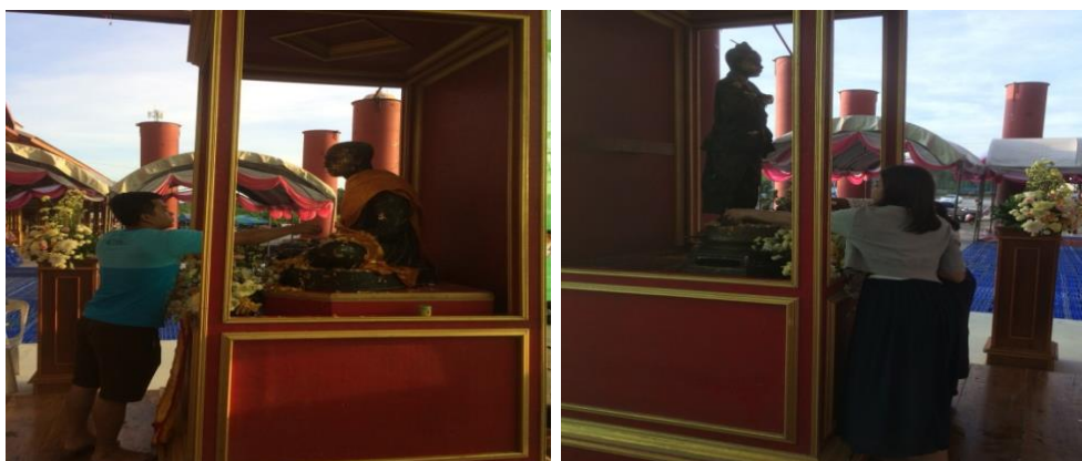
ภาพที่ 25 บรรยากาศงานประเพณีวันสงกรานต์ ณ วัดเจตีย์ไอ้ไข่