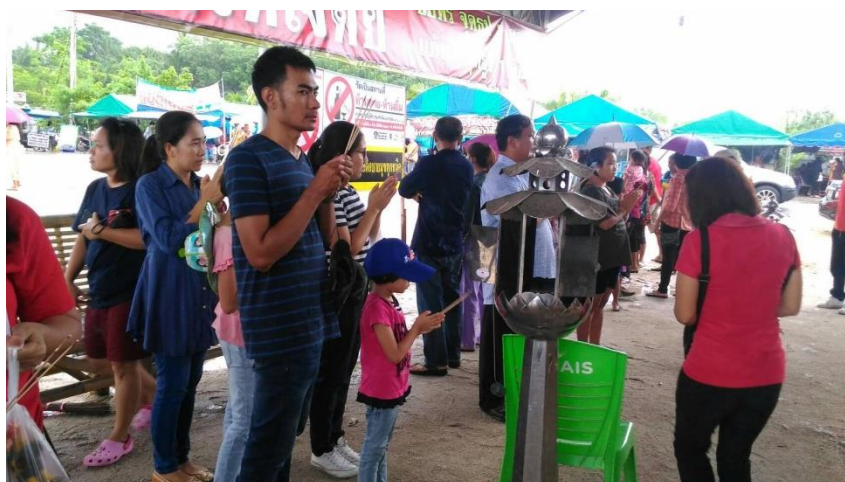
ภาพที่ 26 บรรยากาศการบนบานศาลกล่าว

ในส่วนนี้ผู้ที่มีความศรัทธาจะมีขั้นตอนในการบนบานศาลกล่าว คือ จุดธูป 3 ดอก กราบพระรัตนตรัย ต่อด้วยนมัสการพระคุณเจ้าโดยการตั้งนะโม 3 จบ แล้วอธิษฐานเรียกชื่อ ไฉ่ไห้ เต็กวัดเจดีย์ และว่าคาถา อิติ อิติ กุมารไฉ่เจดีย์ จะมะหาเถโร ลากะ ลากา ภาวันตุเม ตั้งจิตให้นิ่งแล้วอธิษฐาน ในการบนบานไม่ควรบนบานในวันพระ