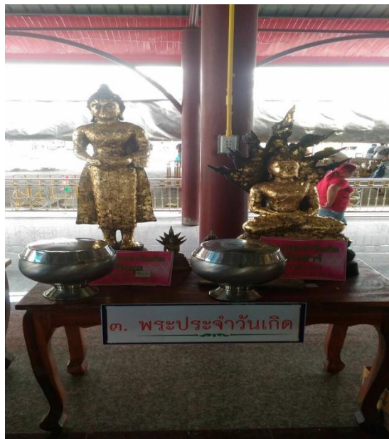
ภาพที่ 31 พระประจำวันเกิดภายในวัดเจตีย์ไฉ่