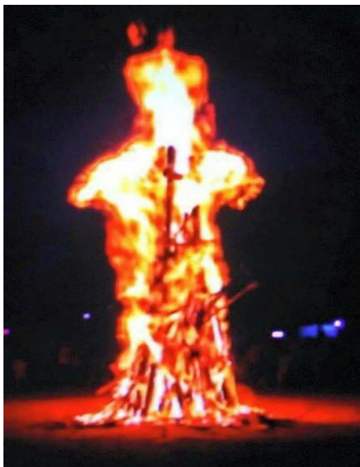
ภาพที่ 20 เปลวไฟลักษณะคล้ายรูปไอ้ไข่เด็กวัดเจดีย์ ที่มา : ไพฑูรย์ อินทศิลา ถ่ายเมื่อ 23 กุมภาพันธ์ 2558

เรื่องเล่าของอาจารย์สอนมหาวิทยาลัยแห่งหนึ่ง เล่าว่าท่านมีผ้ายันต์บูชาของไอ้ไข่สีแดง ซึ่งเก็บไว้ในกระเป๋าทลอดแต่ในขณะที่ไปสอนก็มีนักศึกษาที่มีความสนใจและอยากได้ไว้บูชาแอบขโมยไป ซึ่งจากการพูดคุยกับเพื่อนๆ ที่บูชาเขาบอกว่าเป็นของแท้หากให้ใครไม่ประสงค์ไปอยู่ด้วยสุดท้ายจะต้องกลับมาหาเจ้าของและสุดท้ายนักศึกษาก็ได้นำมาให้จริง