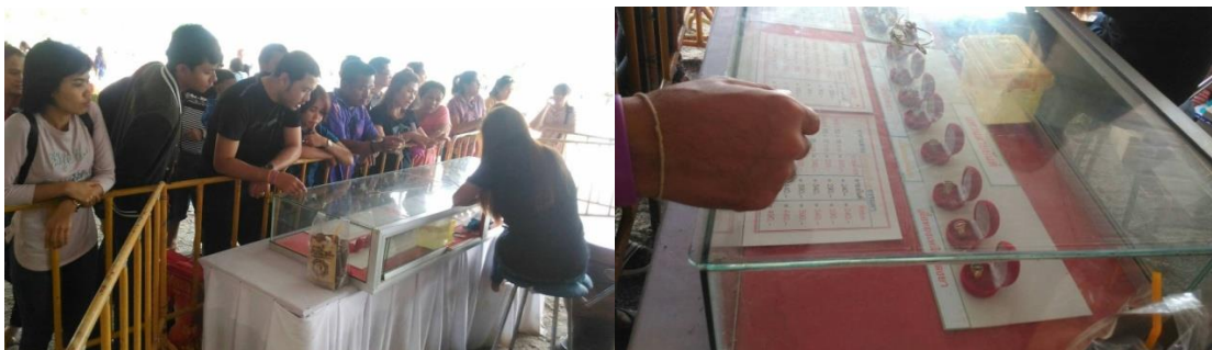
ภาพที่ 35 การจัดทำแหวนไอ้ไข่สำหรับการบูชา

7) มีการก่อสร้างอุโบสถหลังใหม่บนพื้นที่ของเจดีย์เก่าที่เคยกร้าง ศาลาปฏิบัติธรรม กุฏิสำหรับพระสงฆ์ ลานจอดรถ สิ่งอำนวยความสะดวกต่าง ๆ และรูปปั้นไก่อชนตัวใหญ่ที่วางอยู่บริเวณด้านหน้าอุโบสถวัดเจดีย์จำนวน 2 ตัว ที่มีความสูงของไก่อถึง 11 เมตร จัดสร้างโดยผู้ที่มีความเชื่อความศรัทธาและสมหวังดังปรารถนาซึ่งมีมูลค่าตัวละ 1.5 ล้านบาท รวม 2 ตัว 3 ล้านบาท และตลอดเส้นทางเข้าวัดเจดีย์ไอ้ไข่ก็จะมีรูปปั้นไก่อชนวางอยู่ตลอดสองข้างทาง ด้วยแรงศรัทธาทำให้วัดเจดีย์มีผู้คนเข้าไม่เว้นในแต่ละวัน ทำให้มีกองเศษปะทัดขนาดใหญ่สูงท่วมหัวอย่างไครหลาย ๆ คนที่มาเห็นได้แวะมาเที่ยวชมถึงกับตะลึงกับกองปะทัดขนาดใหญ่