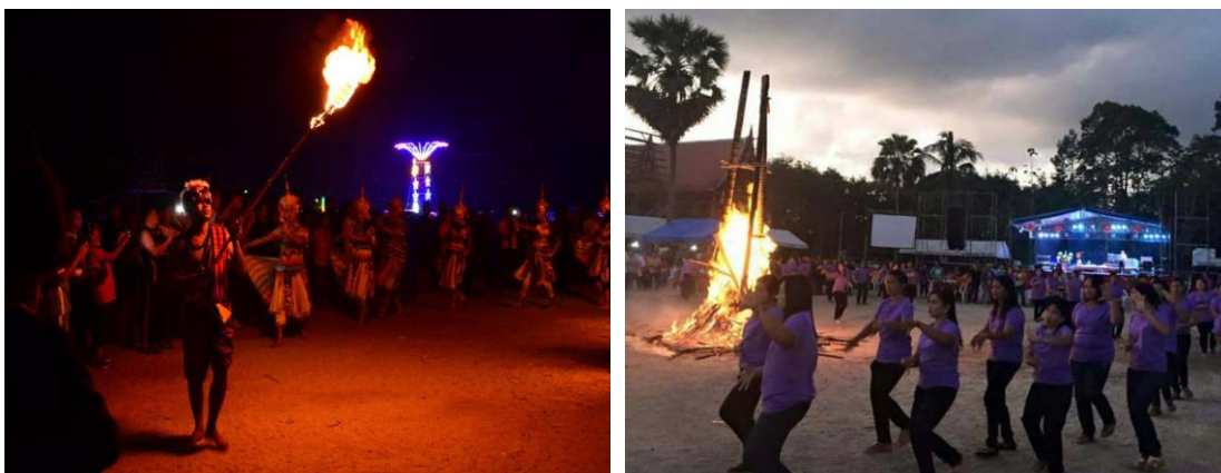
ภาพที่ 23 บรรยากาศงานประเพณีทำขนมให้ทานไฟในช่วงกลางคืน ณ วัดเจดีย์ไฉ่

กล่าวถึงเรื่อง ความตระหนี่ถี่เหนียวของโกลิยะเศรษฐี ที่อยากกินขนมเบื้อง แต่เสียดายเงินไม่ยอมซื้อและไม่อยากให้ลูกเมียได้กินด้วย ภรรยาจึงทำขนมเบื้องที่บ้านชั้นเจ็ดให้เศรษฐีรับประทานโดยไม่ให้ผู้ใดเห็น ขณะที่สองสามีภรรยา กำลังปรุงขนมเบื้อง พระพุทธเจ้าประทับอยู่ที่เขตวันมหาวิหาร ทรงทราบด้วยญาณ จึงโปรดให้พระโมคคัลลานะไปแก่นิสัยของโกลิยะเศรษฐี พระโมคคัลลานะ ตรงไปบนตึกชั้นเจ็ดของคฤหาสน์เศรษฐี เศรษฐีเข้าใจว่าจะมาขอขนม จึงแสดงอาการรังเกียจและออกวาจาขี้ไล่ แต่พระโมคคัลลานะพยายามทรมานเศรษฐีอยู่นานจนยอมละนิสัยตระหนี่ พระโมคคัลลานะได้แสดงธรรมเรื่องประโยชน์ของการให้ จนโกลิยะเศรษฐีและภรรยาเกิดความเลื่อมใส ได้นิมนต์มารับถวายอาหารที่บ้านตน พระโมคคัลลานะแจ้งให้นำไปถวายพระพุทธเจ้า และพระสาวก ๕๐๐ รูป ณ เขตวันมหาวิหาร โกลิยะเศรษฐีและภรรยาได้นำเข้าของเครื่องปรุงไปทำขนมเบื้องถวายพระพุทธเจ้าและพระสาวก แต่ปรุงเท่าไรก็แห้งที่เตรียมมาเพียงเล็กน้อยก็ไม่หมด พระพุทธเจ้าจึงโปรดเทศนาสั่งสอน ทั้งสองคนเกิดความปิติอิมเอิบในการบริจาคทาน เห็นแจ้งบรรลุธรรมชั้นโสดาบัน