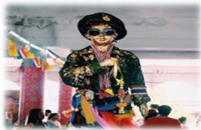
ภาพที่ 2 เทพแห่งสามัญชน ที่มา : คำรพ เกิดมีทรัพย์, 2556

ไอไข่ เด็กวัดเจดีย์: เทพแห่งสามัญชน เขียนโดย คำรพ เกิดมีทรัพย์ (2556) กล่าวถึงประวัติและตำนานของไอไข่ว่า เมื่อกาลล่วงมากกว่า 300 ปีแล้ว สถานที่แห่งนี้เป็นที่รกร้าง มีหลักฐานให้รู้ว่าเป็นวัด ซากอิฐที่ปรักหักพัง และพระพุทธรูปที่ชาวบ้านเรียกว่า “ท่านเจ้าวัด” ยังคงหลงเหลืออยู่กับความศักดิ์สิทธิ์ของเด็กวัด สิ่งดังกล่าวคงระดับความศรัทธาของชาวบ้านผู้นับถือ เพราะได้พบว่ามี การบนบานศาลกล่าวอย่างต่อเนื่องกว่าร้อยละ 99 ที่ได้ตั้งใจปรารถนา เมื่อสิ่งที่บนบานสัมฤทธิ์ผลก็มีคนเข้ามาแก้บนที่วัดร้างแห่งนี้เป็นนิจ ท่านเจ้าอาวาสกล่าวต่อไปว่า ท่านเองก็อยากทราบประวัติเหมือนที่ญาติโยมพุทธบริษัทถามนั่นแหละ ท่านถามใครก็ไม่มีใครรู้ แต่ผู้เฒ่าผู้แก่กล่าวร่องคล้อยกันว่า “รู้แต่ว่าปู่ของปู่ ๆ หรือย่าของย่า ๆ ตรงนี้เป็นที่วัดมีเด็กเป็นสิ่งศักดิ์สิทธิ์ประจำวัด” เจ้าอาวาสเลยพยายามค้นคว้าหาข้อมูลและสอบถามผู้คนที่มีความรู้เรื่อง ไอไข่ จนได้ความว่า ย้อนอดีตไปตั้งแต่สมัยวัดเจดีย์มีพระขรรค์ทองเป็นเจ้าอาวาส ซึ่งได้มีเด็กวัดคอยให้การรับใช้อยู่ 2 คน คนแรกมีชื่อว่า เหมียน แต่อีกคนไม่ทราบว่าชื่ออะไร แต่ชาวบ้านแถวนั้นต่างเรียกกันว่า “ไอไข่” เป็นเด็กที่อยู่บริเวณวัดมีความซนตามประสาเด็ก แต่ชอบช่วยเหลือผู้อื่นที่มีความเดือดร้อนเพราะมีวิชาอาคมเก่งกว่าเด็กคนอื่น ๆ โดยเล่ากันว่าหากเรื่องใดที่ชาวบ้านไม่สามารถแก้ปัญหาได้ ก็จะนึกถึงเด็กวัดคนนี้เพราะทุกครั้งที่ยกให้ช่วยก็จะสำเร็จผลทุกครั้ง เพราะเด็กวัดคนนี้ถือสัจจะ หากกล่าวแล้วก็ต้องทำให้ได้ตามที่กล่าวไว้ ตัวอย่างเช่น กรณีควายของชาวบ้านไม่ยอมให้เจ้าของจับเลยมาขอให้ไอไข่ช่วยก็สามารถจับควายตัวนั้นได้ จนทำให้ชาวบ้านต่างสรรเสริญเยินยอและกลายเป็นที่รักของผู้คน