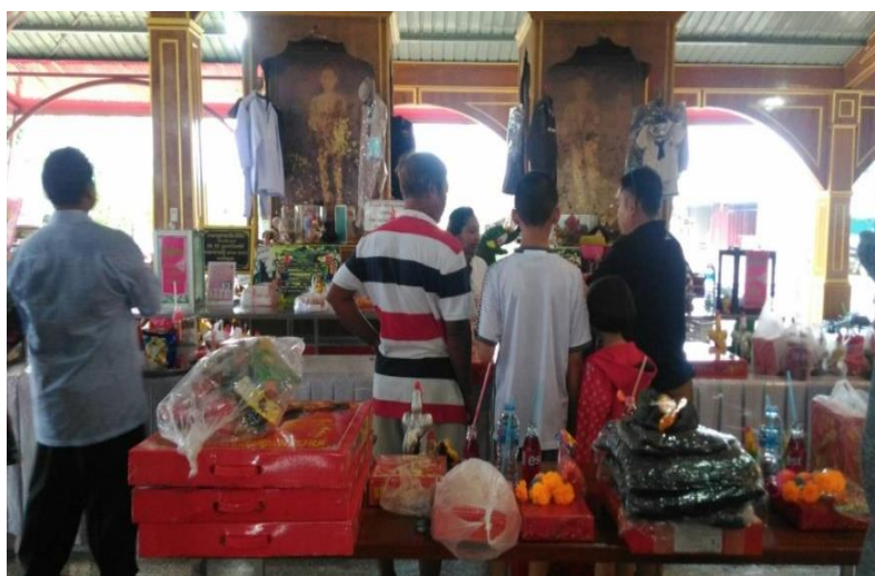
ภาพที่ 28 สิ่งของที่ผู้คนนำมาแก่นบนต่อไอ้ไข่

การถวายสิ่งของที่มีใช้การแก่นบนให้จตุรูป 3 ดอก กราบพระรัตนตรัย ต่อด้วยนมัสการพระคุณเจ้าโดยการตั้งนะโม 3 จบ แล้วเรียกชื่อ ไอ้ไข่ เด็กวัดเจดีย์ และว่าคาถา อิติ อิติ กุมารไข่เจดีย์ จะมหาเถโร ลากะ ลากา ภาวันตุเม ตั้งจิตให้นิ่งแล้วอธิฐานในการถวายสิ่งของปกตินี้มีคำแนะนำว่าควรถวายในวันพระ, วันอังคาร, วันเสาร์ หรือตามความสะดวก