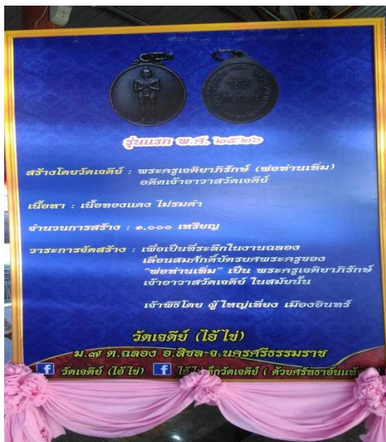
ภาพที่ 34 การจัดทำเหรียญไอ้ไข่สำหรับการบูชา