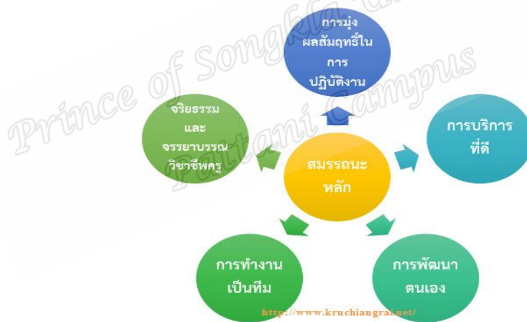
ภาพที่ 2 สมรรถนะหลัก 5 ด้าน