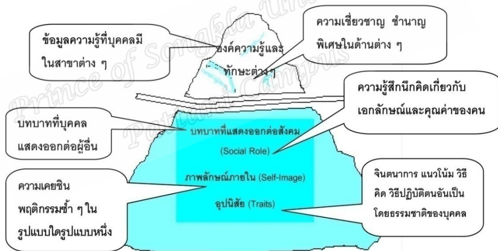
ภาพที่ 4 โมเดลภูเขาน้ำแข็ง (Iceberg Model)