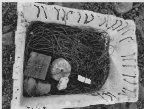
ภาพที่ 7 เบ็ดราวปลากระพง

วิธีการใช้งาน จะนำเบ็ดราวไปวางไว้ในจุดที่ต้องการเรียกว่าวางทุ่น ก่อนจะปล่อยเบ็ดลงน้ำ จะเกี่ยวเหยื่อไว้ที่ปลายเบ็ด ใช้เวลาเกี่ยวเหยื่อ ประมาณ 1 ชั่วโมง เหยื่อที่ใช้สำหรับจับปลาจะใช้ปลาแดงหรือกุ้ง แต่หากจะจับปลากระพงจะใช้ปลาลังหรือปลาเก๋า โดยมากจะเริ่มวางทุ่นประมาณ 1 ทุ่มเป็นต้นไป หลังจากนั้นจะเวียนมาดูเป็นระยะ หากเหยื่อหมดก็วางใหม่ เวียนไปเช่นนี้ วันไหนได้ปลามากตามต้องการ ก็จะได้กลับบ้านเร็ว สิ่งที่ต้องระวังสำหรับการใช้เบ็ดราวนี้คือ ต้องผูกเอ็นให้กระชับ แน่นหนา มิฉะนั้นแล้วปลาจะหลุด ซึ่งปัญหานี้อาจจะพบบ้าง แต่ไม่บ่อยนัก