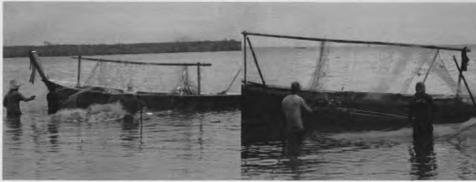
ภาพที่ 9 การวางอวนล้อม

สิ่งที่เป็นภูมิปัญญาเกี่ยวกับการทำประมงพื้นบ้านที่ได้รับคือ การสังเกตชนิดปลาต่าง ๆ ในช่วงแต่ละเดือนของปี พบว่า