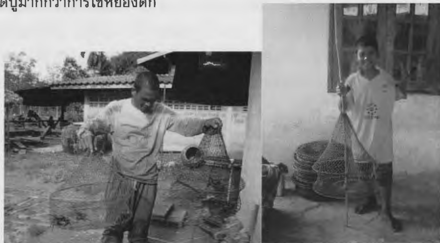
ภาพที่ 4 หอยของดักปู

3) หอยของดักปูที่ใช้ในปัจจุบัน จะเป็นเครื่องมือดักปูที่ใช้ไม้หรือเหล็กทำเป็นโครง แล้วหุ้มด้วย อวน สามารถพับเก็บได้ สาเหตุที่เลือกใช้หอยของดักปูในปัจจุบัน เพราะมีความสะดวกในการขนส่ง เนื่องจากสามารถพับเก็บได้ ทำให้ขนไปได้จำนวนมากในแต่ละครั้ง ส่วนไซมีขนาดใหญ่ ไม่สะดวกต่อการบรรทุกในเรือ ทำให้ได้จำนวนน้อยกว่า แต่ชาวบ้านหลายคนในชุมชนให้ความเห็นว่า ใช้ไซดักปูจะมีโอกาสได้ปูมากกว่าการใช้หอยของดัก