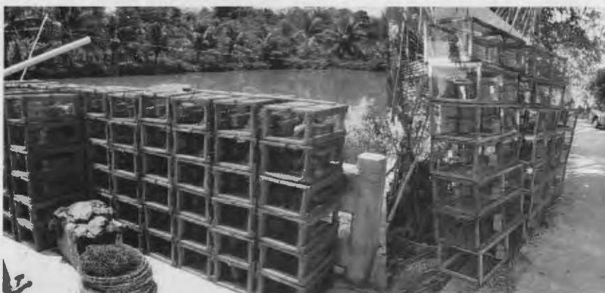
ภาพที่ 5 ไชปลาเก๋า

ลักษณะของเครื่องมือ ไชปลาเก๋า เป็นการดัดแปลงมาจากไชดักปลาตุก เนื่องจากเดิมเคยทำไชไว้ดักปูมาก่อน ซึ่งเมื่อมาเก็บไชที่ดักปูไว้พบว่า บางครั้งได้ปลาติดมาในไชที่ดักปูด้วย จึงเริ่มคิดจะดัดแปลงไชดักปูให้สามารถดักปลาได้มากขึ้นกว่าเดิม โดยมีจุดประสงค์เพื่อนำมาเลี้ยงในกระชังและจำหน่ายเป็นพันธุ์ปลา จึงได้มีความพยายามนำไชปลาตุกมาดัดแปลงให้เหมาะสม