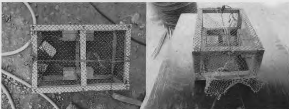
ภาพที่ 3 ไซดักปูที่ดัดแปลงจากไซดักปลาเก๋า

2) ไซดัดแปลงจากไซปลาเก๋า เป็นเครื่องมือดักปูที่ใช้ดักในช่วงน้ำแห้ง ตามบริเวณพื้นที่ร่องน้ำของป่าชายเลน เมื่อน้ำขึ้นเต็มจึงมาเก็บ