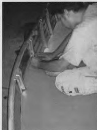
ภาพที่ 10 การตกแต่งเรือฟรีส