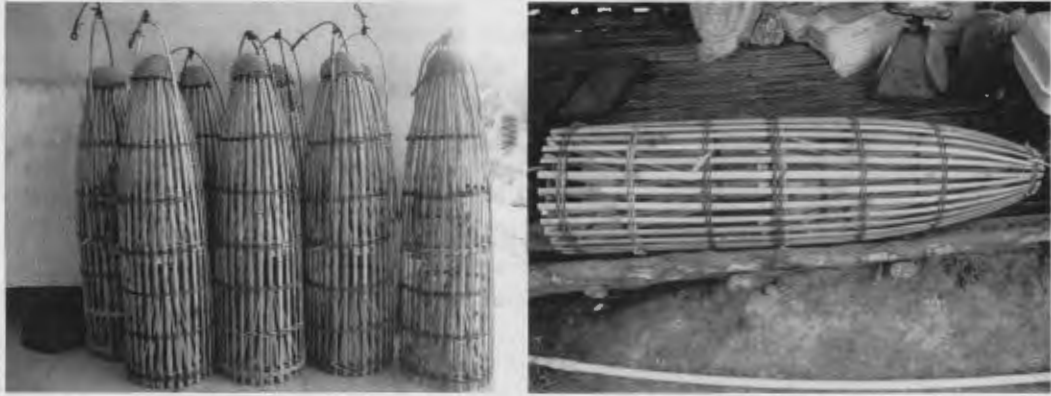
ภาพที่ 2 ไซปลาดุกทะเล

ดักปลาได้บริเวณไหน เพราะนิสัยปลาดุกถ้าขนาดไม่ใหญ่มากมักจะว่ายตามกันเข้ามาเป็นฝูง แต่หากเป็นปลาตัวใหญ่จะมีพฤติกรรมหากินเพียงตัวเดียว โดยอาจมีขนาดใหญ่เท่าหน้าแข้งหรือยาวประมาณครึ่งเมตร ความถี่ในการวางไซจะวาง 3 วัน ต่อครั้ง แต่แต่ละครั้งจะใช้เวลาประมาณ 3-7 วัน ก่อนจะมายกไซ และจะยกไซช่วงเวลาน้ำขึ้นสูงสุด คือช่วง 14 -15 ค่ำ หรือ 1 ค่ำ