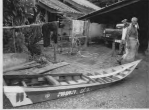
ภาพที่ 11 การต่อเรือพริส