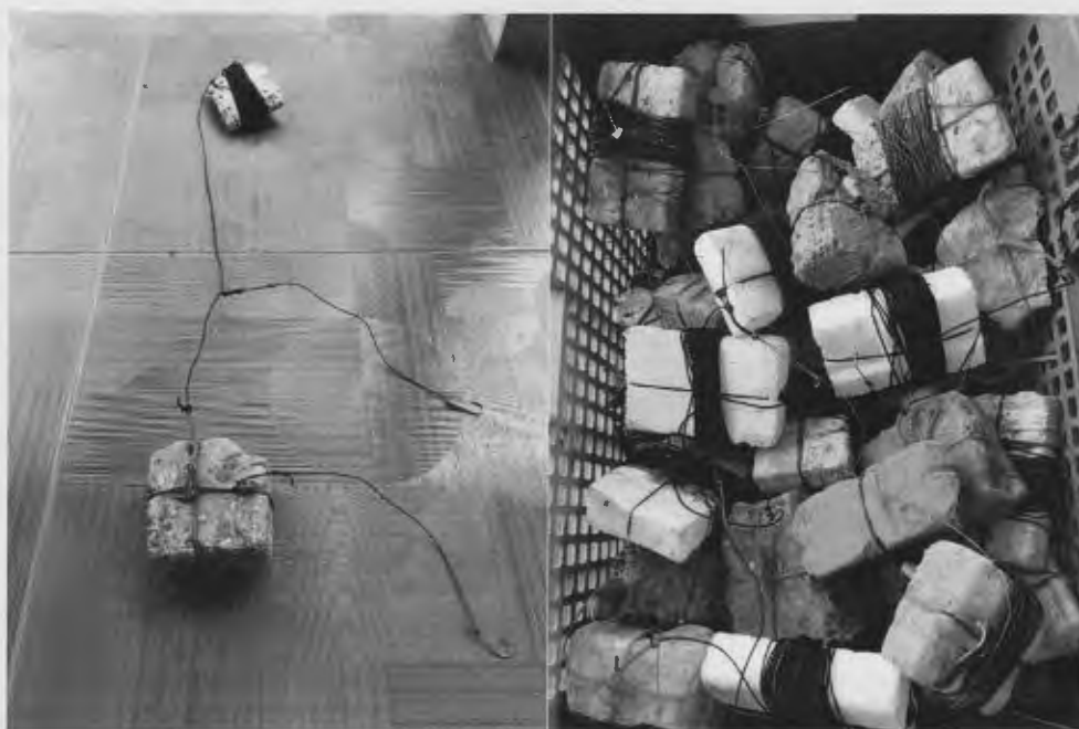
ภาพที่ 8 เบ็ดทุ้ม

ลักษณะของเครื่องมือ จะใช้เชือกเอ็นผูกทุ้มติดกับหินหรืออิฐมอญที่ใช้ถ่วงน้ำหนัก ความยาวของเชือกจะขึ้นอยู่กับระดับน้ำ จะนำเชือกเอ็นที่ผูกเบ็ดไว้ตรงปลาย มาผูกติดกับเชือกเอ็นที่ผูกทุ้ม โดยให้มีความสูงขึ้นมาจากหินหรืออิฐมอญที่ถ่วงน้ำหนักประมาณ 8 นิ้ว ความยาวของเชือกเอ็นที่มีเบ็ดผูกปลายก็จะประมาณ 8 นิ้ว เบ็ดที่ผูกไว้ปลายเชือกจะเลือกใช้แบบมีเงี่ยง เพื่อให้ปลาที่เข้ามากินเหยื่อสุบเบ็ดแล้วไม่หลุดไปง่าย ๆ ดังแสดงในภาพที่ 8