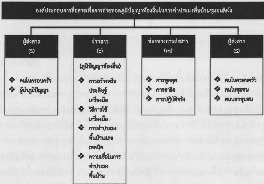
ภาพที่ 12 องค์ประกอบการสื่อสารเพื่อการถ่ายทอดภูมิปัญญาท้องถิ่นในการทำประมงพื้นบ้านของชุมชนลิพัง