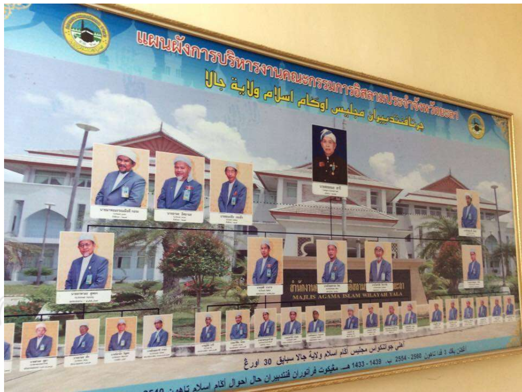
ภาพที่ 4 แผนผังการบริหารงานคณะกรรมการอิสลามประจำจังหวัดยะลา ถ่ายเมื่อวันที่ 29 มีนาคม 2560 ที่สำนักงานคณะกรรมการอิสลามประจำจังหวัดยะลา