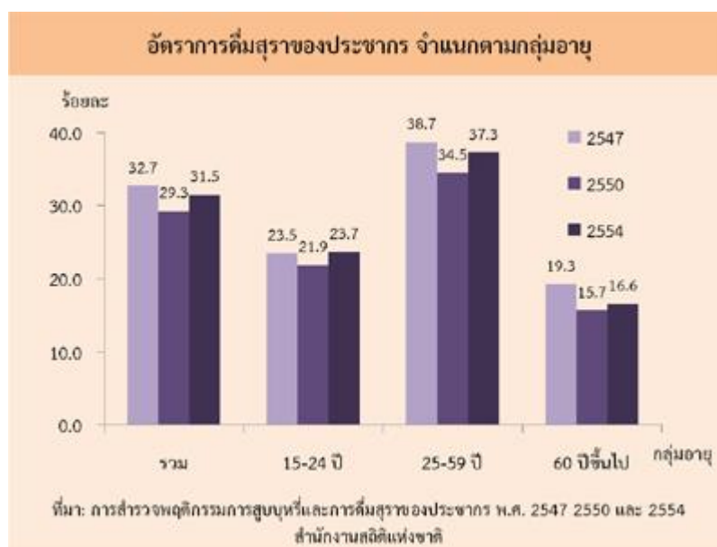
แผนภาพที่ 2 อัตราการดื่มสุราของประชากร จำแนกตามอายุ

สำนักงานสถิติแห่งชาติพบข้อมูลที่น่าสนใจเกี่ยวกับการดื่มสุราของประชากรอายุ 15 ปีขึ้นไป ซึ่งพบว่าผู้ชายกว่าร้อยละ 50 ดื่มสุราแม้จะมีแนวโน้มลดลงก็ตามแต่ยังถือว่ามึนตราการดื่มสุราที่ตอนช่วงสูง ขณะที่ผู้หญิงไทยประมาณ 1 ใน 10 ก็เป็นผู้ดื่มเช่นเดียวกันและมีแนวโน้มเพิ่มขึ้นอย่างรวดเร็ว กลุ่มวัยทำงาน (อายุ 25-59 ปี) มีการดื่มสุราที่สูงกว่ากลุ่มอื่น รองลงมาเป็นกลุ่มวัยรุ่น (อายุ 15-24 ปี) และกลุ่มวัยสูงอายุ (อายุ 60 ปีขึ้นไป) ซึ่งพฤติกรรมกรรมการดื่มสุราของคนไทยเช่นนี้นับเป็นปัจจัยเสี่ยงสำคัญที่ก่อให้เกิดการสูญเสียต่างๆ ตามมาอย่างมากมาย (3)