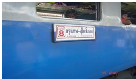
ภาพที่ 2 ลักษณะขบวนรถไฟสายใต้ ขบวนรถเร็วที่ 171/172 (เดินในเส้นทางสายใต้ ระหว่างสถานีกรุงเทพ-สุโขทัย)