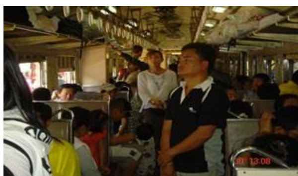
ภาพที่ 3 ผู้โดยสารที่ใช้บริการกับขบวนรถเร็วชั้น 3 ฟรี

ขอบเขตของขบวนรถเชิงพาณิชย์ เป็นบริการด้านการโดยสารและสินค้า ซึ่งบริการด้านการโดยสาร ได้แก่ ขบวนรถ ดังนี้-