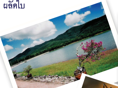
อ่างน้ำ ม.อ.

บริเวณเขาคอหงส์นี้เป็นรอยต่อระหว่างเขตภูมิอากาศแบบชื้นกับกึ่งชื้น ลักษณะร่วมระหว่างป่าดิบแล้งและป่าดิบชื้น ประกอบกับพรรณไม้หลากหลายชนิดในพื้นที่เขาคอหงส์เป็นไม้ผลัดใบ