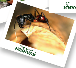
มดไม้จันทร์