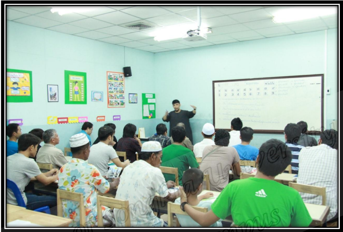
ห้องเรียนแถมอัสตัฟชาย โครงการอบรมผู้สนใจอิสลามของมูลนิธิสันติชน