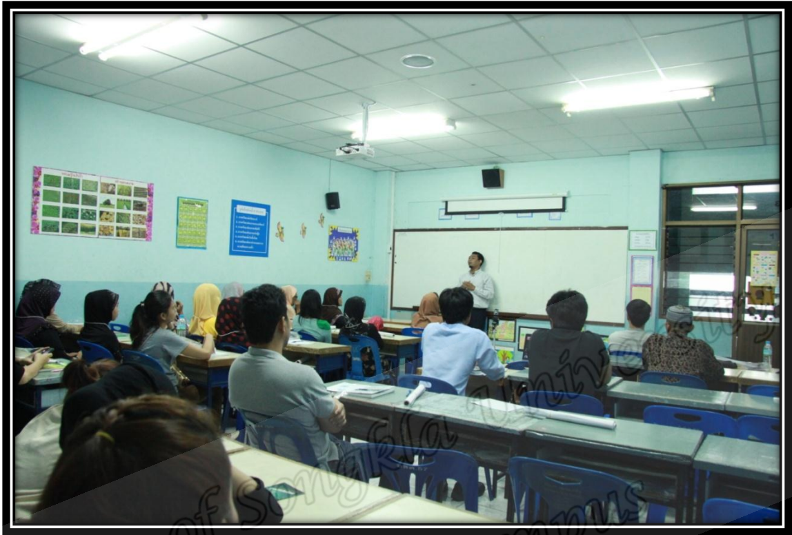
ปฐมนิเทศผู้สนใจอิสลาม โครงการอบรมผู้สนใจอิสลามของมูลนิธิสันติชน