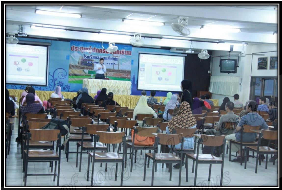
ห้องเรียนรวมมุสลัฟชาย และมุสลัฟหญิง โครงการอบรมผู้สนใจอิสลามของมูลนิธิสันติชน