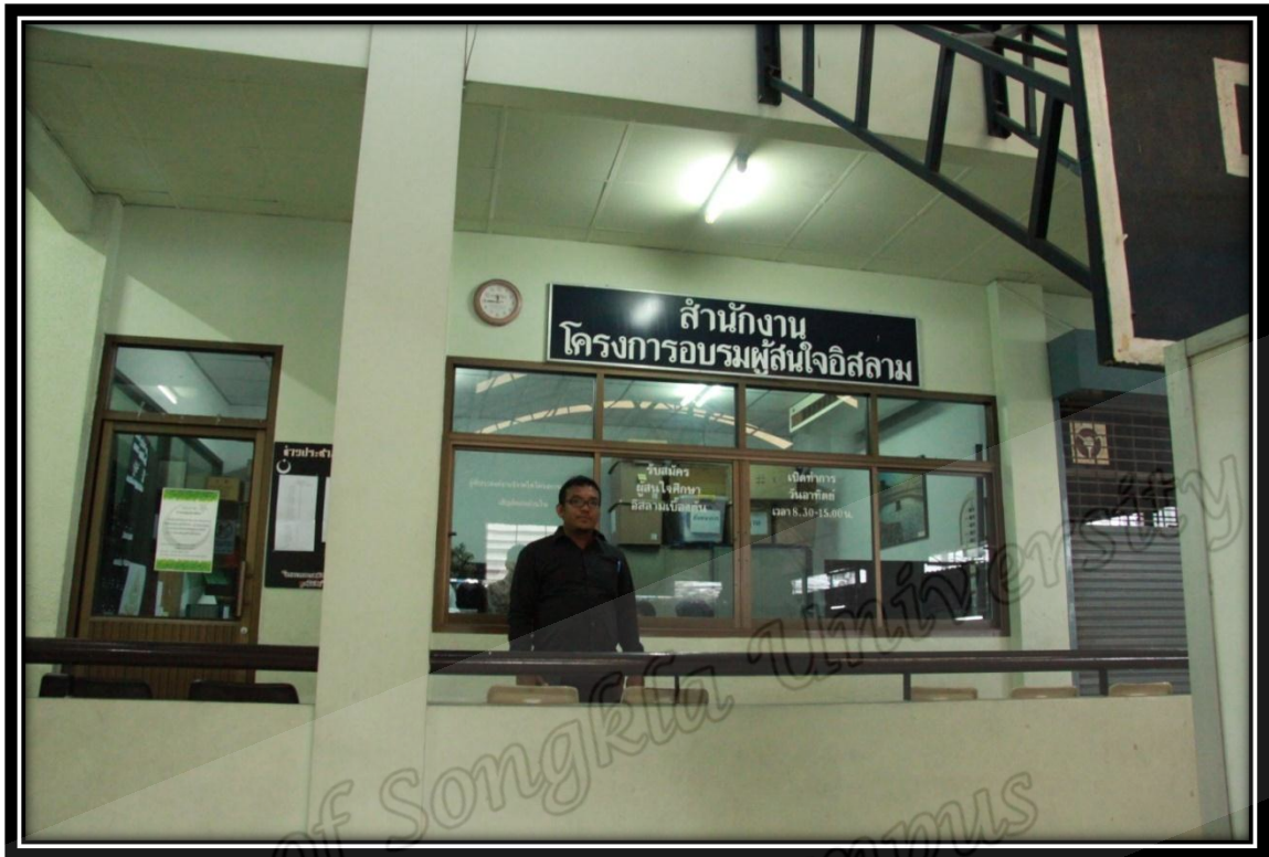
สำนักงานโครงการอบรมผู้สนใจอิสลามของมูลนิธิสันติชน