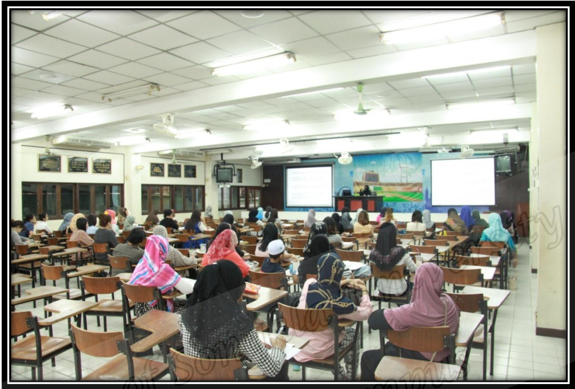
ห้องเรียนแถมอัลตล์ฟหญิง โครงการอบรมผู้สนใจอิสลามของมูลนิธิสันติชน