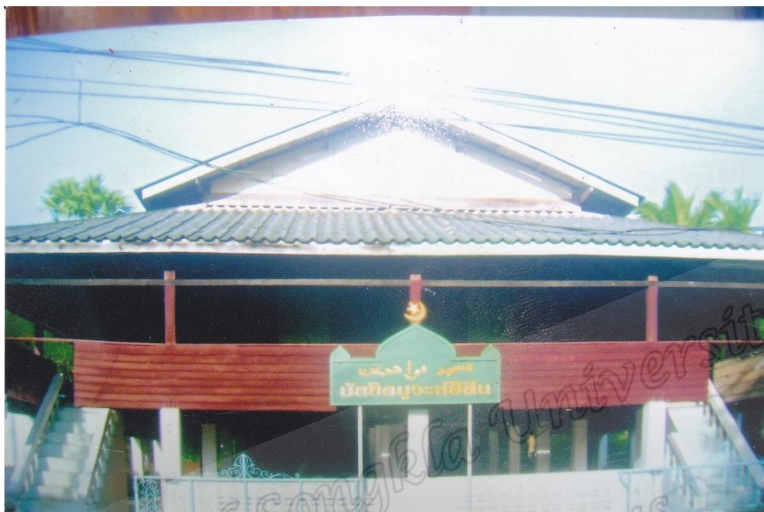
มัสญิดอัสสุลวะฮ์ฮิดีน