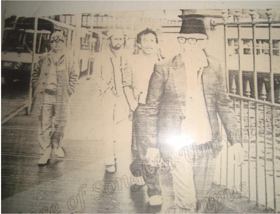
โต๊ะครูอะหมัด ลูกพี่เดินทางสัมมนาวิชาการต่างประเทศ