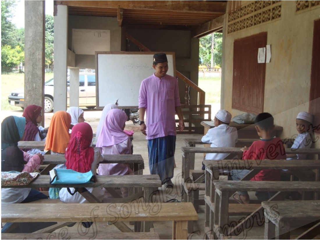
การเรียนภาคพรีกัวอ์นน์ประจำมัสญิดอันซอริสสุนนะฮ์