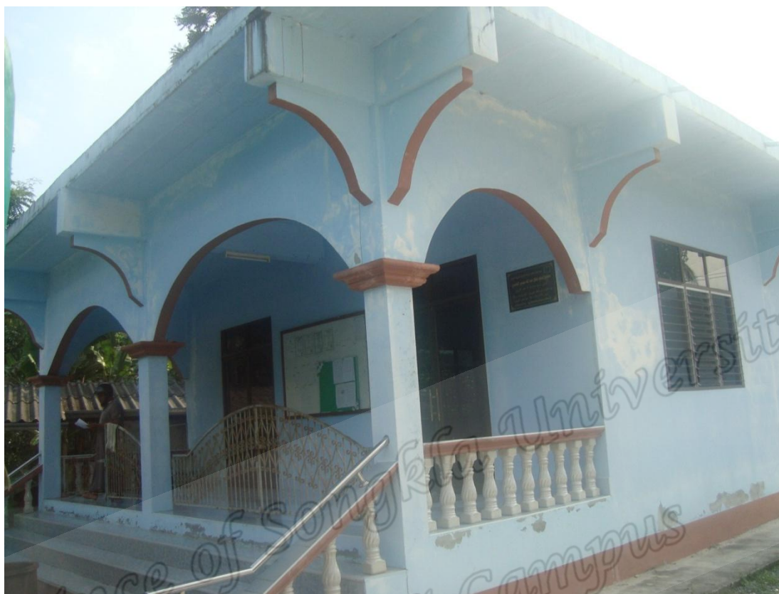
มัสญิดคารุลเอชะซาน