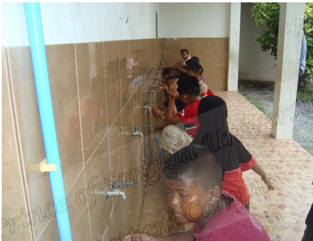
ค่าขอครบเยาวชนภาคฤดูร้อนประจำมัธยมศกษณ-มุฮัมมะดียะฮ์