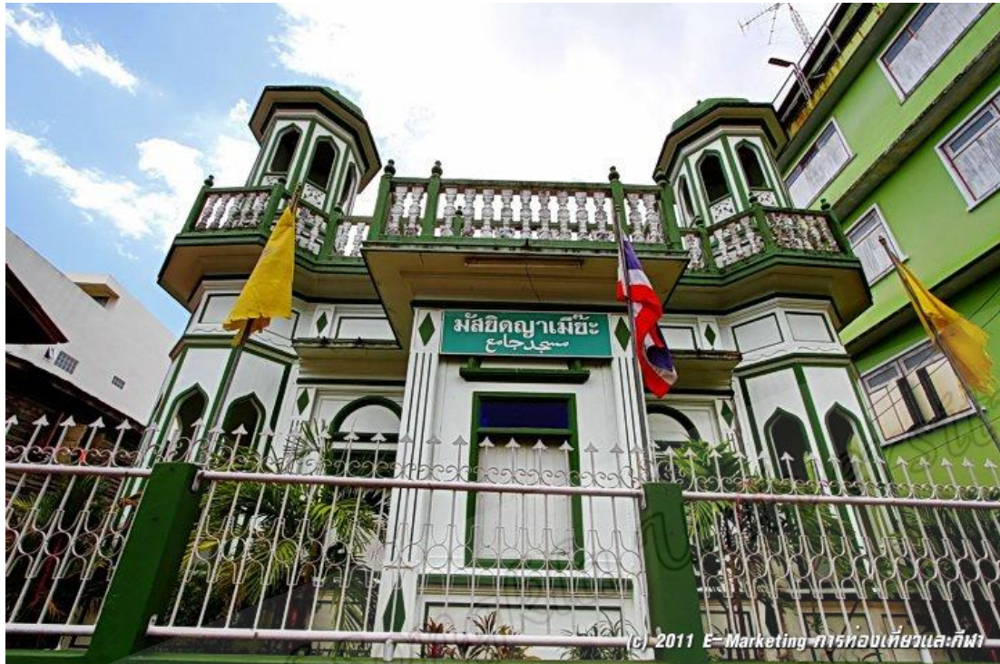
มัสยิดนูญาเมียะ