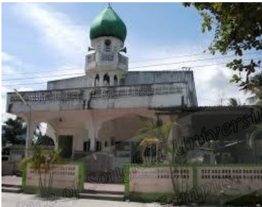
มัสญิดมูวาฮิดีน