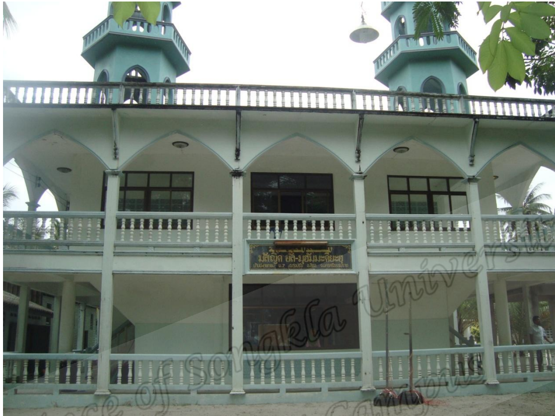
มัสญิดอัล-มุฮัมมะดียะฮฺ