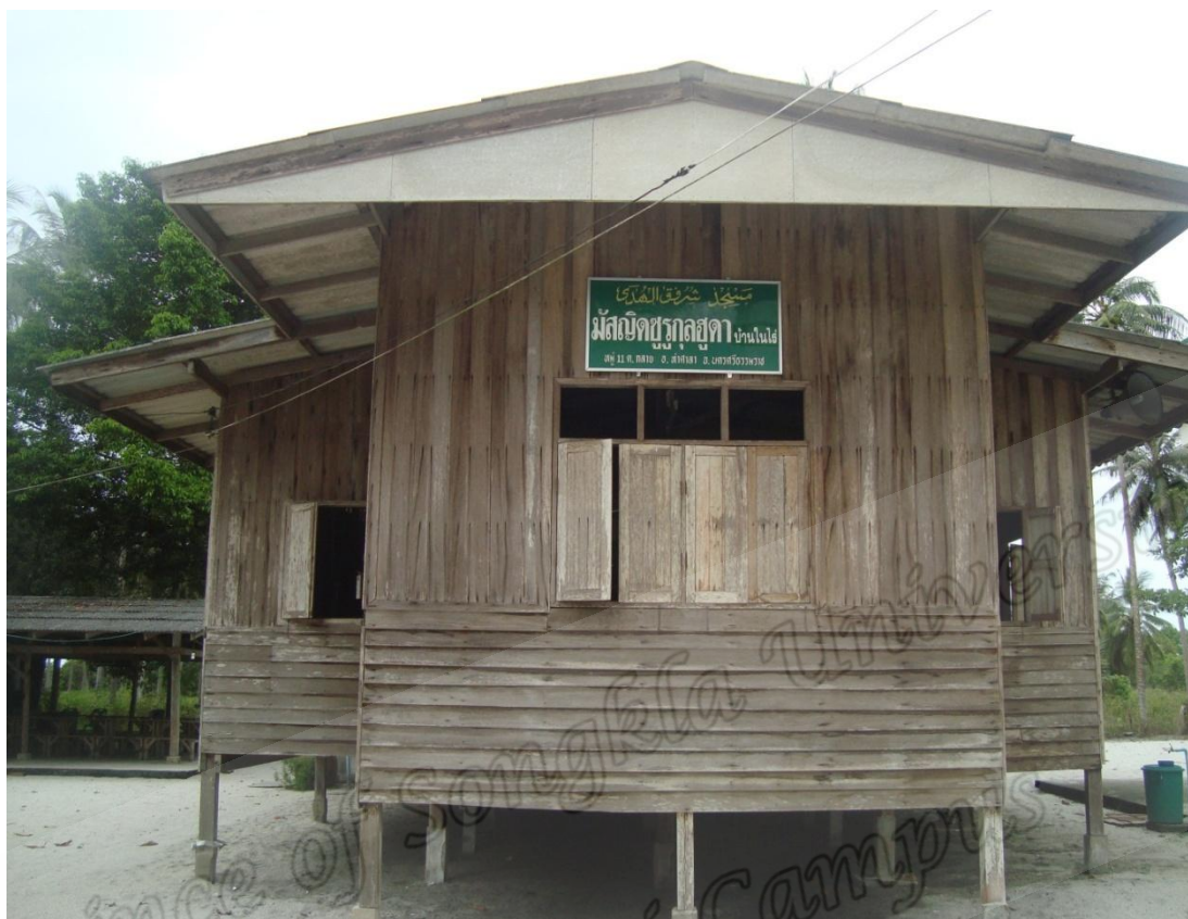
มัสญิดซุกรุลสุดา