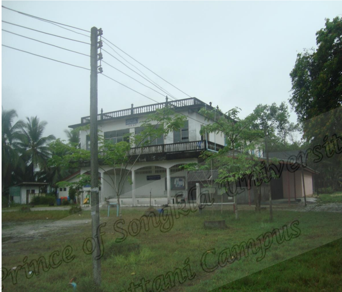
มัสญิดนุรุดดีน