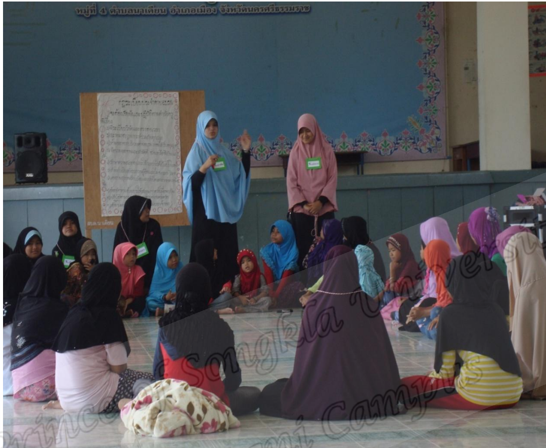
ถ่ายอบรมเยาวชนภาคฤดูร้อนมัศฺญิตมุวาฮิดีน