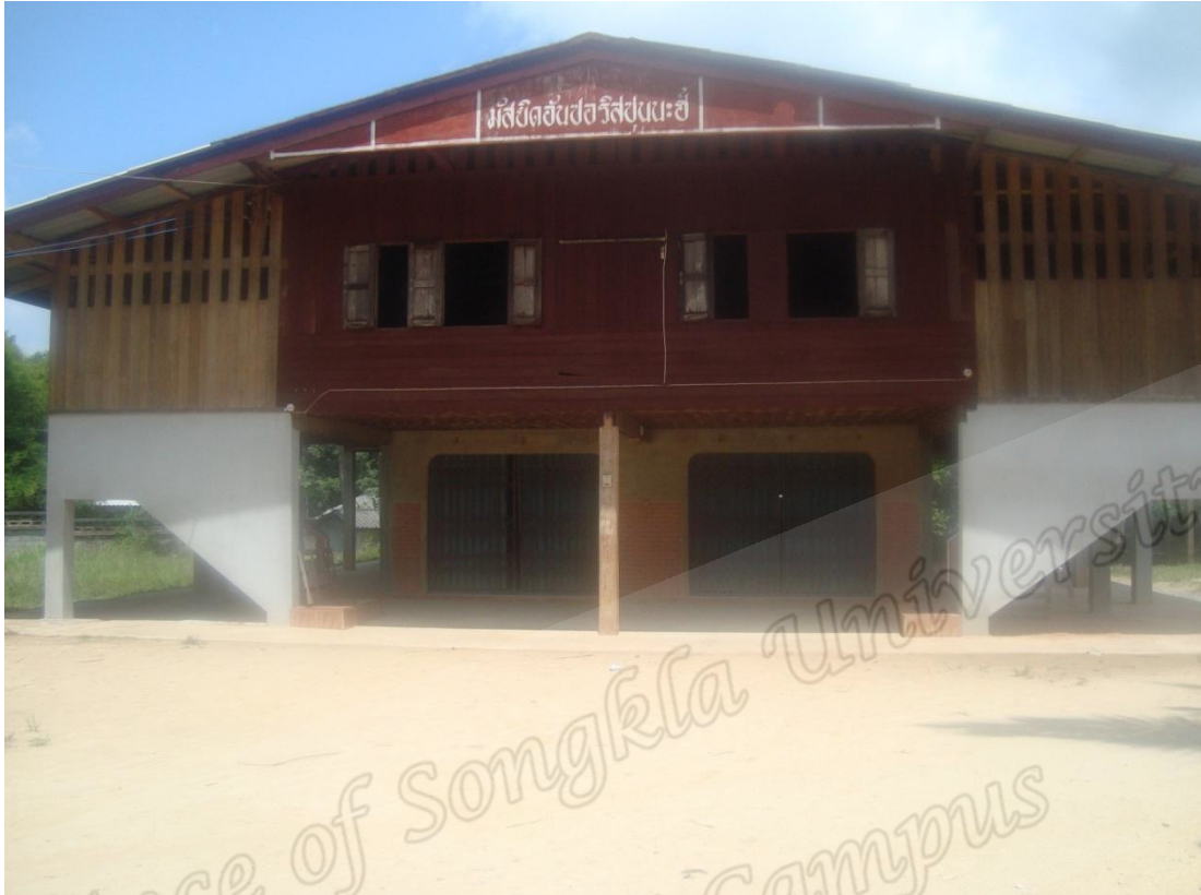
มัสยิดอับดุลอะซีซ