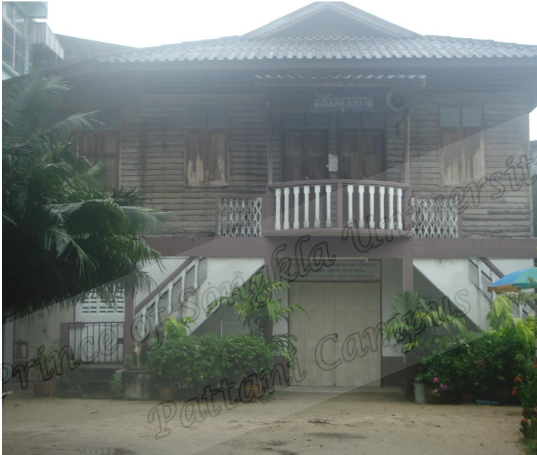
มัสยิดคุตตลาม