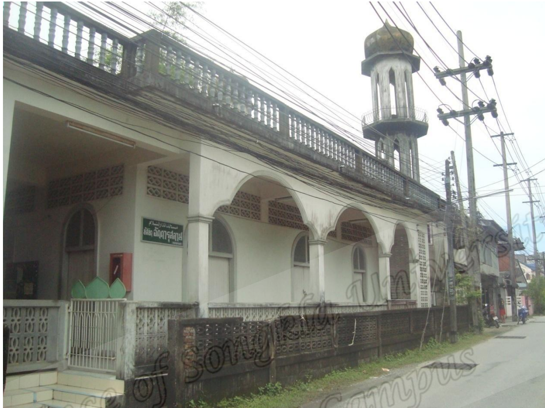
มัสญิดอัลฟารุสตาม