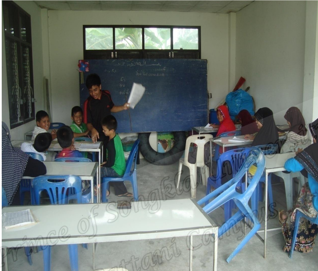
การเรียนภาคพินทุอัยน์ประจำมัสญิดดารุซซุศร์