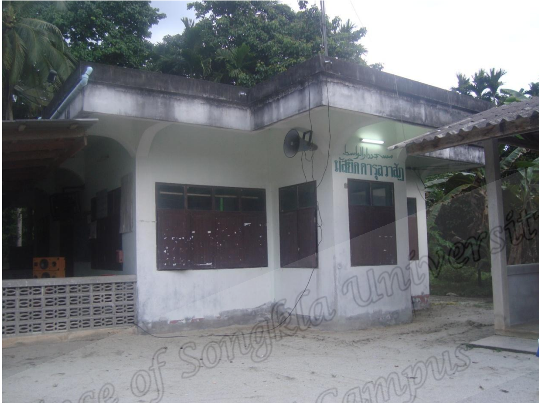
มัสยิดดารุลวาฮิด