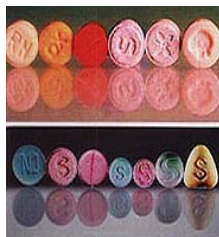
เอ็กซ์ตาซี