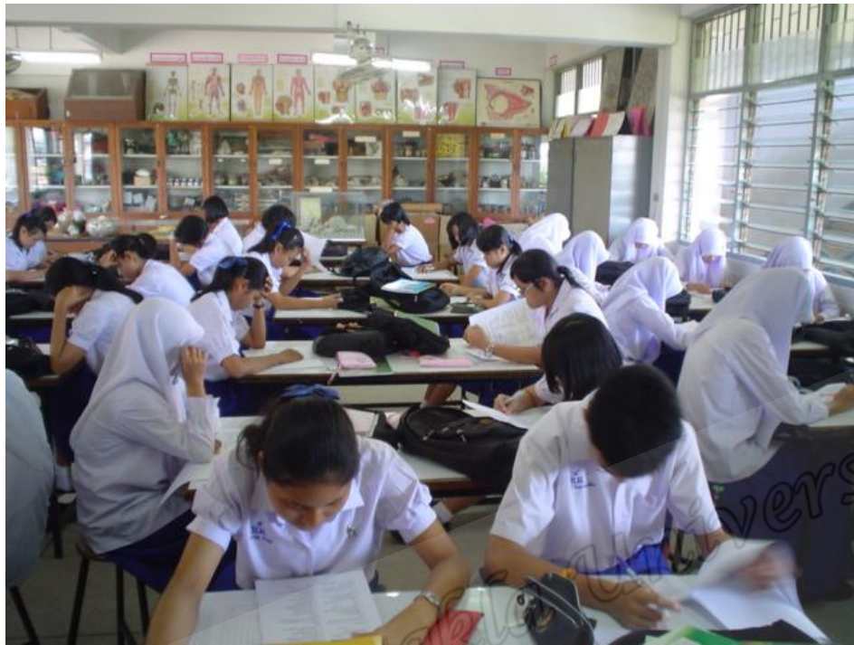
นักเรียนห้อง A และห้อง B ทดสอบหลังการจัดการเรียนรู้ (Post Test)