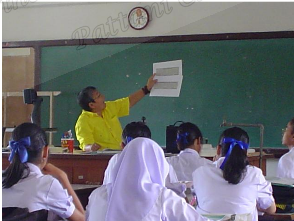
นักเรียนห้อง B ชี้นำไปปฏิบัติ (Acting)