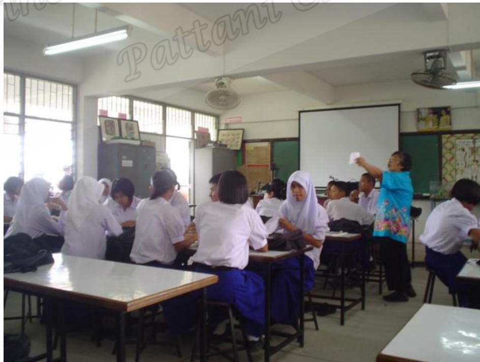
นักเรียนห้อง B ขึ้นตั้งคำถาม (Questioning)