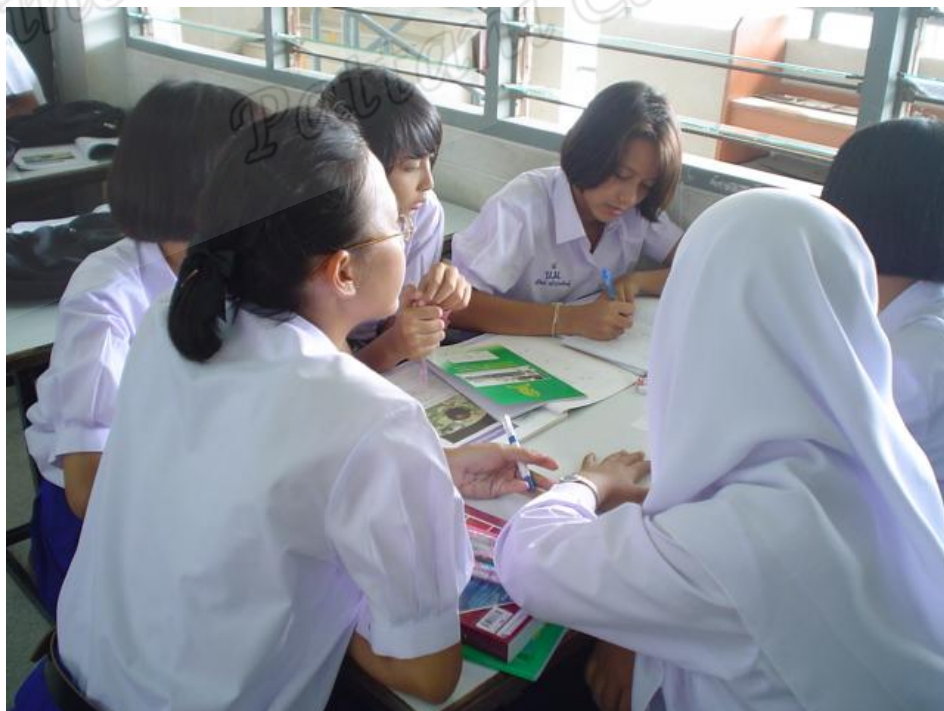
นักเรียนห้อง B ชั้นค้นหาคำตอบ (Exploring)