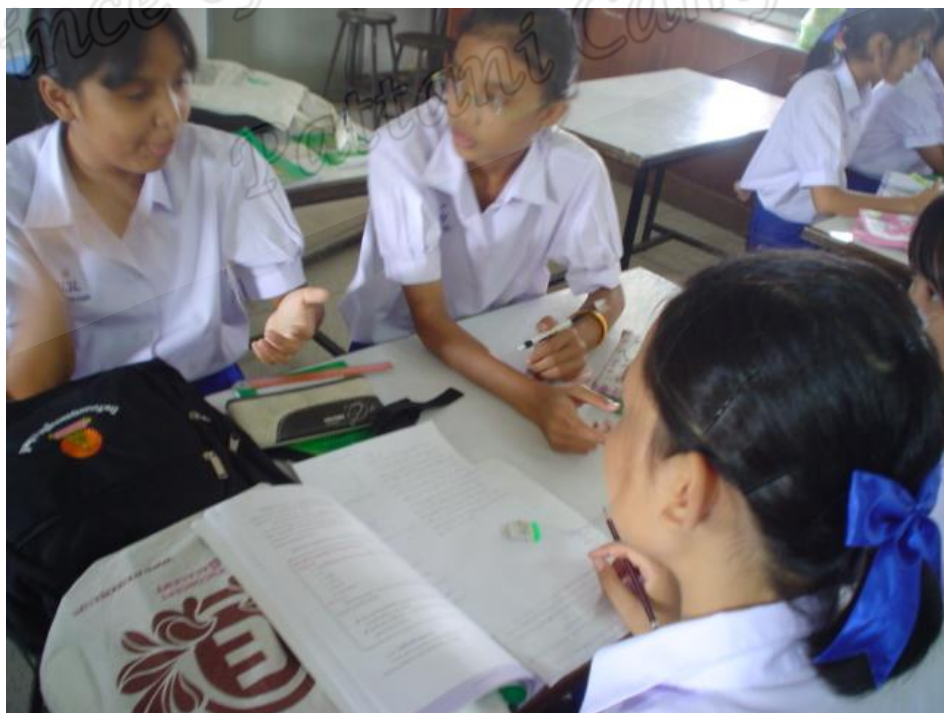
นักเรียนห้อง A ชั้นวางแผน (Planning)