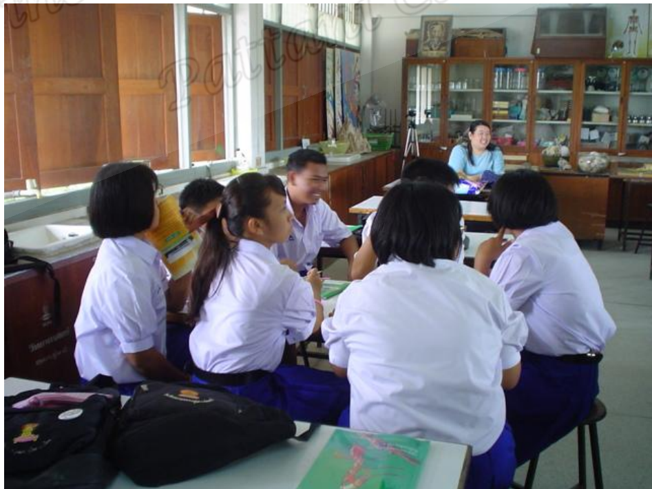
นักเรียนห้อง B ชั้นแลกเปลี่ยนประสบการณ์ (Sharing)