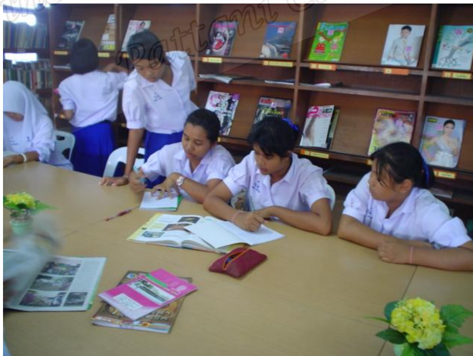
นักเรียนห้อง A ชั้นขยายขอบเขตความรู้และความคิด (Extending)