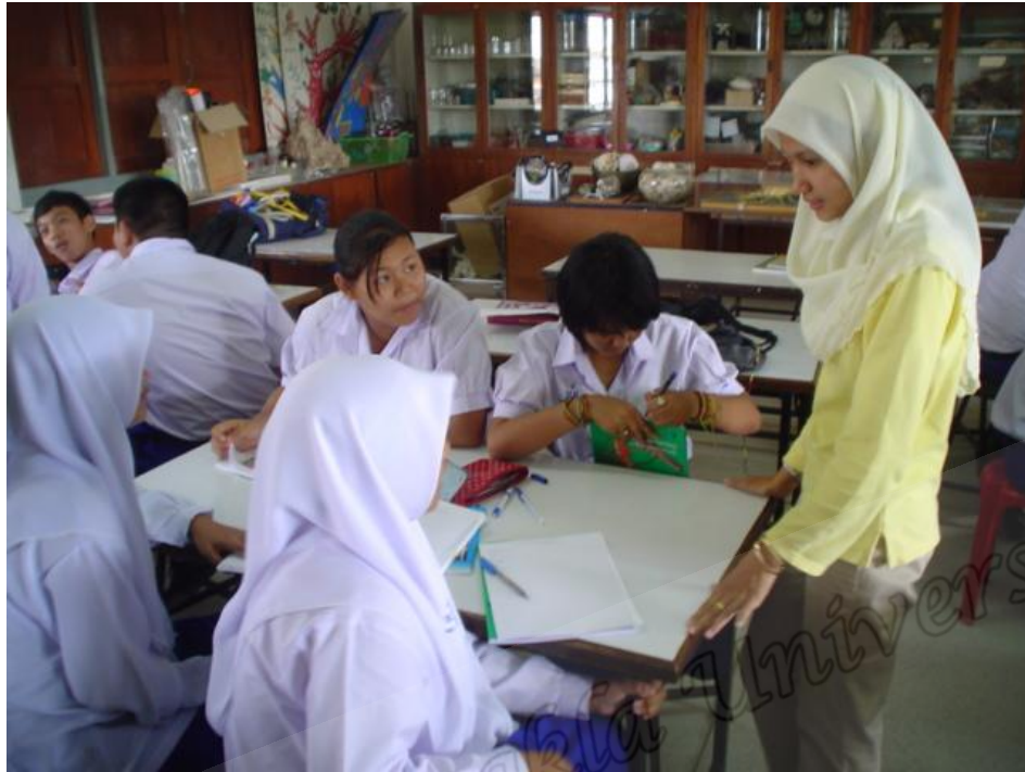
นักเรียนห้อง A ชื่อนำไปปฏิบัติ (Acting)