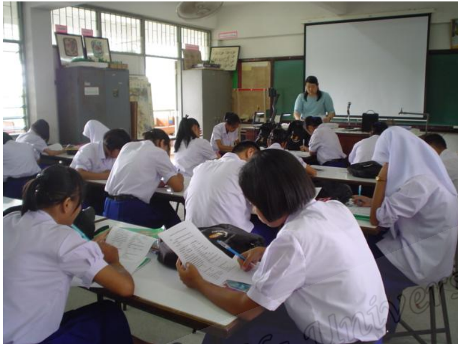
นักเรียนห้อง A และห้อง B ทดสอบก่อนการจัดการเรียนรู้ (Pre-Test)