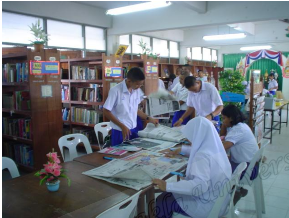
นักเรียนห้อง B ชั้นขยายขอบเขตความรู้และความคิด (Extending)