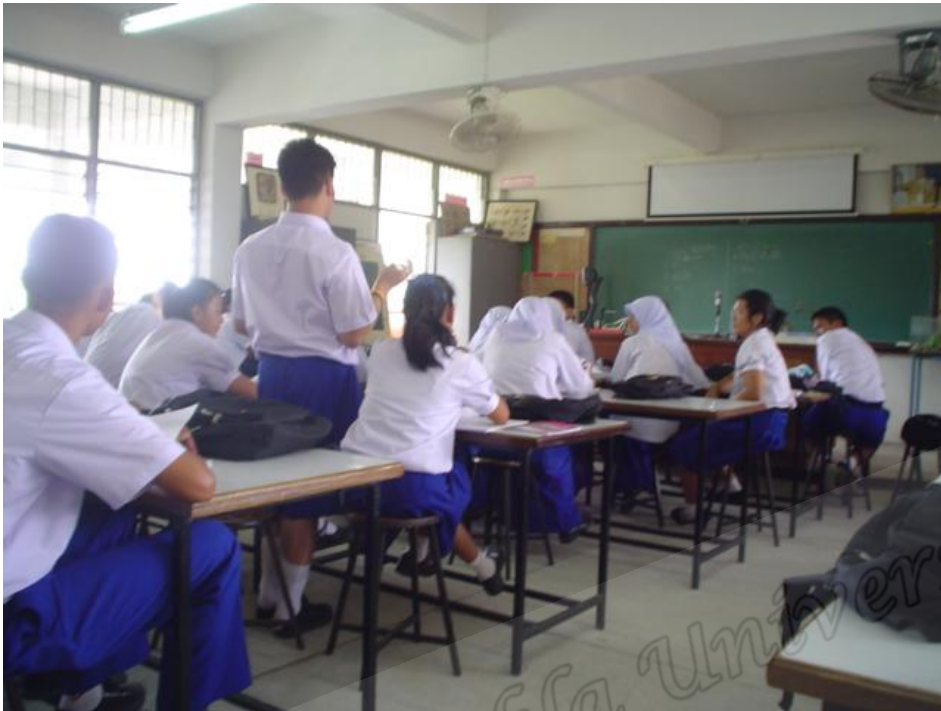
นักเรียนห้อง A ชั้นตั้งคำถาม (Questioning)