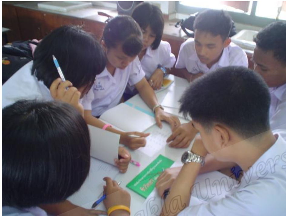
นักเรียนห้อง B ชั้นวางแผน (Planning)