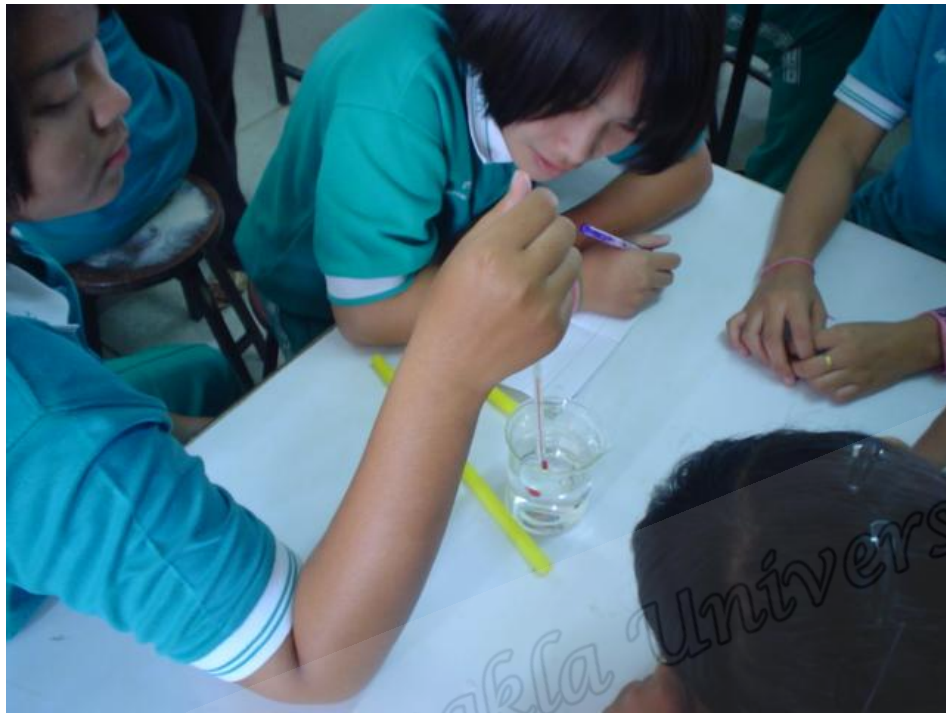
นักเรียนห้อง A ชั้นค้นหาคำตอบ (Exploring)