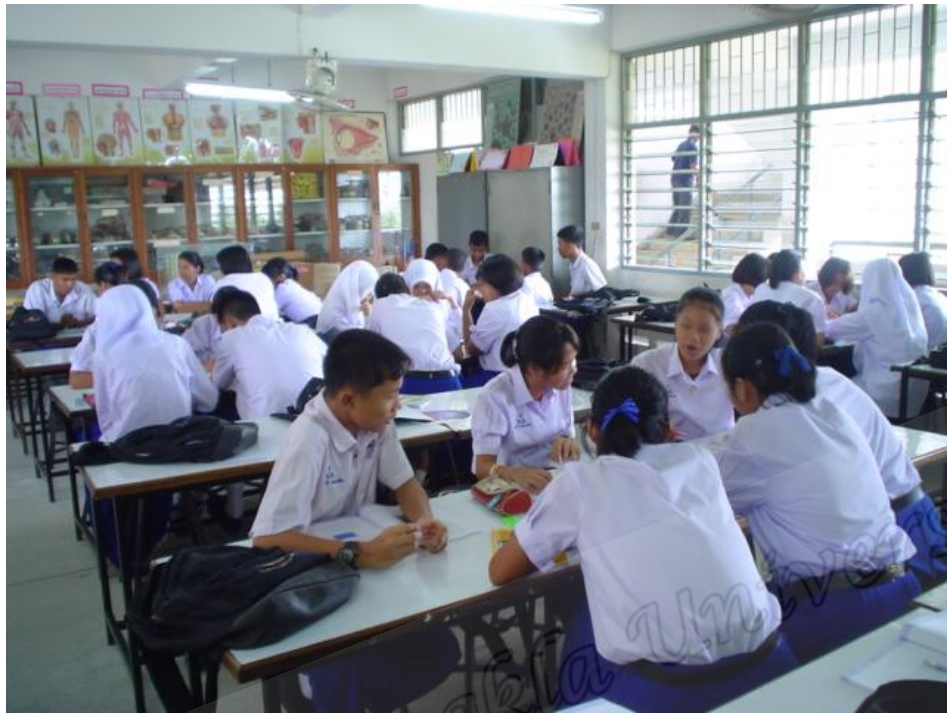
นักเรียนห้อง B ชั้นสะท้อนความคิด (Reflecting)