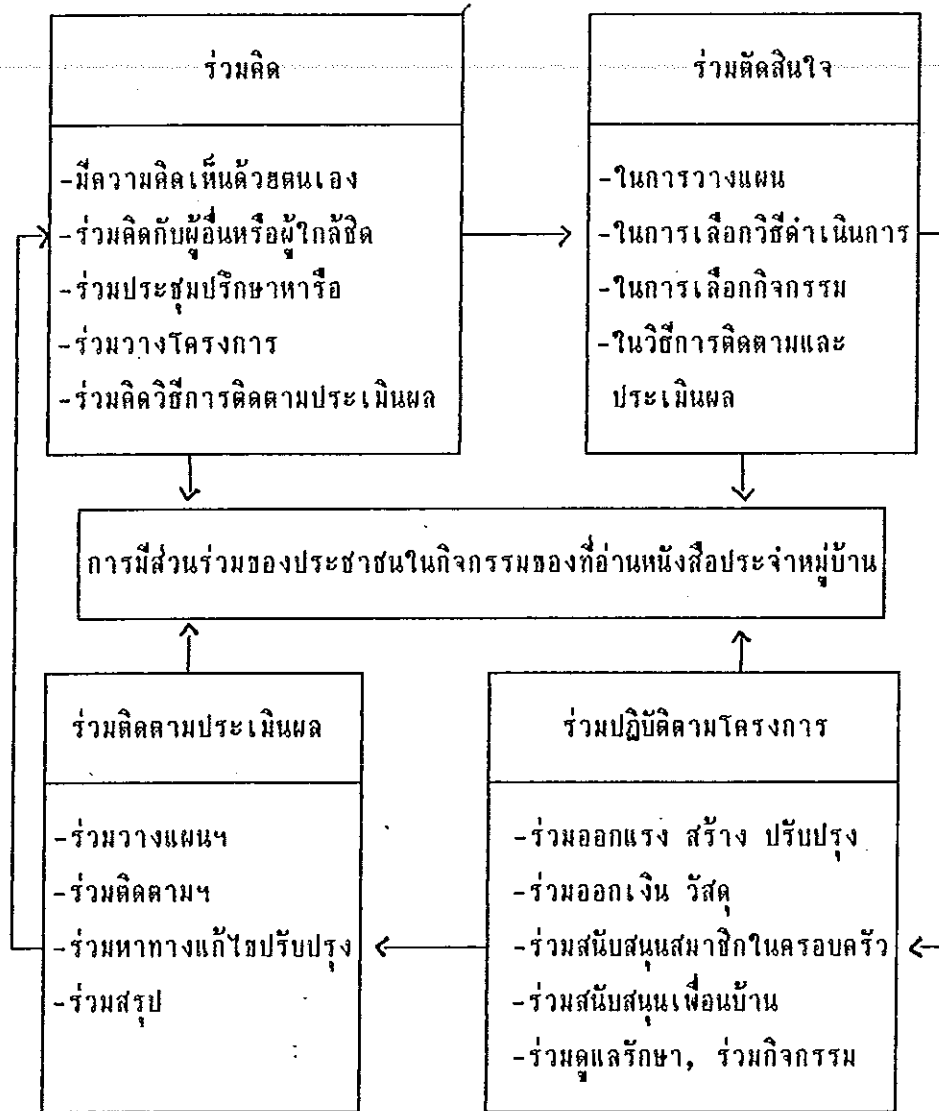
แผนภูมิ 1 แนวความคิดเชิงทฤษฎี เรื่องการมีส่วนร่วมของประชาชนในกิจกรรมของ ที่อ่านหนังสือประจำหมู่บ้าน

จากแผนภูมิ 1 แสดงให้เห็นว่า การมีส่วนร่วมของประชาชนในกิจกรรมของที่อ่านหนังสือประจำหมู่บ้านที่สำคัญมี 4 ด้าน ได้แก่ ร่วมคิด ร่วมตัดสินใจ ร่วมปฏิบัติตามโครงการและร่วมติดตามประเมินผล ซึ่งมีรายละเอียดลักษณะของการมีส่วนร่วมแต่ละด้าน สอดคล้องกับลักษณะสำคัญของการมีส่วนร่วมของประชาชนในการพัฒนาเขตตำบลตะเคียนเลื่อน อำเภอเมือง จังหวัดนครสวรรค์ กรมพัฒนาชุมชน (2518 : 23)