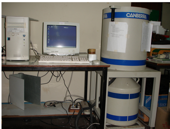
ภาพประกอบ 6 เครื่องแกมมาสเปกโตรมิเตอร์หัววัดแบบสารกึ่งตัวนำ HPGe