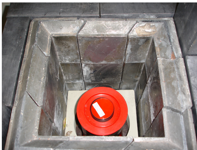
ภาพประกอบ 8 ตัวอย่างหินวางบนหัววัดหัววัดรังสีชนิดเรืองแสง NaI(Tl)