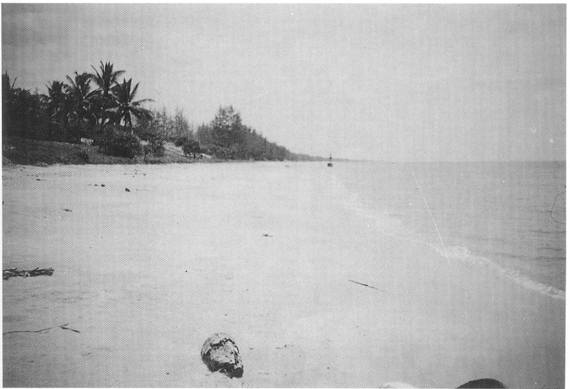
ภาพที่ 1 จุดเก็บตัวอย่าง ชายหาดหน้ามัสยิดบ้านในไร่ ตำบลตลิ่งชัน อำเภอจะนะ จังหวัดสงขลา