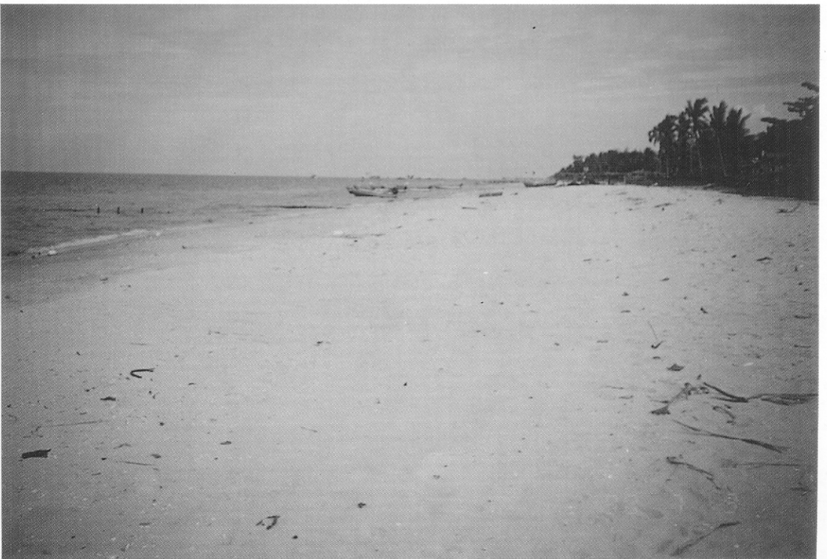
ภาพที่ 3 จุดเก็บตัวอย่าง หน้าบ้านรับแพรง อำเภอรอนน็ด จังหวัดสงขลา