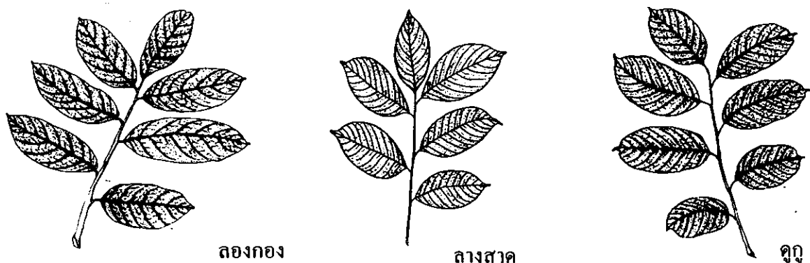
รูปที่ 1 ลักษณะทั่วไปของใบพืชสกุลกลางสาด

ลักษณะช่อดอกและดอก โดยทั่วไปพืชสกุลกลางสาดออกดอกเป็นช่อและออกเป็นกลุ่มในช่อดอกประกอบด้วยดอกย่อยที่ไม่มีก้านดอก ดอกมักเป็นแบบสมบุรณ์เพศคือมีส่วนของเกสรตัวผู้และตัวเมียอยู่ในดอกเดียวกัน มีกลีบดอกสีขาวนวล 5 กลีบติดกัน มีเกสรตัวผู้ 10 อัน และมีรังไข่เป็นรูปทรงกลม (รูปที่ 2) พิมพรรณ (2524) ศึกษาลักษณะดอกของลองกอง โดยศึกษาลักษณะตาดอก ระยะดอกตูมดอกบาน พบว่า ลองกองมีดอกเป็นช่อแบบ spike มี 5 กลีบดอก 5 กลีบเลี้ยง และ เกสรตัวผู้ 10 อัน ดอกเจริญเป็นผลโดยไม่มีการปฏิสนธิ Prakash และคณะ (1977) ศึกษาลักษณะสัณฐานวิทยาของดอกและผลของดูกูและกลางสาด พบว่า ดอกมีลักษณะคล้ายกันคือเป็นแบบ spike มีสีเหลืองนวลมีทั้งเกสรตัวผู้และเกสรตัวเมียอยู่ในดอกเดียวกัน เกสรตัวผู้มี 10 อัน เป็นท่อเล็กๆ ฐานหลอมรวมกัน รังไข่เป็นรูปไข่มีขนาดเล็ก ภายในมี 5 ช่อ