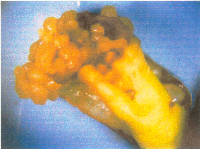
รูปที่ 1 ลักษณะของแคลลัสปาล์มน้ำมันที่ให้ผลผลิตแล้วที่ได้จากการเพาะเลี้ยงใบอ่อนบนอาหารสูตร MS เติม dicamba เข้มข้น 1 มิลลิกรัม/ลิตร เป็นเวลา 3 เดือน (8x)

แคลลัสเพียง 1.67 เปอร์เซ็นต์ เฉพาะความเข้มข้น 10 มิลลิกรัม/ลิตร ที่อุณหภูมิ 26\pm 4 องศาเซลเซียส เท่านั้น นอกจากนี้พบว่า การเติมสารควบคุมชนิดดังกล่าว (NAA) ส่งผลให้ชิ้นส่วนสร้างรากทั้งสองระดับอุณหภูมิโดยเมื่อเพาะเลี้ยงที่อุณหภูมิ 28\pm 0.5 องศาเซลเซียส ชิ้นส่วนสามารถสร้างรากได้เกือบทุกความเข้มข้นยกเว้นการเติม NAA เข้มข้น 1 มิลลิกรัม/ลิตร และที่อุณหภูมิ 26\pm 4 องศาเซลเซียส มีการสร้างรากเมื่อเติม NAA เข้มข้น 5-40 มิลลิกรัม/ลิตร (ตารางที่ 1) หลังจากย้ายรากดังกล่าวไปเพาะเลี้ยงบนอาหารสูตร MS เติม dicamba หรือ 2,4-D ความเข้มข้น 1, 2.5, 5 และ 10 มิลลิกรัม/ลิตร พบว่าไม่สามารถชักนำแคลลัสจากชิ้นส่วนดังกล่าวได้