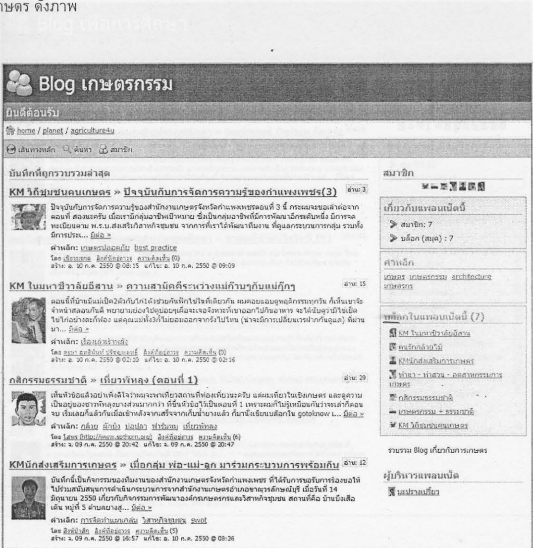
ภาพแพลนเน็ต Blog เกษตรกรรม

เป็นการสร้างแพลนเน็ตใน Gotoknow.org เพื่อรวบรวมบล็อกที่เกี่ยวข้องกับการเกษตร โดยได้รวบรวมบล็อกของนักวิชาการส่งเสริมการเกษตร ผู้ที่มีอาชีพเกษตรกรและผู้ที่เกี่ยวข้องกับการเกษตร ดังภาพ