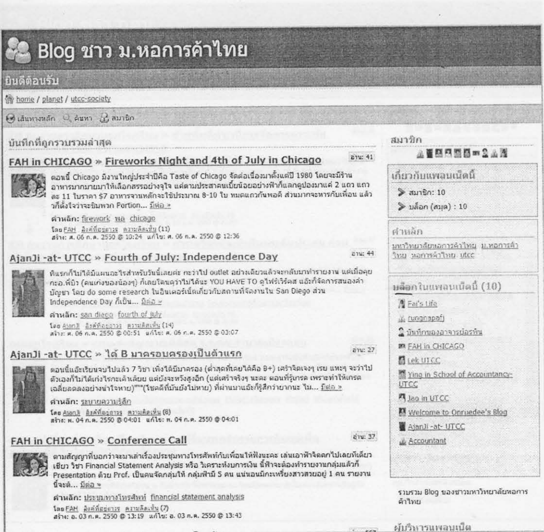
ภาพแพลนเน็ต Blog ชาว ม.หอการค้าไทย

เป็นการสร้างแพลนเน็ตใน Gotoknow.org เพื่อรวบรวมบล็อกของสมาชิกที่เกี่ยวข้องกับมหาวิทยาลัยหอการค้าไทย เช่น พนักงานของหน่วยงานต่างๆ ของมหาวิทยาลัย อาจารย์ ศิษย์เก่า เป็นต้น ดังภาพ