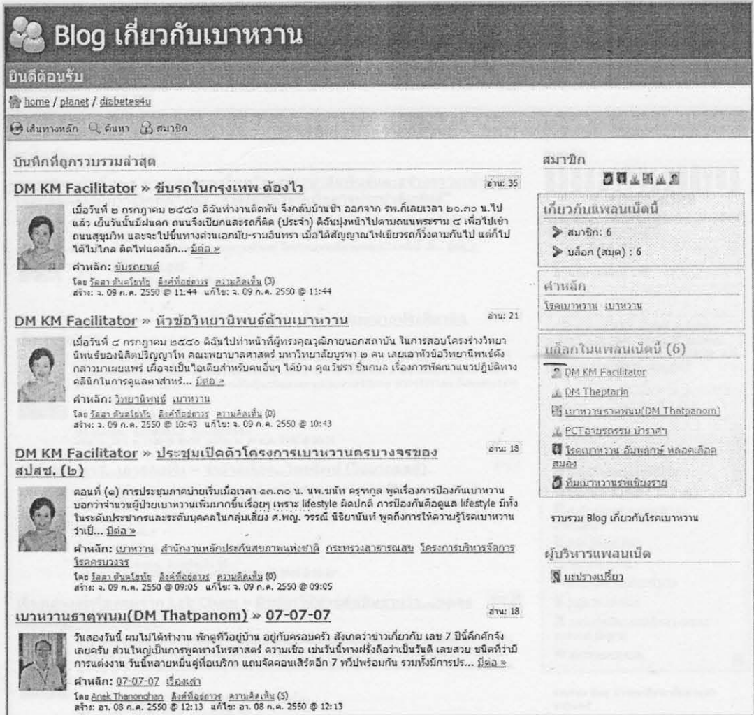
ภาพแพลนเน็ต Blog เกี่ยวกับเบาหวาน

เป็นการสร้างแพลนเน็ตใน Gotoknow.org เพื่อรวบรวมบล็อกที่เกี่ยวข้องกับเรื่องเบาหวาน โดยมี บล็อกของผู้ที่มีความเกี่ยวข้องกับเบาหวาน เช่น พยาบาล ผู้ที่มีประสบการณ์เกี่ยวกับโรคเบาหวาน เป็นต้น ดังภาพ