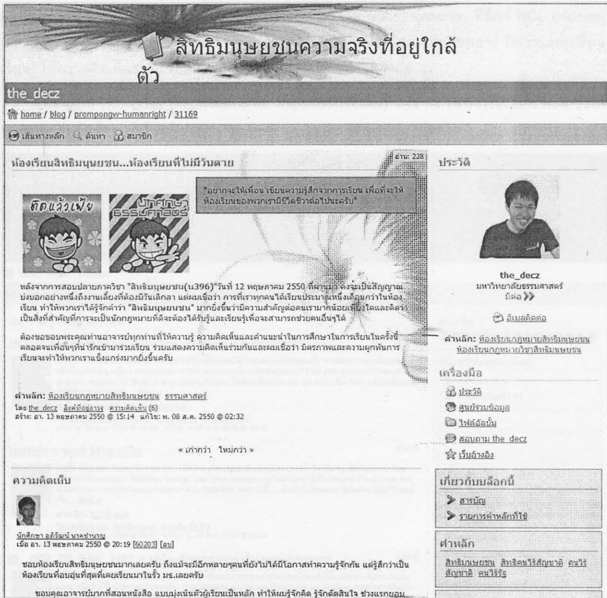
ภาพบันทึก “ห้องเรียนสิทธิมนุษยชน...ห้องเรียนที่ไม่มีวันตาย”

บันทึก “ห้องเรียนสิทธิมนุษยชน...ห้องเรียนที่ไม่มีวันตาย” ( http://learners.in.th/blog/prompongw-HumanRight/31169 ) เกี่ยวกับความรู้สึกที่ได้ลงเรียนวิชานี้ และห้องเรียนสิทธิมนุษยชน จะยังคงมีอยู่ต่อไปถึงแม้จะเรียนจบไปแล้วก็ตาม นั่นคือ Learners.in.th ดังภาพ