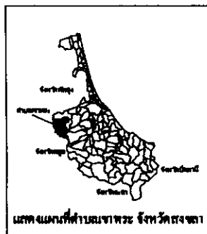
แผนที่แสดงพื้นที่สวน ไม้ผล ตำบลเขาพระ อำเภอรัตภูมิ จังหวัดสงขลา