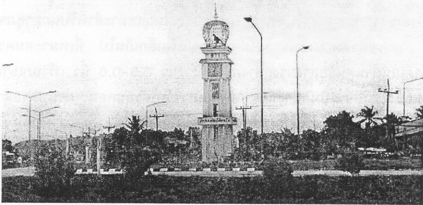
รูปที่ 2.20 สัญลักษณ์รูปนกเขาชวา บนหอนาฬิกา อำเภอจะนะ แสดงถึงความสำคัญของท่านถิ่นในการเป็นศูนย์กลางการเพาะเลี้ยงนกเขาชวาเลี้ยง