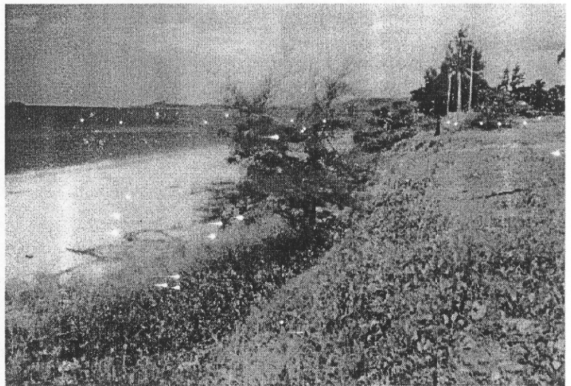
รูป D5.11b ชายหาดด้านทิศใต้