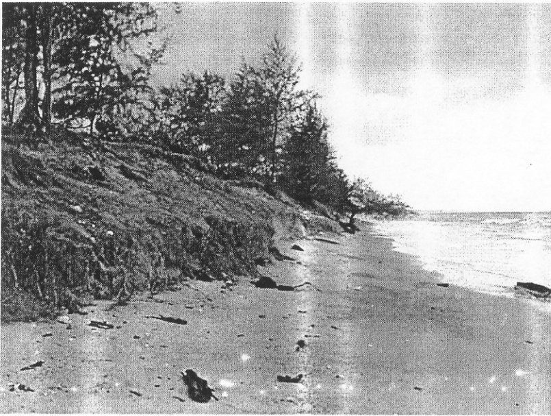
รูป D5.9a ชายหาดด้านทิศเหนือ