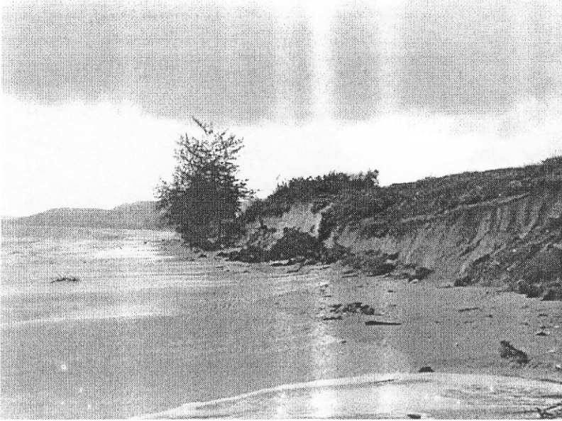
รูป D5.8a ชายหาดด้านทิศเหนือ