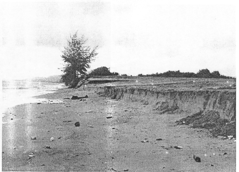
รูป D5.9b ชายหาดด้านทิศใต้