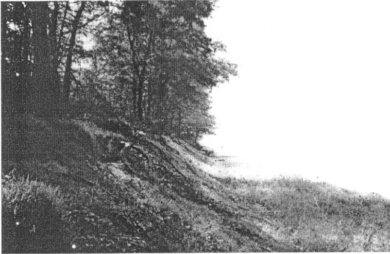
รูป D5.12a ชายหาดด้านทิศเหนือ