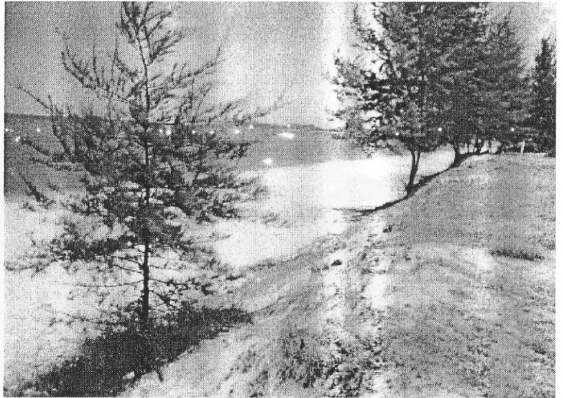
รูป D5.10b ชายหาดด้านทิศใต้