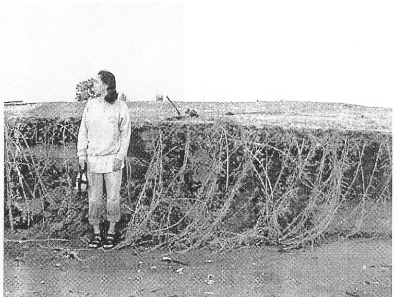
รูป D5.8b ชายหาดด้านทิศใต้

รูป D5.8 ลักษณะภูมิประเทศของชายหาดด้านทิศเหนือ-ใต้ สถานี B2 เดือนธันวาคม 2542