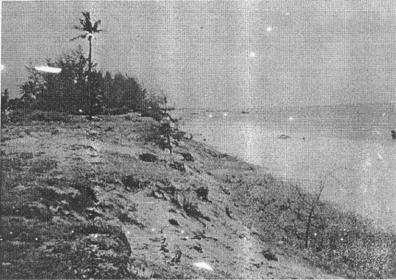
รูป D5.11a ชายหาดด้านทิศเหนือ