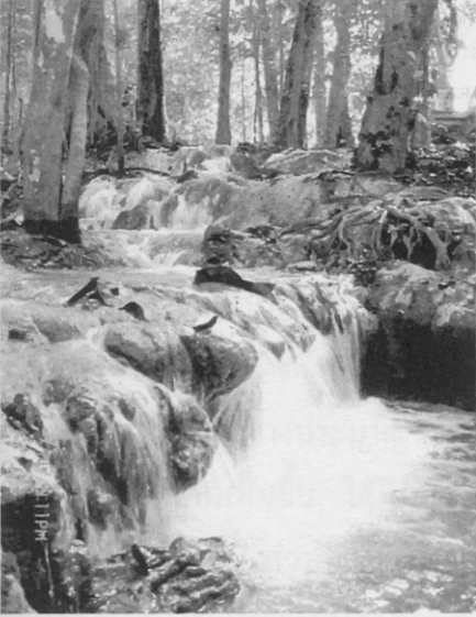
ภาพที่ 1 : น้ำตกบางคุย