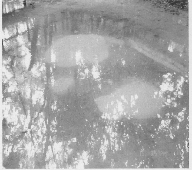
ภาพที่ 2 : บ่อน้ำต้นทรายคูด