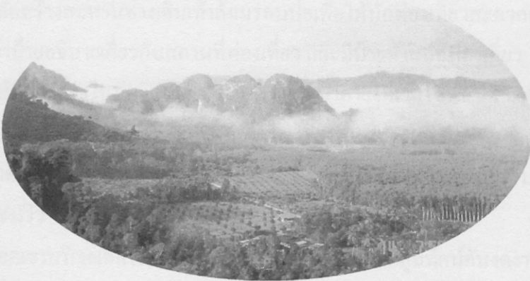
ภาพที่ 3 : ทิวทัศน์จากจุดชมวิว