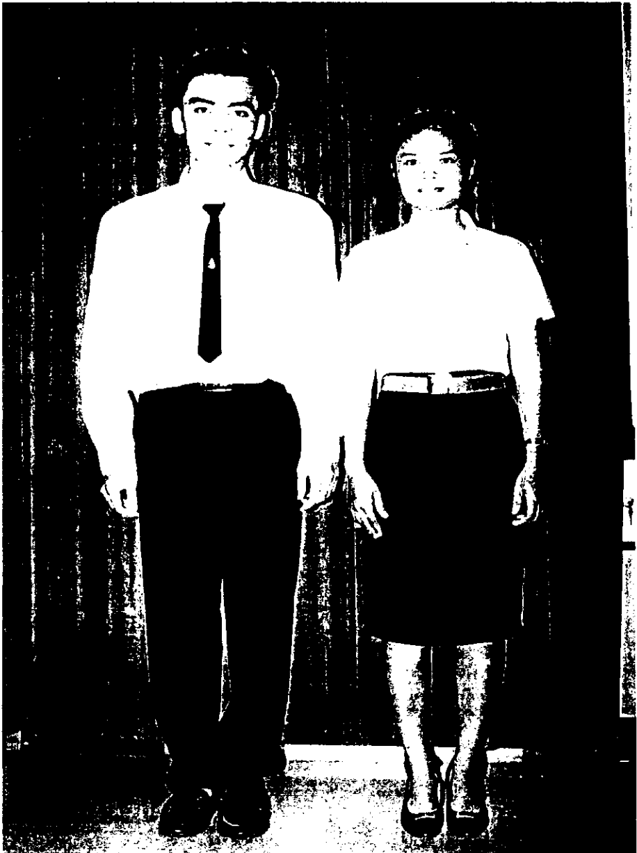
ตัวอย่างภาพการแต่งกายที่เหมาะสม

3. จัดทำบอร์ดภาพการแต่งกายชุดนักศึกษาที่เหมาะสมในหอพักทุกอาคาร และหน้าอาคารสำนักงานหอพักตั้งแต่เดือนพฤษภาคม 2545