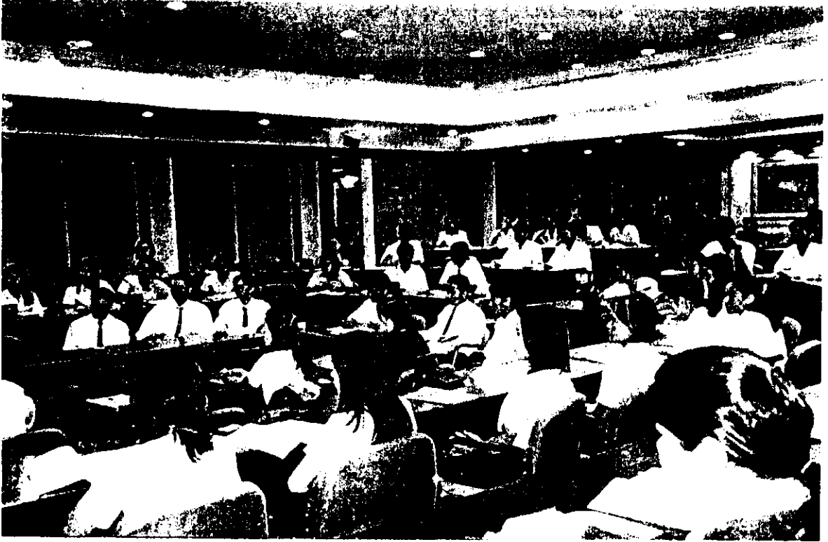
ส่วนหนึ่งของผู้เข้าร่วมสัมมนา