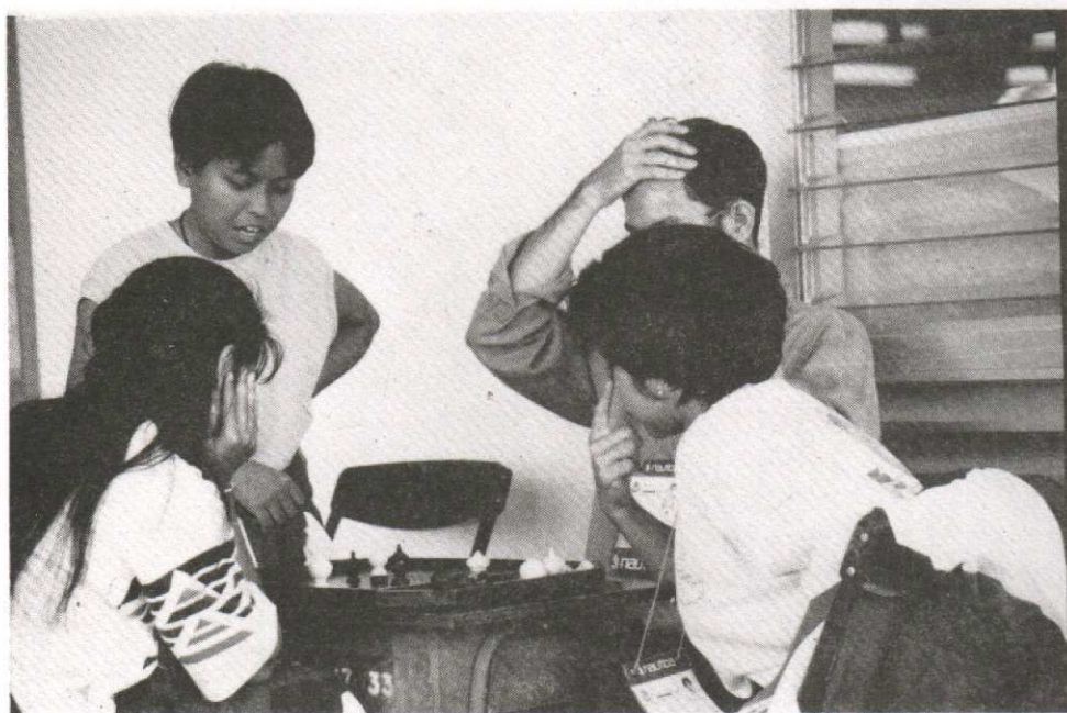
- นักกีฬาหมากกระดาน