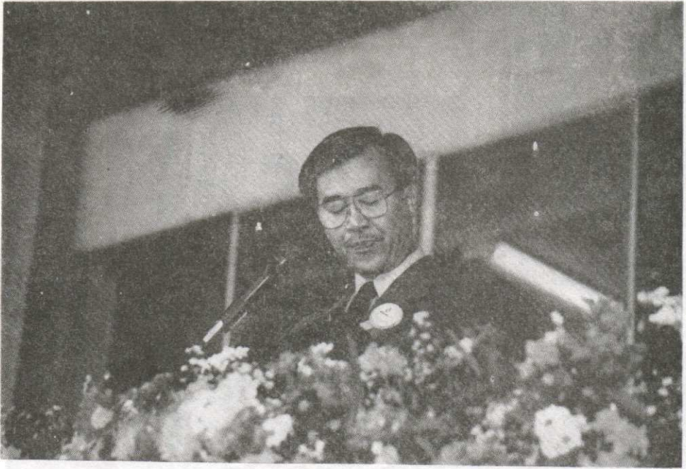
- ๑พณฯ บัญญัติ บรรทัดฐาน รองนายกรัฐมนตรี เป็นประธานเปิดการแข่งขันกีฬามหาวิทยาลัยแห่งประเทศไทย ครั้งที่ 22