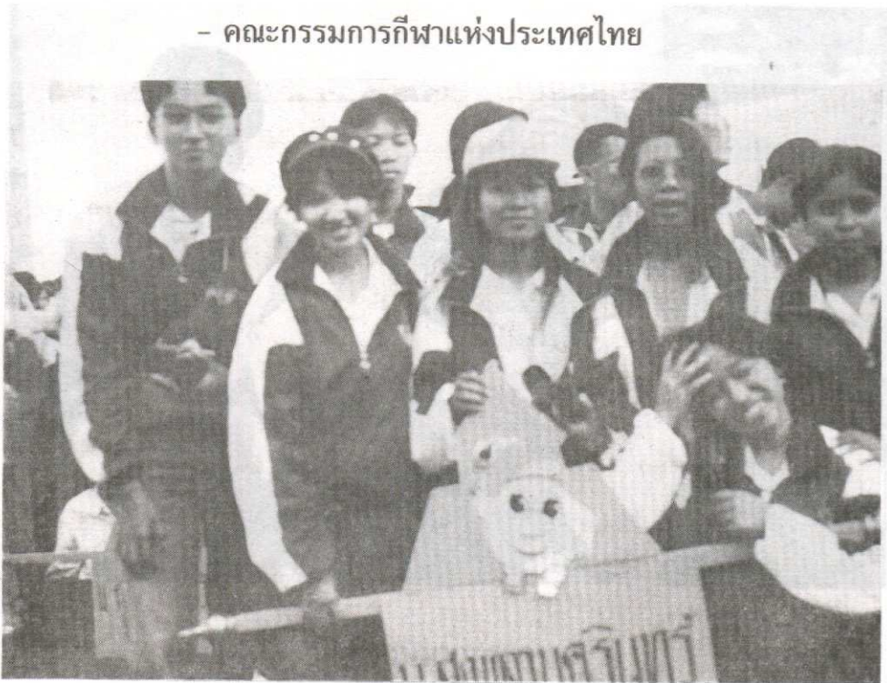
- ขอขอบคุณกลุ่มบริษัท เอส ที เอ ที่ให้การสนับสนุน ชุดวอร์มแก่นักกีฬาและผู้ควบคุม