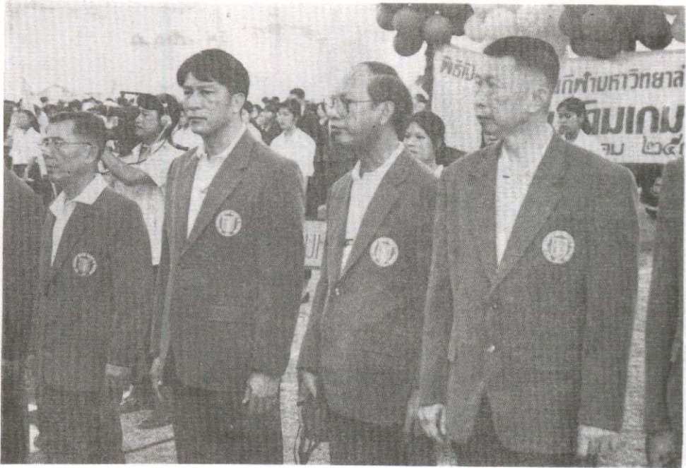
- คณะกรรมการกีฬาแห่งประเทศไทย