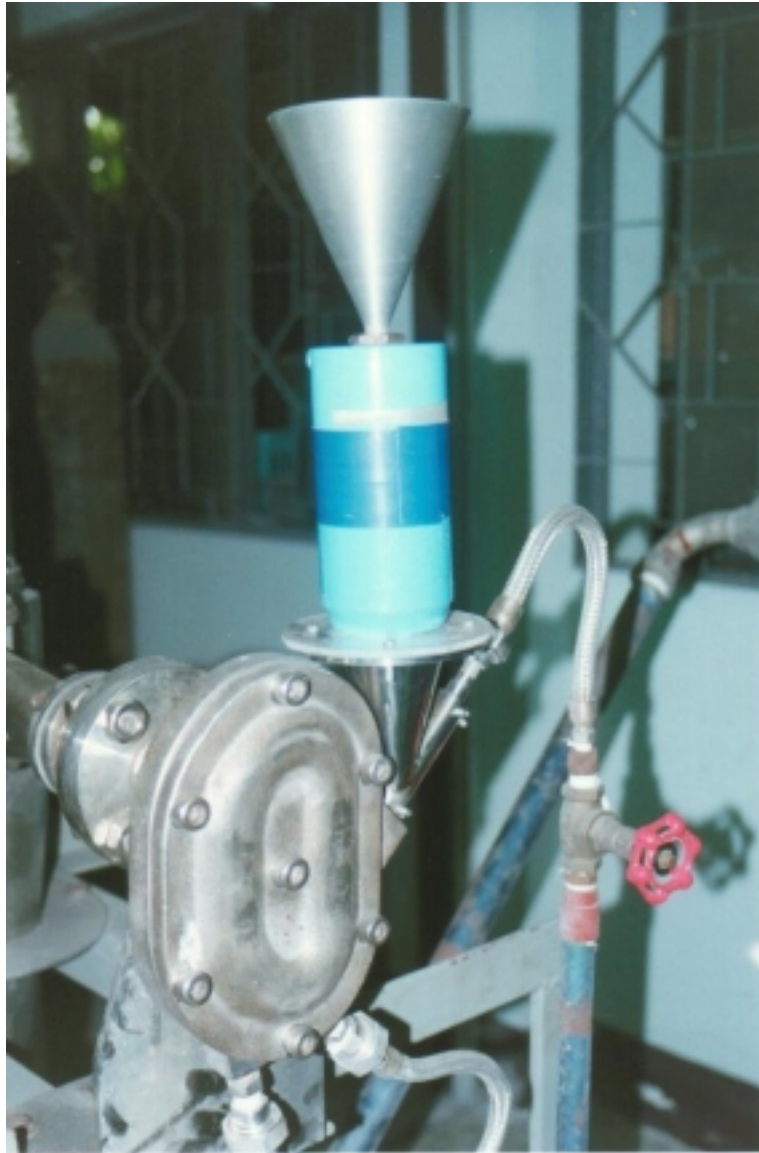
รูปผนวกที่ 2 ส่วนของหม้ออบและช่องสำหรับป้อนวัสดุ (Feed hopper)