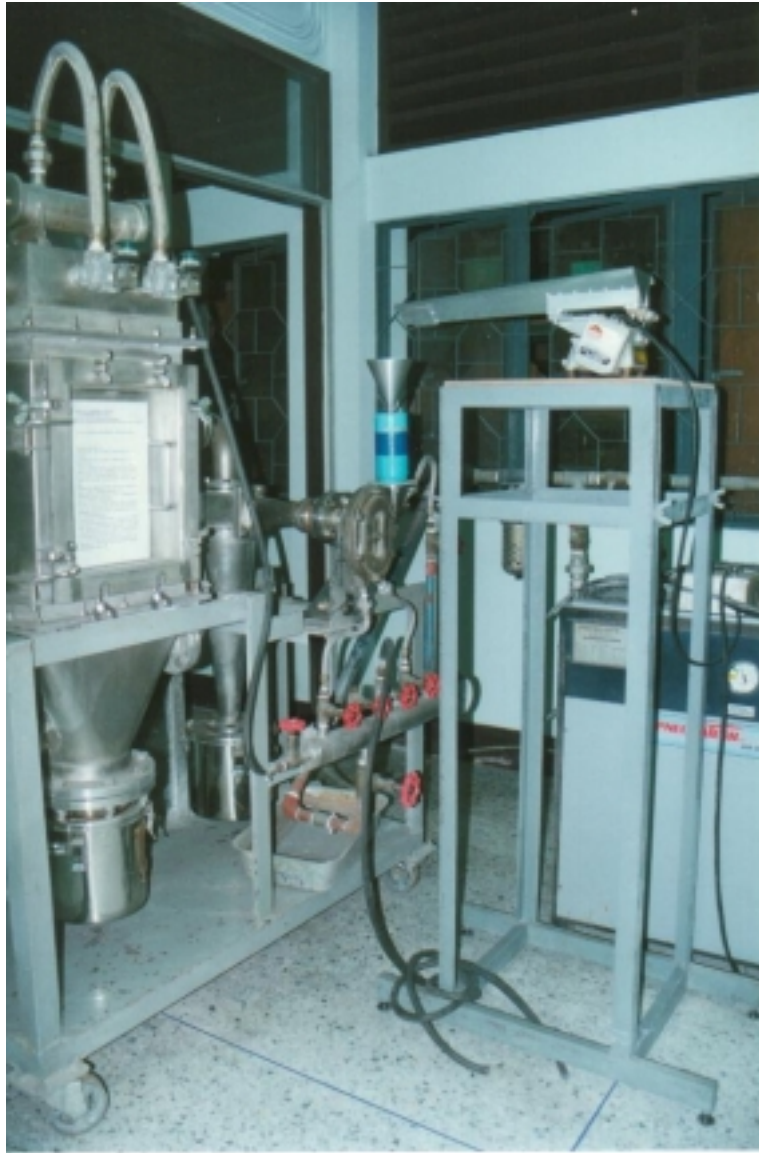
รูปผนวกที่ 1 เครื่องบดละเอียดแบบ Jet mill