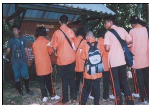
วิทยากรอธิบายแผนที่เส้นทางศึกษาธรรมชาติ