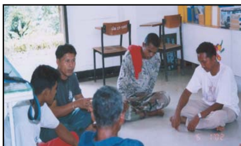
วิทยากรร่วมสรุปการดำเนินงานในการสร้าง การเรียนรู้ในเส้นทางศึกษาระรรมชาติ