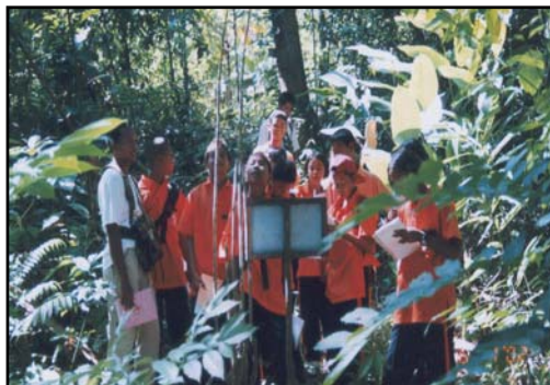
วิทยากรอธิบายสรรพคุณของพืชสมุนไพร