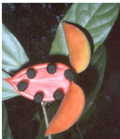
ดอกไม้มีลักษณะแปลกได้พบในเส้น ทางศึกษาธรรมชาติ