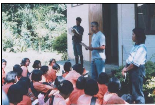
ผู้อำนวยการกล่าวเปิดกิจกรรมการศึกษาใน เส้นทางศึกษาธรรมชาติ