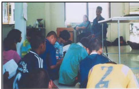
วิทยากรเล่าประวัติความเป็นมา ป่าชุมชนเขาหัวช้าง