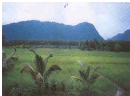
ธรรมชาติป่าชุมชนเขาหัวช้าง