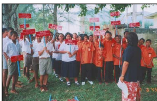
กิจกรรมการปลูกและดูแลต้นไม้ในบริเวณ โรงเรียน