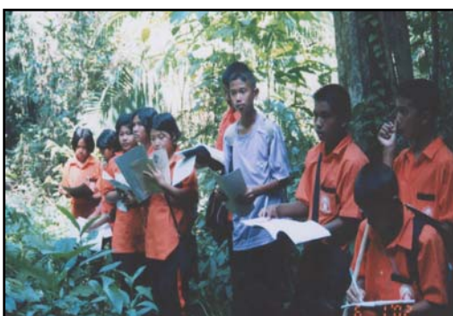
นักเรียนสังเกตสิ่งแวดล้อมรอบตัว