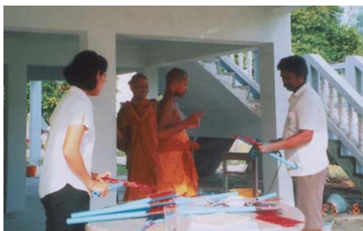
พระสงฆ์คอยช่วยเหลือการจัดทำป่าต้นไม้