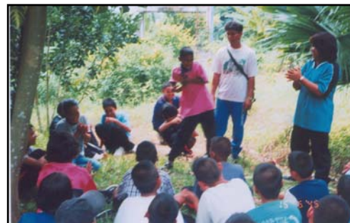
พักผ่อน โดยการเล่นเกม