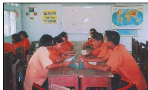
กิจกรรมการระดมความคิดเป็นกลุ่มย่อย