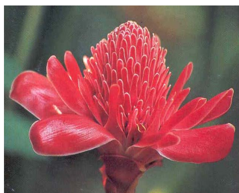
ดอกดาหลากำลังบานะพรั่ง