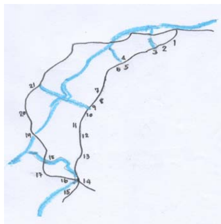
เส้นทางศึกษาธรรมชาติป่าชุมชนเขาหัว ช้าง