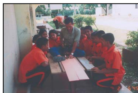
ชาวบ้านได้เข้ามาช่วยเหลือนักเรียน ในการทำป้ายชื่อต้นไม้