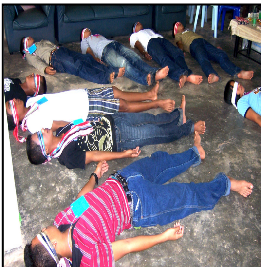
ภาพที่ 6 กิจกรรมการรู้จักตนเองและเข้าใจผู้อื่น