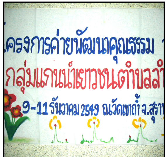
ภาพที่ 4 ความสามารถในการเขียนป้ายผ้ากิจกรรมการเรียนรู้