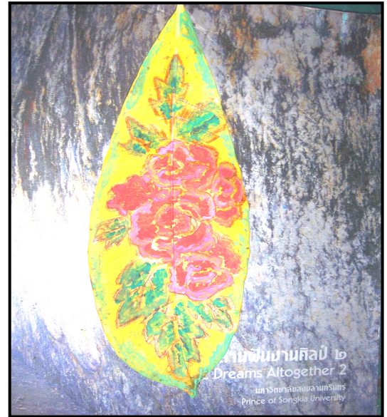
ภาพที่ 3 ความสามารถทางศิลปะ