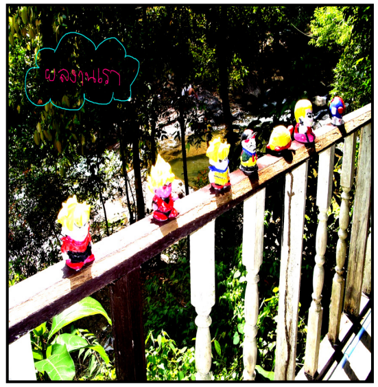
ภาพที่ 5 ผลงานสร้างสรรค์จากปูนพลาสติก