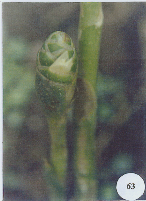
ภาพที่ 63 Zingiber zerumbet (L.) Sm.