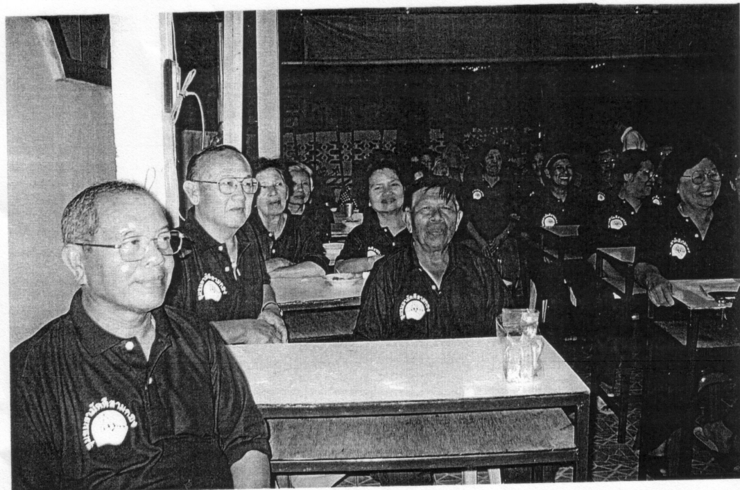
ส่วนหนึ่งของสมาชิกในห้องประชุม