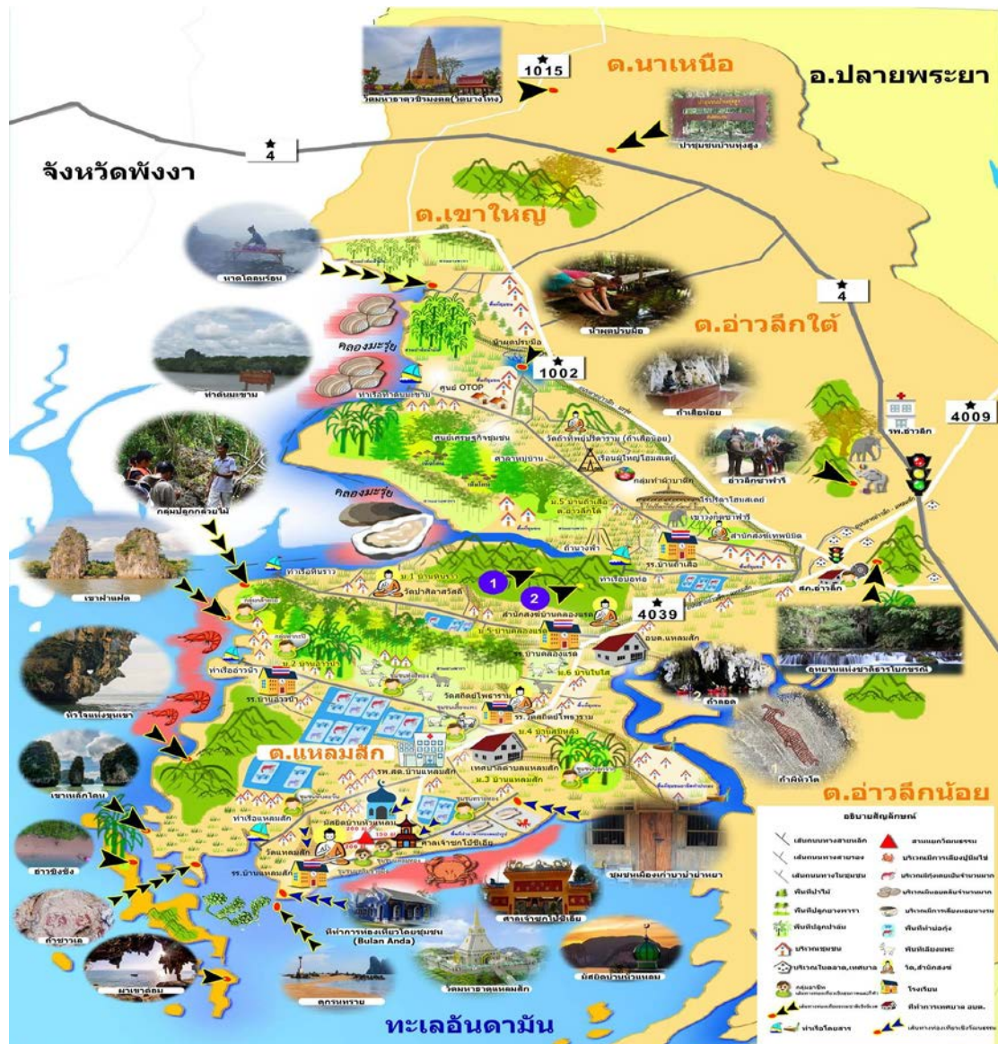
ภาพที่ 3 เส้นทางท่องเที่ยวโดยชุมชนบ้านแหลมลึก และชุมชนท่องเที่ยวบ้านถ้ำเสือ อำเภ่อ่าวลึก จังหวัดกระบี่