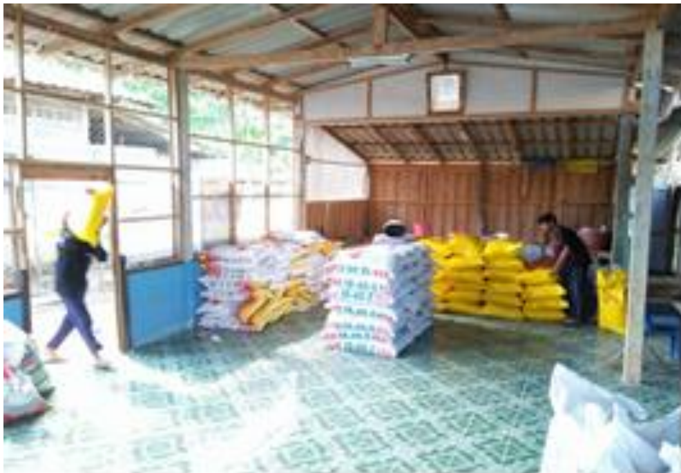
ภาพกิจกรรมการพัฒนาผู้ประกอบการเพื่อสังคม บ้านสามร้อยไร่