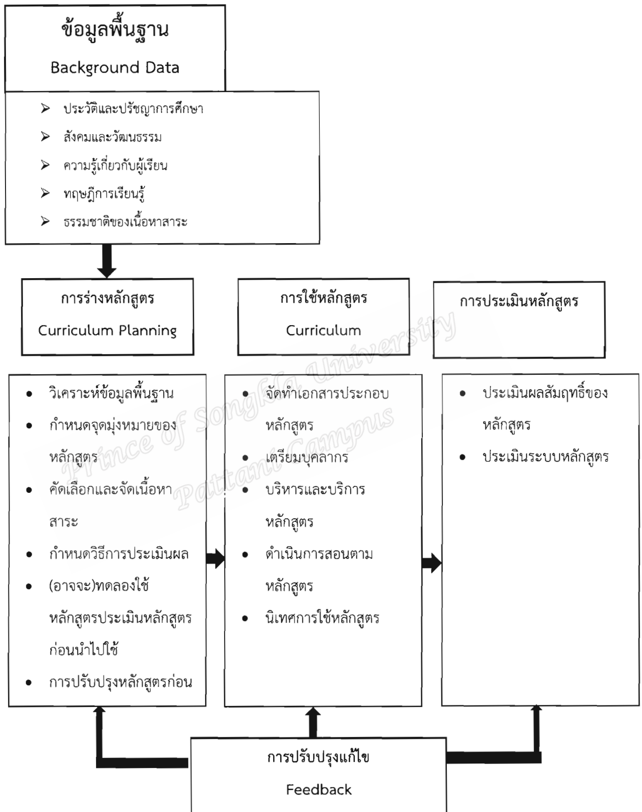
ภาพประกอบ 2 การพัฒนา

หลักสูตร (Curriculum Development) ที่มา: พิมพันธ์ เตชะคุปต์. (2551: 1).