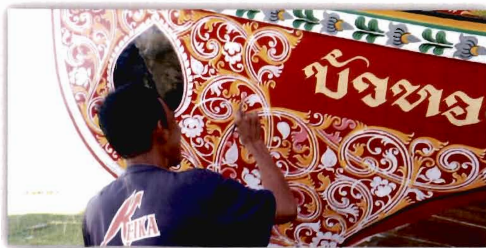
ภาพที่ 4.14 ภาพและลวดลายที่ใช้เขียนลงบนลำเรือของโรมันนุน เจ๊ะเต๊ะ

สอดคล้องกับผู้ให้ข้อมูลท่านอื่นที่ให้ความเห็นว่า