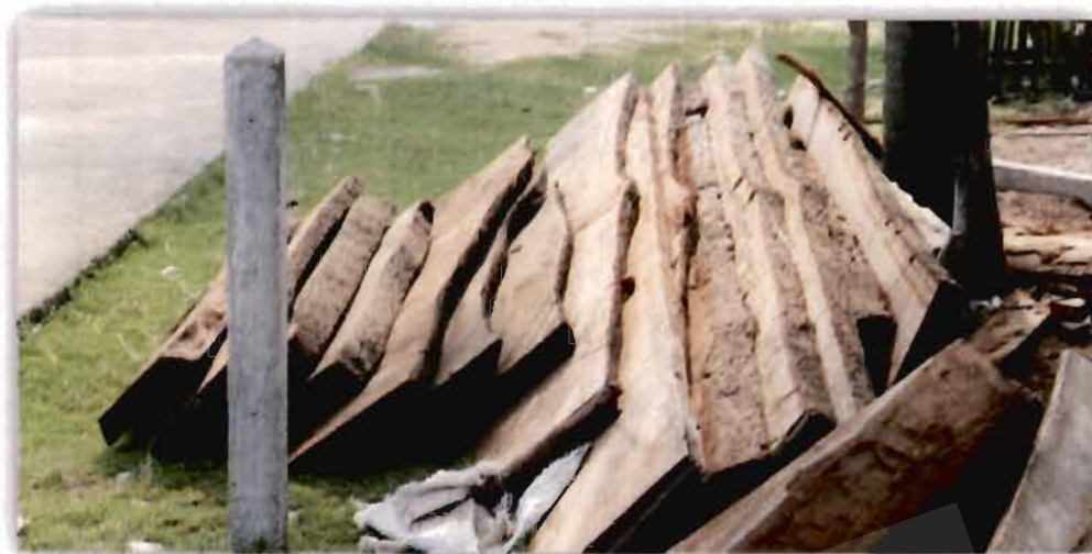
ภาพที่ 4.4 ไม้ตะเคียนที่ใช้ในการต่อเรือกอลและของอาหะมัด สาและ

สอดคล้องกับผู้ให้ข้อมูลท่านอื่นที่ให้ความเห็นว่า