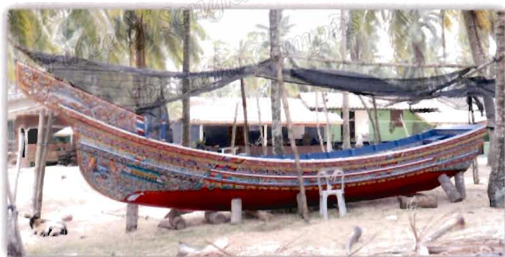
ภาพที่ 2.9 เรือกอลและแบบทำยัด (2561)

พิจารณาจากลักษณะของหัวเรือกอลและ อาจกล่าวได้ว่าเรือกอลและมี 2 ประเภทด้วยกัน คือ แบบหัวสั้นและแบบหัวยาว แต่ถ้าพิจารณาจากความเป็นเรือประมง เรือกอลและที่เป็นเรือประมงมี 5 ประเภท ดังนี้ (ถกิงพล ขำยัง, 2556, น. 12)