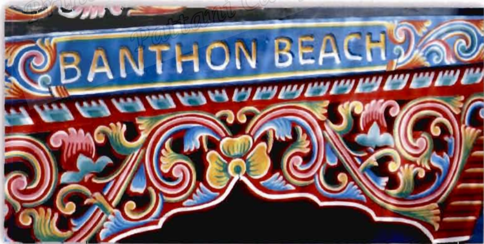
ภาพที่ 2.7 สีและลวดลายของเรือกอและ (2561)

การใช้สีโดยทั่วไปช่างทาสีเรือกอและ จะนิยมใช้สีน้ำพลาสติก และจะใช้น้ำมันยางและชันยาเรือลงรองพื้นก่อน เพื่อป้องกันและรักษาเนื้อไม้ สีที่นิยมกันมากคือ สีดำ สีเขียว สีแดง เป็นสีพื้น นอกจากนี้มีสีทอง เหลือง เทา และขาวเป็นสีที่ให้ลวดลาย ลวดลายอาจมีอิทธิพลของความเชื่อ ค่านิยม และสภาพแวดล้อมมีผลต่อการสร้างสรรค์ลวดลายเหล่านี้ (สมใจ ศรีนวล, 2547, น. 49)