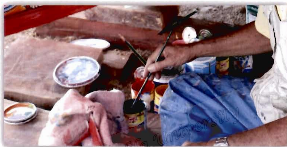
ภาพที่ 4.10 สีและพู่กันที่ใช้เขียนลายเรือกอและของบือราเฮง มะมิง

จากสัมภาษณ์กลุ่มผู้ให้ข้อมูลประเด็นข้างต้น ในพื้นที่ตำบลปะเสยะวอ จังหวัดปัตตานี ตำบลศาลาใหม่ จังหวัดนราธิวาส และตำบลโคกเคียน จังหวัดนราธิวาส ซึ่งบือราเฮง มะมิง (23 ตุลาคม 2562) ผู้ให้ข้อมูลกล่าวไว้ ดังนี้