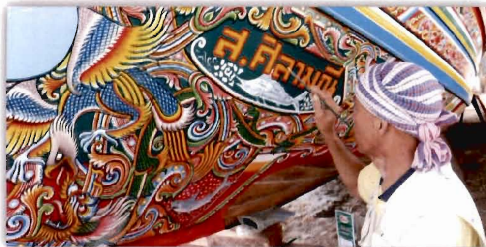
ภาพที่ 4.13 ภาพและลวดลายที่ใช้เขียนลงบนลำเรือของบ็อราเฮง มะมิง

“...เมื่อก่อนนิยมเขียนลายไทย ตามวรรณคดีไทยหนุมาน นางเงือก เดี่ยวนี้นิยมวาดลวดลายมลายูที่เห็นได้ตามมัสยิด ส่วนของสัตว์ก็เขียนได้ แต่เดี๋ยวนี้เขาไม่นิยมกันแล้ว แต่ก็มีอยู่บ้าง เช่นนก ปลา สัตว์ที่อยู่ในท้องทะเลเป็นส่วนใหญ่ จะเขียนดอกไม้ ใบไม้ เช่น ดอกกุหลาบ ดอกชบา ส่วนใบไม้ก็ออกแบบเองไม่ได้กำหนดว่าต้องวาดใบอะไร ตัวหนังสือแล้วแต่เจ้าของเรือสั่งมาว่าให้เขียนอะไร ส่วนใหญ่แล้วจะเขียนชื่อของเจ้าของเรือ กับชื่อเรือ...”