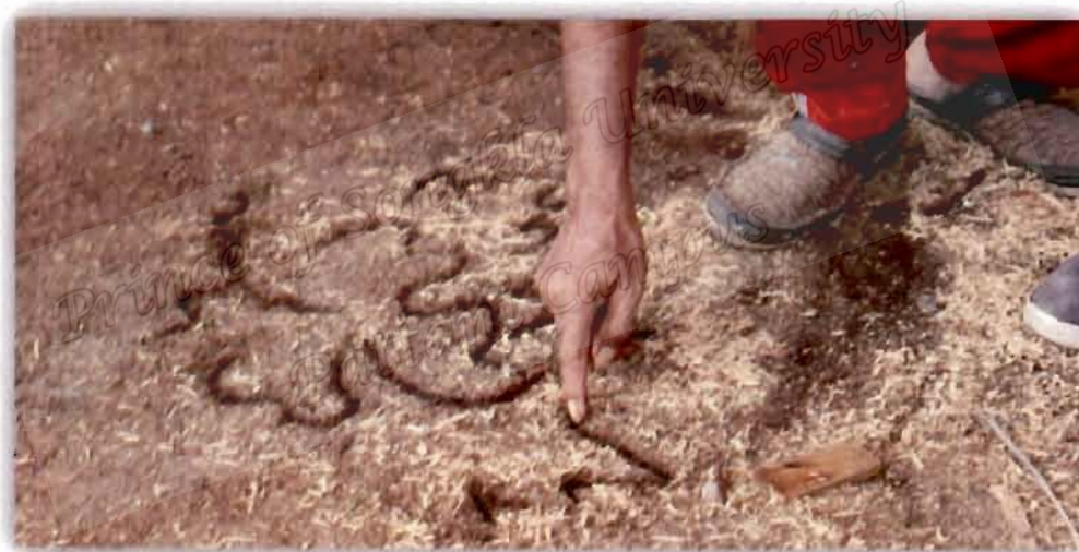
ภาพที่ 4.23 สาทิตการเขียนลายเบื้องต้นของปือราเฮง มะมิง

สอดคล้องกับผู้ให้ข้อมูลท่านอื่นที่ให้ความเห็นว่า