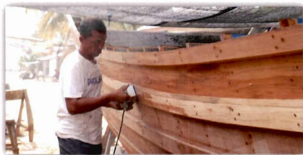
ภาพที่ 4.22 การต่อเรือของอาหะมัด สาและ

สอดคล้องกับผู้ให้ข้อมูลท่านอื่นที่ให้ความเห็นว่า