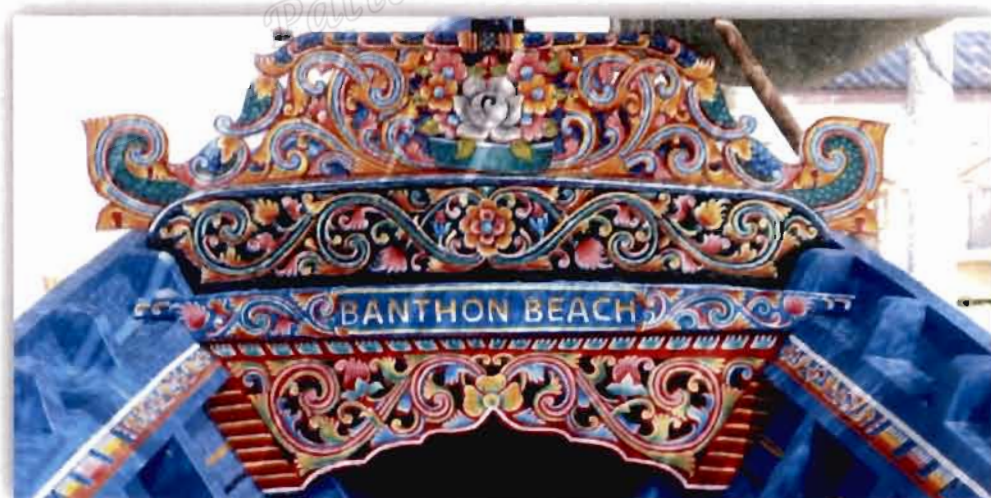
ภาพที่ 2.3 จาปั้งของเรือกอและ (2561)

ด้านหัวเรือจากแกะสลักไม้โค้งงอน ยื่นออกนอกหัวเรือเป็นรูปแบบเรือเถา หรือลวดลาย พันธุ์ไม้ โดยนำเอาส่วนต่าง ๆ ของพันธุ์ไม้มาประกอบต่อเนื่องให้เห็นกลมกลืน เพื่อให้มีลักษณะ ลวดลายที่ออกมามีความนุ่มนวล มีน้ำหนัก ลักษณะลวดลายประเภทที่เป็นที่นิยมของชาวไทยมุสลิม มีใช้เพียงแค่ประดับไว้ที่หัวท้ายเรือกอและเท่านั้น แต่ยังปรากฏประดับเป็นศิลปะเกี่ยวเนื่องกับอาคาร บ้านเรือน มัสยิดอีกด้วย (สมใจ ศรีนวล, 2547, น. 48)