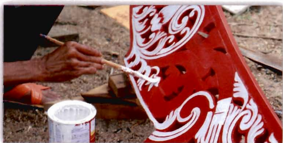
ภาพที่ 4.11 สีและพู่กันที่ใช้เขียนลายเรือกอและของรอมัยนุน เจะเต๊ะ

สอดคล้องกับผู้ให้ข้อมูลท่านอื่นที่ให้ความเห็นว่า