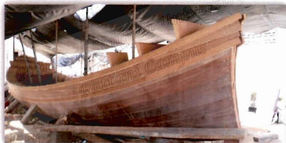
ภาพที่ 4.1 ขนาดเรือกอลและของ เจ็ม อูมา

จากสัมภาษณ์กลุ่มผู้ให้ข้อมูลประเด็นข้างต้น ในพื้นที่ตำบลปะเสยะวอ จังหวัดปัตตานี ตำบลศาลาใหม่ จังหวัดนราธิวาส และตำบลโคกเคียน จังหวัดนราธิวาส ซึ่งเจ็ม อูมา (22 ตุลาคม 2562) ผู้ให้ข้อมูลกล่าวไว้ ดังนี้