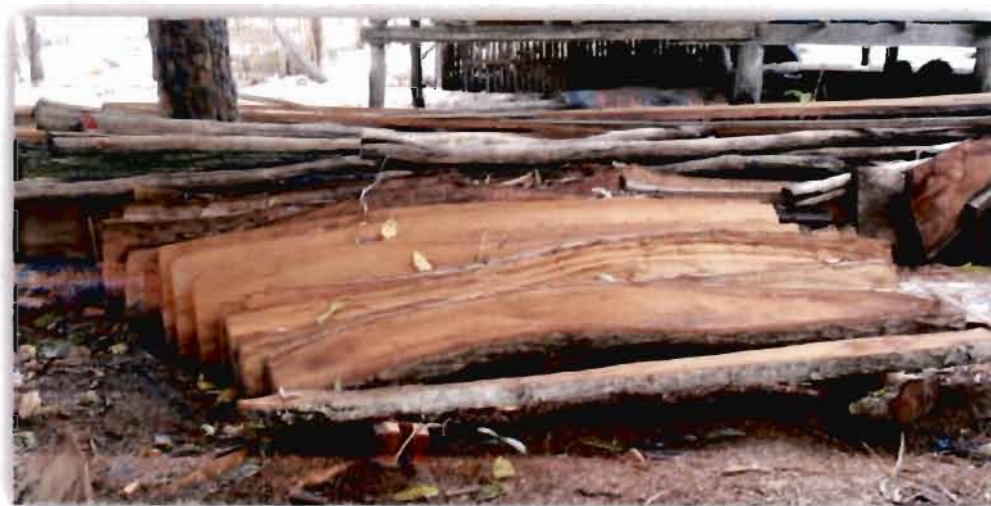
ภาพที่ 4.5 ไม้ตะเคียนที่ใช้ในการต่อเรือกอและของสมาแอ ดิงเงาะ

สอดคล้องกับผู้ให้ข้อมูลท่านอื่นที่ให้ความเห็นว่า