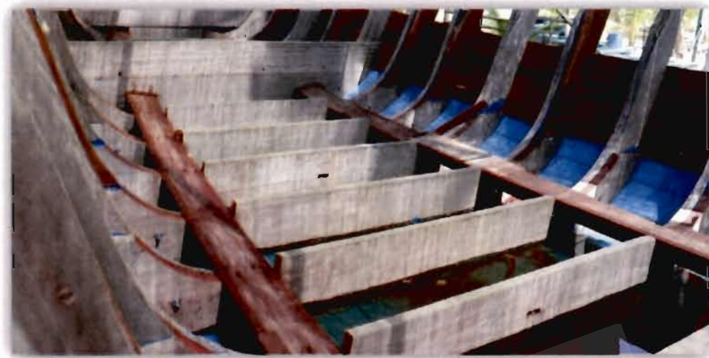
ภาพที่ 4.9 การวางจุดศูนย์ถ่วงของเรือกอกและของอาหะมัด สาและ

สอดคล้องกับผู้ให้ข้อมูลท่านอื่นที่ให้ความเห็นว่า