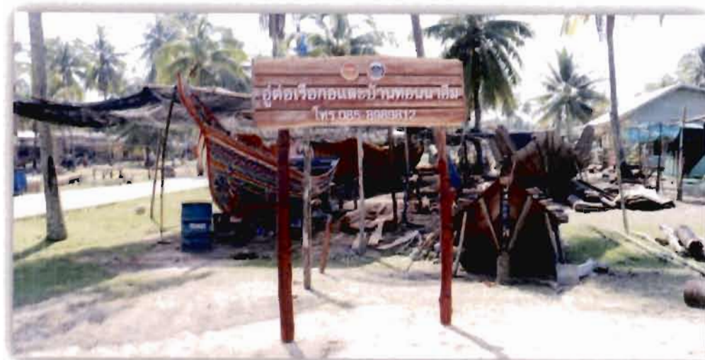
ภาพที่ 2.11 คู่มือเรือและเขียนลายเรือกอบและของชุมชนบ้านทอน (2561)