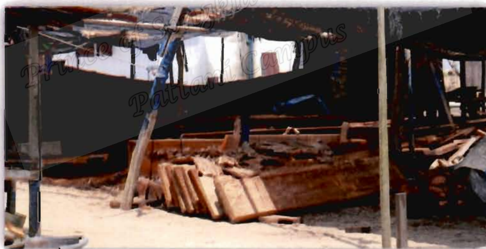
ภาพที่ 4.3 ไม้ตะเคียนที่ใช้ในการต่อเรือกอลและของเจ็ม อูมา

จากสัมภาษณ์กลุ่มผู้ให้ข้อมูลประเด็นข้างต้น ในพื้นที่ตำบลปะเสยะวอ จังหวัดปัตตานี ตำบลศาลาใหม่ จังหวัดนราธิวาส และตำบลโคกเคียน จังหวัดนราธิวาส ซึ่งเจ็ม อูมา (22 ตุลาคม 2562) ผู้ให้ข้อมูลกล่าวไว้ ดังนี้