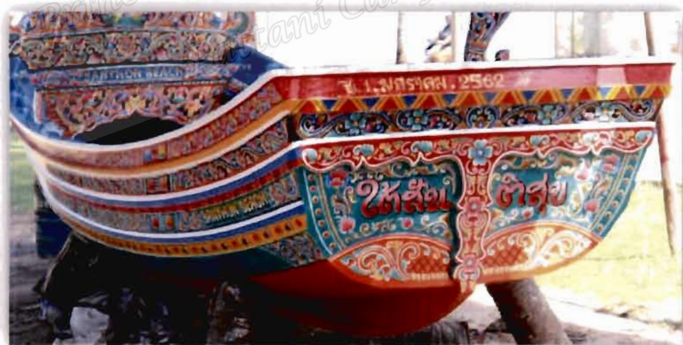
ภาพที่ 2.5 ส่วนท้ายของเรือกอและท้ายตัด (2561)