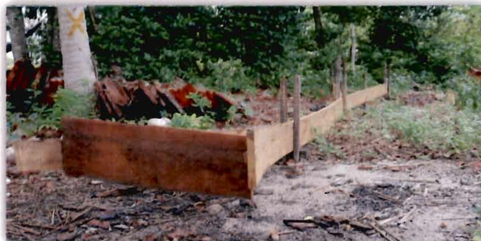
ภาพที่ 4.6 การเตรียมไม้สำหรับการต่อเรือกอกและของสมาแอ ดิงเงาะ

“...ก่อนที่จะต่อเรือ จะเอาไม้ไปผิงไฟ เพราะจะตัดไม้ให้เป็นรูปสี่เหลี่ยม ก่อไฟตรงกลางแล้วก็เอาไม้มาวางตามแนวยาวโดยใช้ความร้อนอ่อน ๆ และตัดไม้ไปเรื่อย ๆ...”