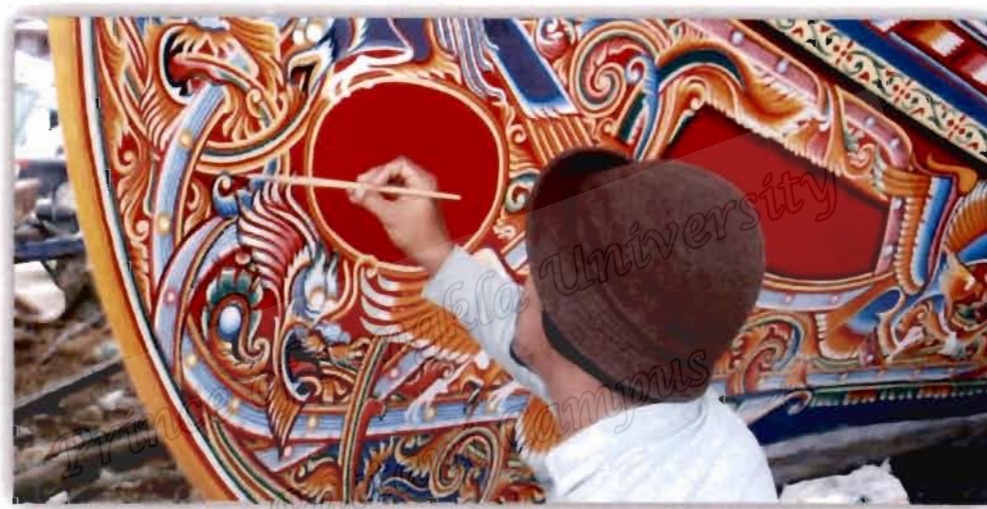
ภาพที่ 4.15 ภาพและลวดลายที่ใช้เขียนลงบนลำเรือของอับดุลเลาะห์ มะดิง

สอดคล้องกับผู้ให้ข้อมูลท่านอื่นที่ให้ความเห็นว่า