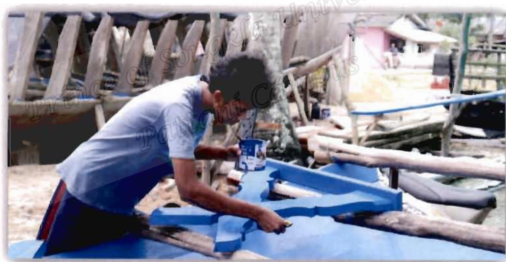
ภาพที่ 4.25 ความรู้ที่ได้รับจากการถ่ายทอดของขอลาหยุดดิน สาและ

จากสัมภาษณ์กลุ่มผู้ให้ข้อมูลประเด็นข้างต้น ในพื้นที่ตำบลศาลาใหม่ จังหวัดนราธิวาส และตำบลโคกเคียน จังหวัดนราธิวาส ซึ่งขอลาหยุดดิน สาและ (25 ตุลาคม 2562) ผู้ให้ข้อมูลกล่าวไว้ ดังนี้