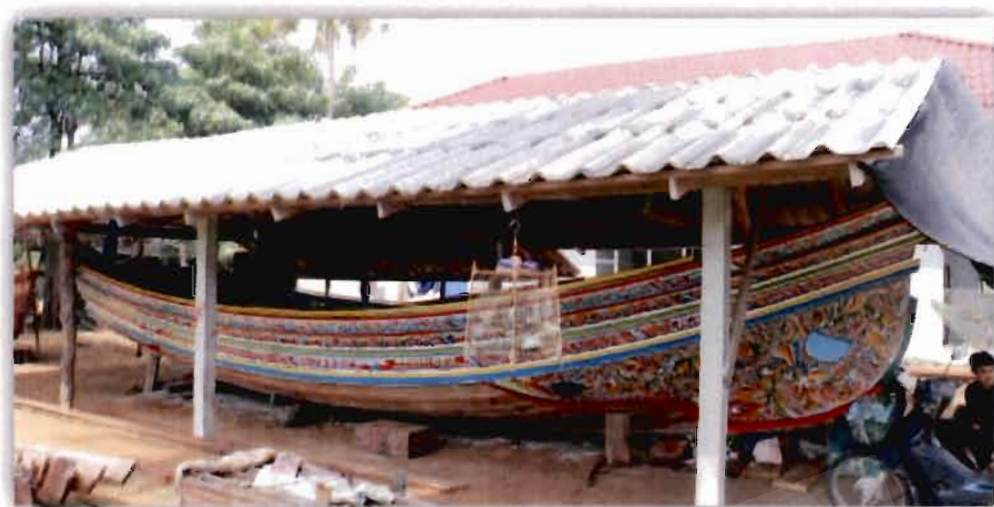
ภาพที่ 2.10 อุ้งต่อเรือและเขียนลายเรือกอและของชุมชนปะเสยะวอ (2561)