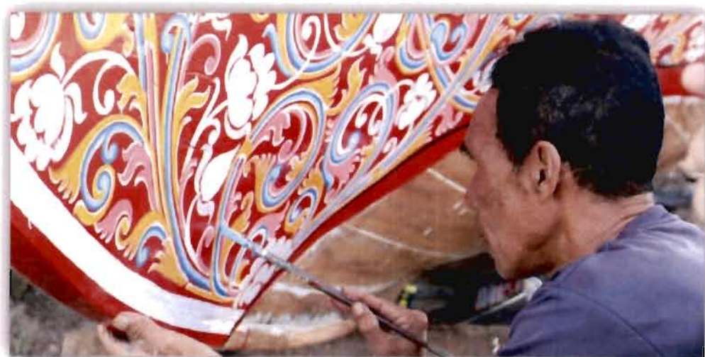
ภาพที่ 4.20 ลวดลายเรือของบือราเฮง มะมิง

สอดคล้องกับผู้ให้ข้อมูลท่านอื่นที่ให้ความเห็นว่า