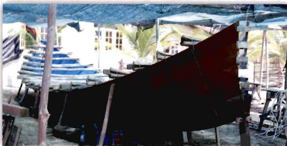
ภาพที่ 4.2 ขนาดเรือกอและของ อาหะมัด สาและ

สอดคล้องกับผู้ให้ข้อมูลท่านอื่นที่ให้ความเห็นว่า