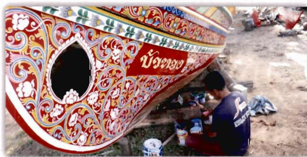
ภาพที่ 4.17 การเขียนลวดลายของรอมัยนุน เจ๊ะเต๊ะ

สอดคล้องกับผู้ให้ข้อมูลท่านอื่นที่ให้ความเห็นว่า