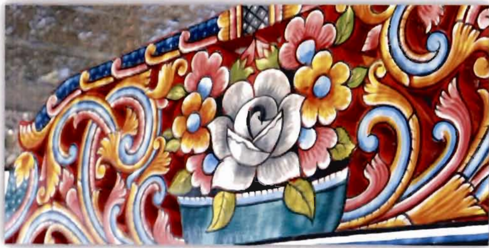
ภาพที่ 2.6 สีและลวดลายของเรือกอและ (2561)

การใช้สีโดยทั่วไปช่างทาสีเรือกอและ จะนิยมใช้สีน้ำพลาสติก และจะใช้น้ำมันยางและชันยาเรือลงรองพื้นก่อน เพื่อป้องกันและรักษาเนื้อไม้ สีที่นิยมกันมากคือ สีดำ สีเขียว สีแดง เป็นสีพื้น นอกจากนี้มีสีทอง เหลือง เทา และขาวเป็นสีที่ให้ลวดลาย ลวดลายอาจมีอิทธิพลของความเชื่อ ค่านิยม และสภาพแวดล้อมมีผลต่อการสร้างสรรค์ลวดลายเหล่านี้ (สมใจ ศรีนวล, 2547, น. 49)