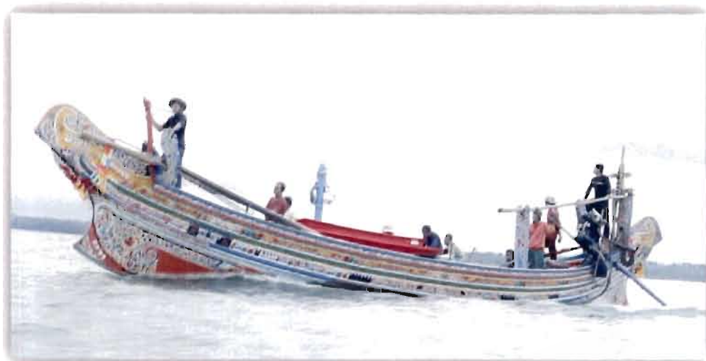
ภาพที่ 2.8 เรือกอลและแบบดั้งเดิม