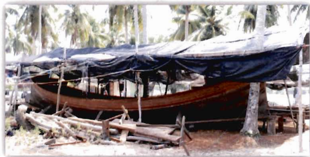
ภาพที่ 2.12 อยู่ต่อเรือและเขียนลายเรือกอลและของชุมชนไพรวัลย์ (2561)