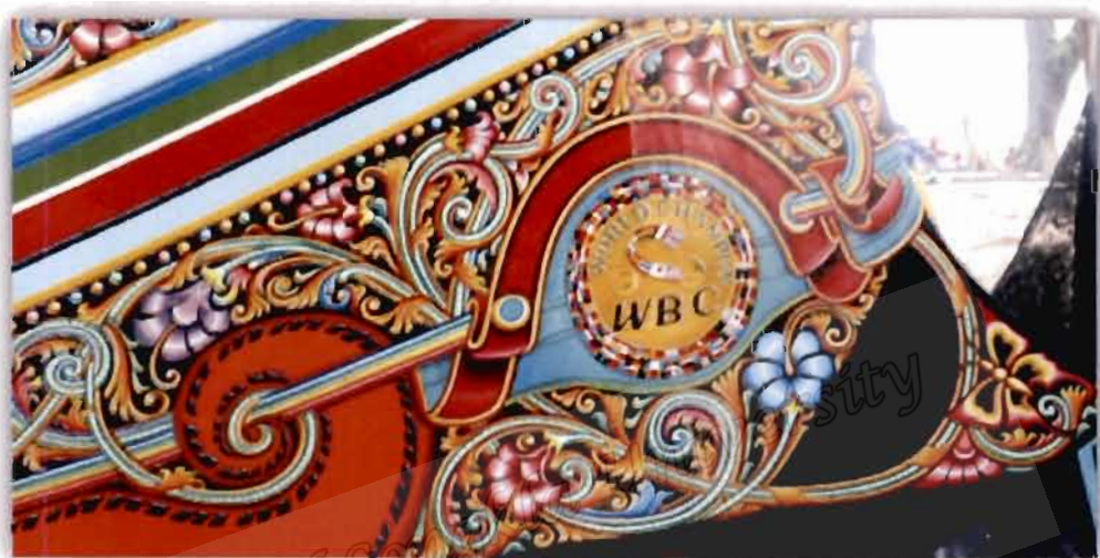
ภาพที่ 4.18 การเขียนลวดลายของอับดุลเลาะห์ มะดิง

สอดคล้องกับผู้ให้ข้อมูลท่านอื่นที่ให้ความเห็นว่า