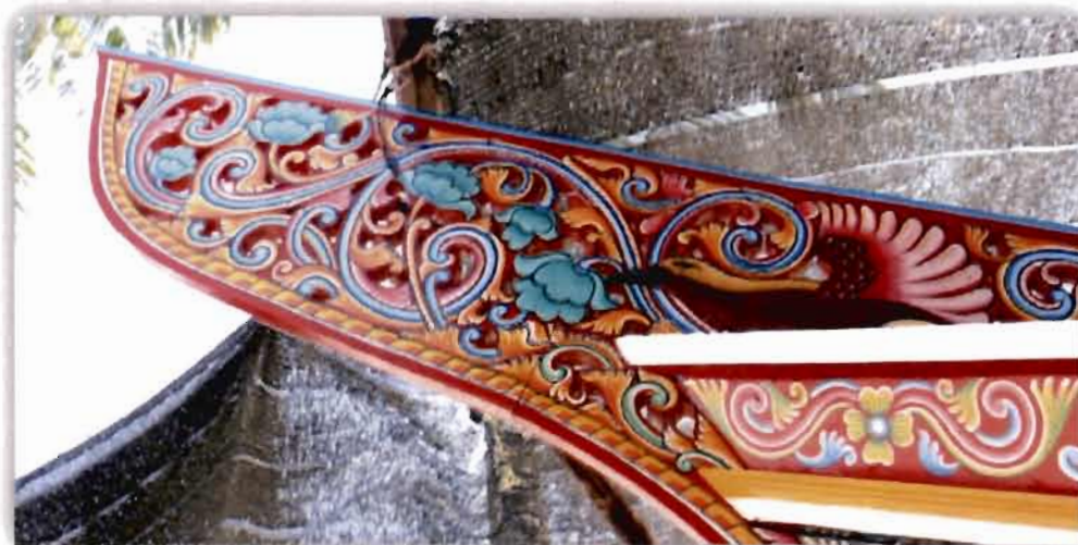
ภาพที่ 2.2 ส่วนหัวของเรือกอและ (2561)

ด้านหัวเรือจากแกะสลักไม้โค้งงอน ยื่นออกนอกหัวเรือเป็นรูปแบบเรือเถา หรือลวดลาย พันธุ์ไม้ โดยนำเอาส่วนต่าง ๆ ของพันธุ์ไม้มาประกอบต่อเนื่องให้เห็นกลมกลืน เพื่อให้มีลักษณะ ลวดลายที่ออกมามีความนุ่มนวล มีน้ำหนัก ลักษณะลวดลายประเภทที่เป็นที่นิยมของชาวไทยมุสลิม มีใช้เพียงแค่ประดับไว้ที่หัวท้ายเรือกอและเท่านั้น แต่ยังปรากฏประดับเป็นศิลปะเกี่ยวเนื่องกับอาคาร บ้านเรือน มัสยิดอีกด้วย (สมใจ ศรีนวล, 2547, น. 48)