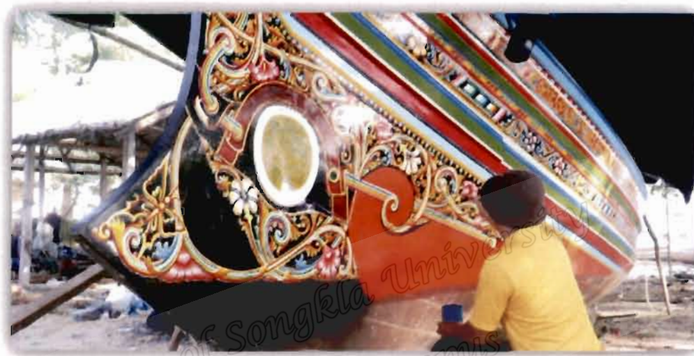
ภาพที่ 4.21 สวดลายเรือของอับดุลเลาะห์ มะดิง

สอดคล้องกับผู้ให้ข้อมูลท่านอื่นที่ให้ความเห็นว่า