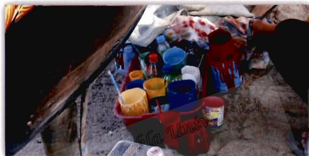
ภาพที่ 4.12 สีและพู่กันที่ใช้เขียนลายเรือกอและของอับดุลเลาะห์ มะดิง

สอดคล้องกับผู้ให้ข้อมูลท่านอื่นที่ให้ความเห็นว่า