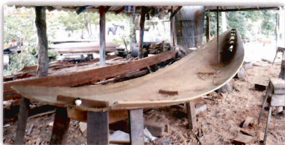
ภาพที่ 4.7 การวางจุดศูนย์ถ่วงของเรือกอกและของสมาแอ ดิงเงาะ

“...จะรู้จากไม่ว่าไม้ด้านข้างหนากี่นิ้วข้างนี้ 5 นิ้วข้างนี้ 5