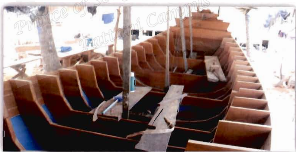
ภาพที่ 4.8 การวางจุดศูนย์ถ่วงของเรือกอกและของเจ็มู อูมา

สอดคล้องกับผู้ให้ข้อมูลท่านอื่นที่ให้ความเห็นว่า