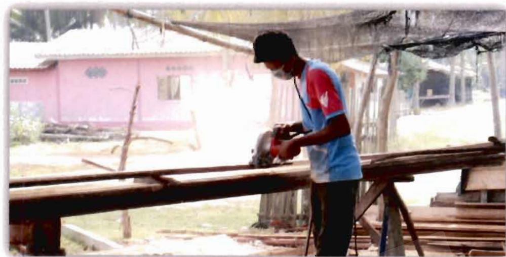
ภาพที่ 4.26 ความรู้ที่ได้รับจากการถ่ายทอดของซอลาสูดติน สาและ

สอดคล้องกับผู้ให้ข้อมูลท่านอื่นที่ให้ความเห็นว่า