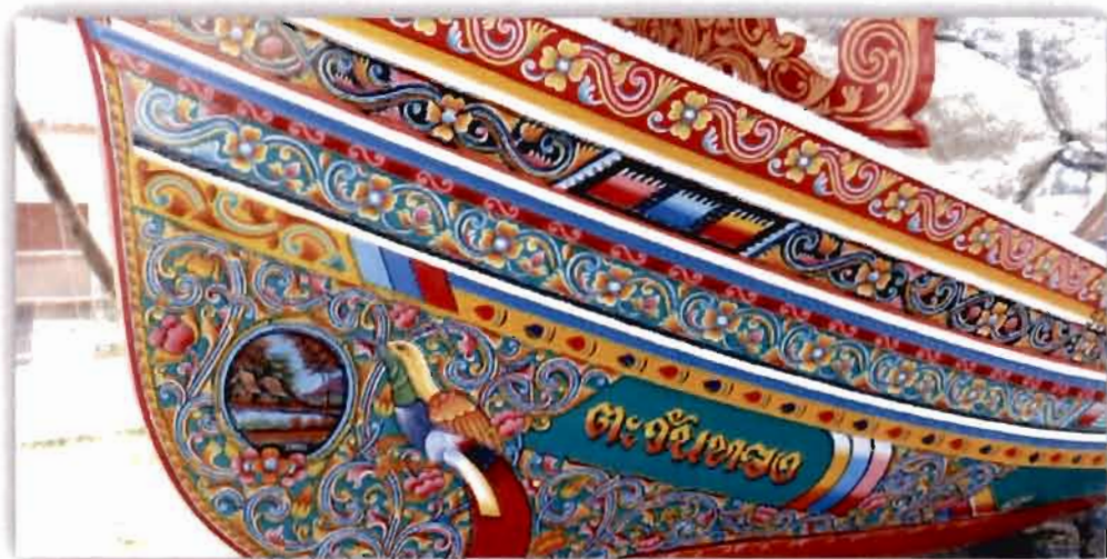
ภาพที่ 2.4 ลวดลายด้านข้างของเรือกอและ (2561)

ด้านข้างทั้งสองของหัวเรือ อาจจะมีลวดลายไทยผสมอิสลาม และลายจีน เรียงลำดับเป็นชั้นกันด้วยเส้นสีเทา ขาวเหลือง แดงเหลือง เทาแดง ไม่เหมือนกันแล้วแต่อารมณศิลป์นลวดลายที่นิยมกัน ลายไทยได้แก่ ลายกระจัง ลายเครือเถา ลายประจายาม ลายอิสลามได้แก่ ลายพรรณไม้ ลายอักษรประดิษฐ์ ลายจีนได้แก่ ลายมังกร นกการเวก นกกระเรียน (สมใจ ศรีนวล, 2547, น. 49)