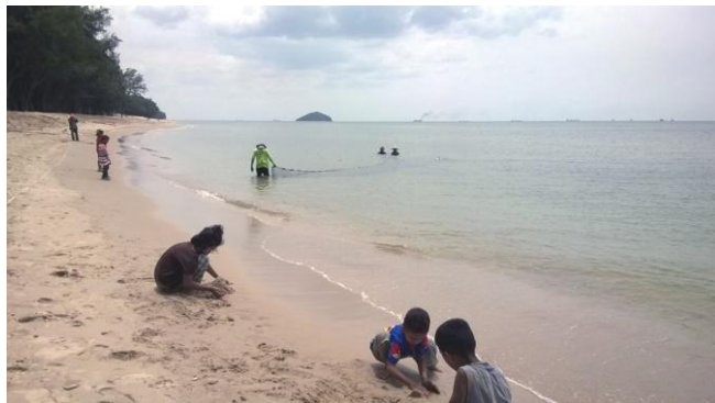
ใช้อวนทับตลิ่งเล็กในการสำรวจแมงกะพรุนไฟ