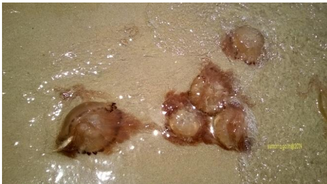
แมงกะพรุนไฟ Chrysaora chinensis