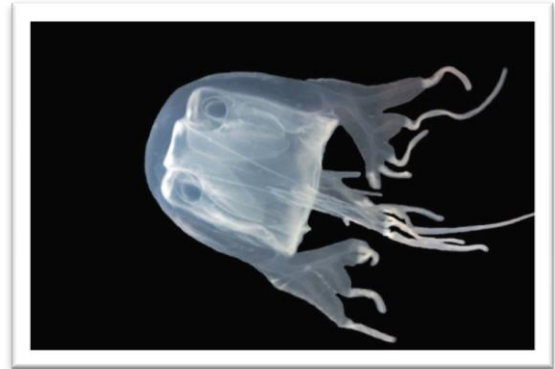
แมงกะพรุนกล่องหนวดหลายเส้น