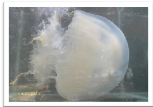
แมงกะพรุนหนัง