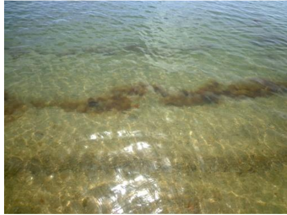
สภาพชายฝั่งบริเวณหาดชลาทัศน์ที่สำรวจ