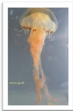
แมงกะพรุนไฟ