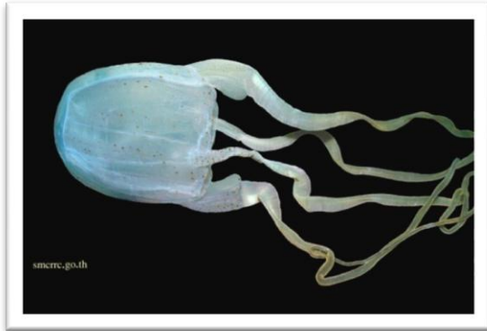
แมงกะพรุนกล่องหนวดเส้นเดียว