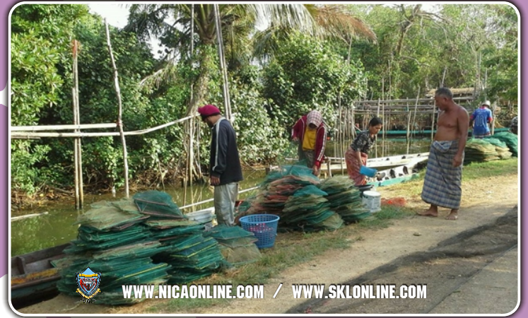
www.nicaonline.com / www.sklonline.com