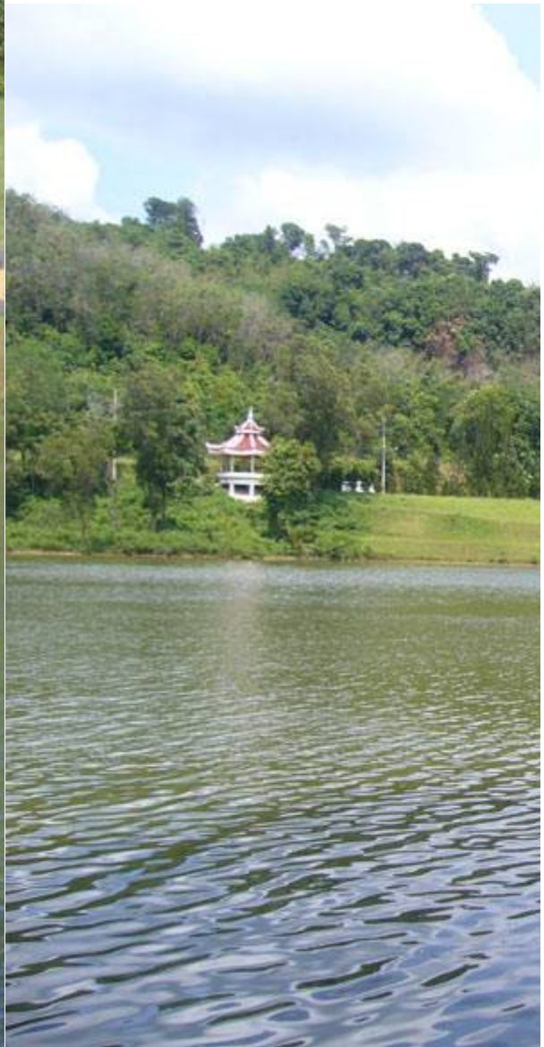
อ่างเก็บน้ำสวนสาธารณะเทศบาลนครหาดใหญ่

แผนที่แสดงที่ตั้งโครงการ/แผนที่ 1 : 50,000