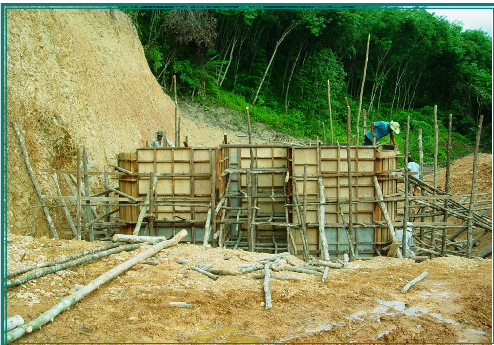
กำลังก่อสร้าง