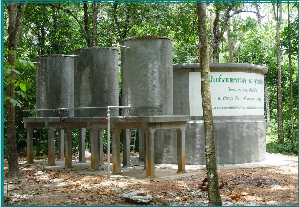
ก่อสร้างแล้วเสร็จ