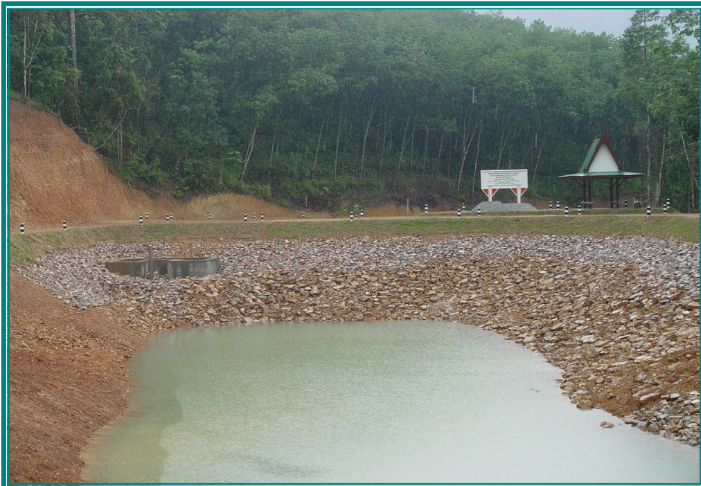
ก่อสร้างแล้วเสร็จ