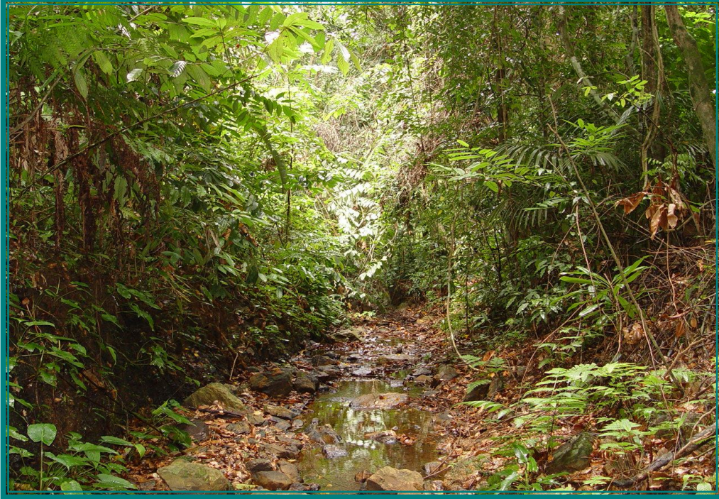
ก่อนก่อสร้าง